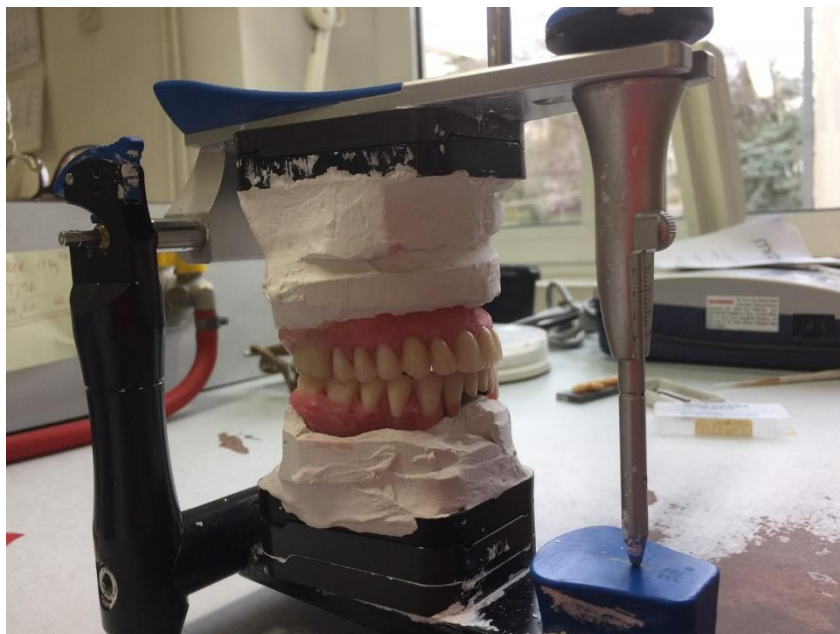
Slika 12. b. Postava zuba u artikulatoru – pogled sa strane

Tehničar postavlja zube u vosku prema uobičajenim pravilima postavljanja. Kod potpune proteze i većih djelomičnih proteza treba načiniti probu postave zuba u ustima kako bi kliničar i pacijent mogli vidjeti izgled buduće privremene proteze. Kod manjih djelomičnih proteza („žabica“) ta se proba obično preskače. U sljedećoj se fazi predaje privremena akrilatna proteza. Provjerava se retencija i stabilizacija. Zatim se provjerava statička i dinamička okluzija. Kod manjih djelomičnih proteza („žabica“) zub/zubi ne smiju biti u dodiru ni u statičkoj niti u dinamičkoj okluziji. Takva privremena proteza s maksimalno reduciranom bazom u službi je estetike, a ne funkcije, na što treba upozoriti pacijenta. Ako se radi o potpunoj protezi, provjerava se i ubrušava okluzija. Uklanjaju se A dodiri (između kvržica vodilja gornjih zuba i potpornih kvržica donjih zuba). Treba postići stabilne dodire na očnjaku i stražnjim zubima (najmanje jedan dodir po zubu), a prednji se zubi ostavljaju blago izvan dodira. Sva navedena pravila vrijede za normokluziju (tj. kad se odnos alveolarnih grebena zadržava i nakon vađenja zuba). Ako pacijent ima malokluziju, vjerojatno će se trebati odstupiti od nekih pravila. Pacijenta treba uputiti u higijenu usne šupljine i predane proteze.