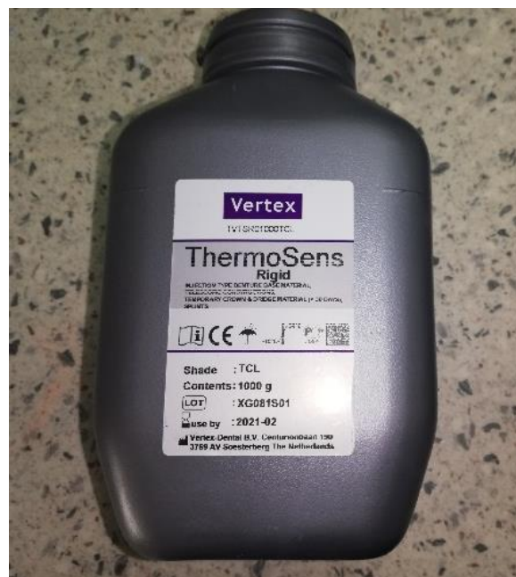
Slika 6. Materijal za poliamidne proteze

Na tržištu postoje brojni poliamidi koji se rabe u stomatologiji, primjerice Valplast, Ultimate, Vertex Thermosens, Deflex itd.