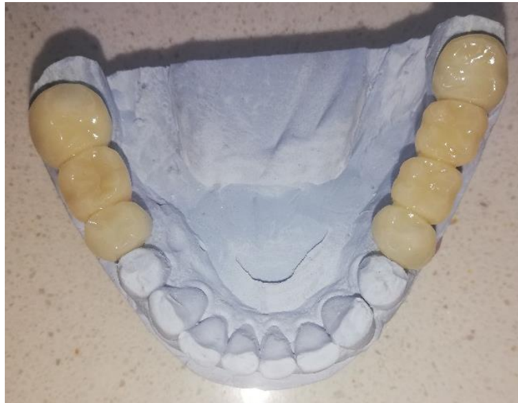
Slika 10. Privremeni akrilatni most

Adhezijski most jest nadomjestak koji se sastoji od međučlana i krila koja se lijepi na oralne plohe susjednih zuba. Može biti izrađen od različitih materijala. Prednosti su u tome što nije uopće potrebno brušenje susjednih zuba ili je minimalno potrebno i što je vrlo komforno rješenje za pacijente koji ne prihvaćaju mobilni nadomjestak („žabicu“). Ova tehnika omogućuje zaštitu mekih tkiva tijekom oseintegracije, tj. od gubitka zuba do završnoga opterećenja (60).