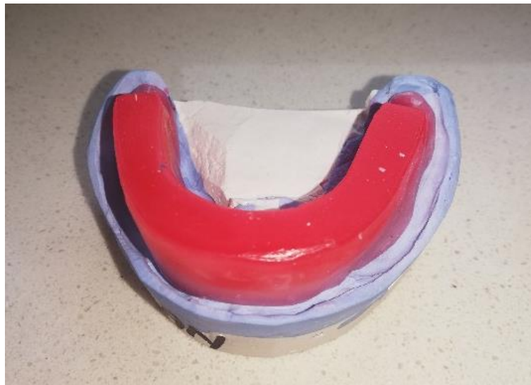
Slika 1. Zagrizna šablona na radnome modelu

Međučeljusni odnosi određuju se pomoću zagriznih šablona koje se izrađuju na radnome modelu (Slika 1.). Zagrizne šablone ne smiju se pomaknuti za vrijeme određivanja međučeljusnih odnosa. Određivanje međučeljusnih odnosa jednostavnije je ako u objema čeljustima postoje zubi, koji osiguravaju taj odnos. To se pogotovo odnosi na zube u lateralnom segmentu, koji definiraju visinu okluzije.