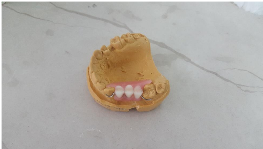
Slika 11. Privremena akrilatna proteza s maksimalno reduciranom bazom („žabica“)

Privremena se proteza, koja će se nositi do izrade konačnoga rada, može napraviti prije ugradnje implantata ili nakon nje. Za uzimanje otiska nakon ugradnje također postoje vremenske varijacije. Idealno je pričekati neko vrijeme kako bi edem tkiva splasnuo i privremena proteza dobila konačan ležaj, pa neće biti potrebno naknadno podlaganje.