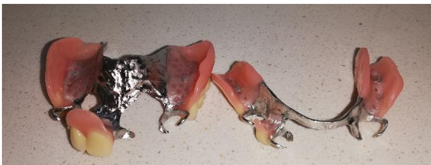
Slika 7. Djelomična akrilatna proteza poduprta metalnim skeletom

Sve se više teži uporabi neplemenitih legura bez nikla zbog njegove povezanosti s nastankom alergijskih reakcija. Danas su u upotrebi slitine bez nikla (npr. Wironit ili Wironium). Prednosti uporabe neplemenitih slitina za lijevanje mobilnih protetskih nadomjestaka jesu u tome što su lakše, što imaju bolja mehanička svojstva, tj. vrlo su tvrde, čvrste i otporne na trošenje i visoke temperature, a sadržavanje kroma čini ih otpornima na elektromehaničku koroziju (37).