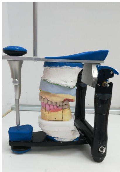
Slika 3. Model postavljen u artikulator

Na taj se način reproduciraju međučeljusni odnosi u centričnoj relaciji / maksimalnoj interkuspidaciji te svim kretanjama mandibule radi studija okluzije prirodnih zuba, dijagnostike disfunkcije žvačnoga sustava, planiranja i izrade svih vrsta protetskih nadomjestaka (17).