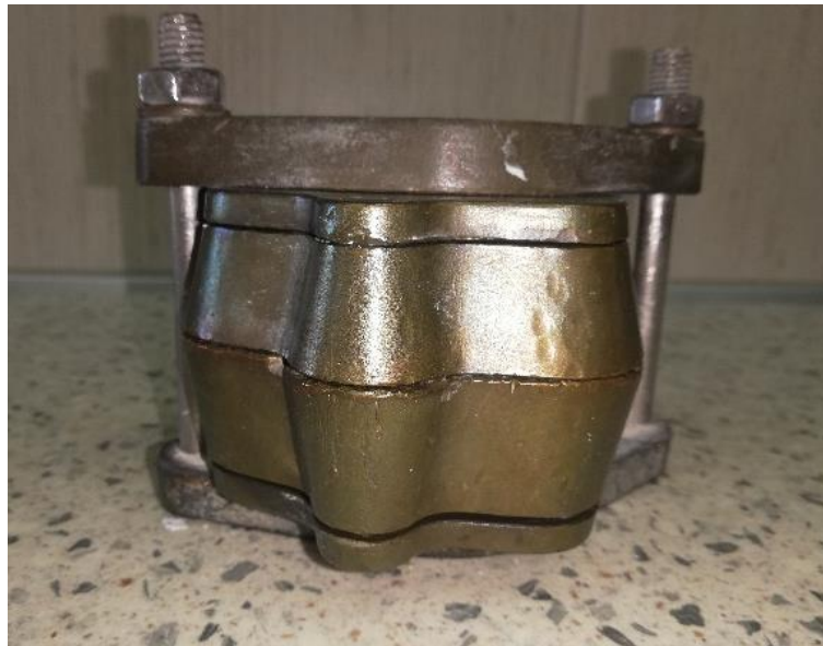
Slika 5. Kiveta

Još uvijek najčešći način izrade baze mobilnih proteza jest toplinska polimerizacija. Ona znači da se akrilatno tijesto nastalo miješanjem PMMA praha i MMA kapljevine stavlja u suvišku u dvodijelni kalup (kivetu) (Slika 5.) ili se ubrizgava pod pritiskom u posebne kivete, a pritisak ostaje do kraja polimerizacijskog postupka.