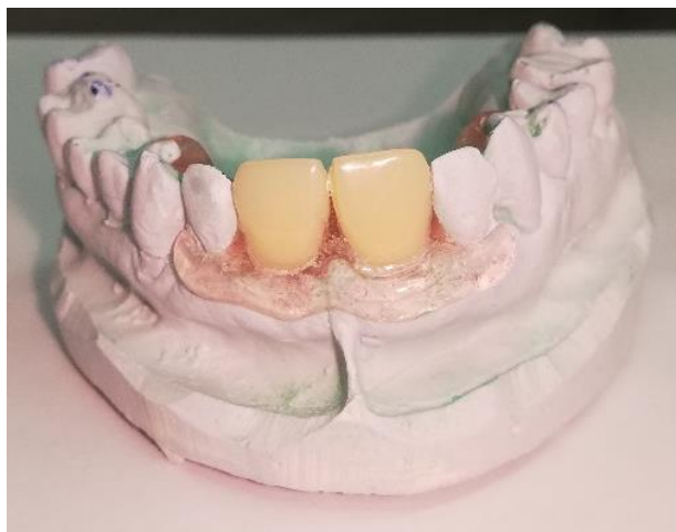
Slika 9. b. Privremena poliamidna proteza, pogled sprijeda

Privremena proteza može se izraditi i s metalnom (lijevanom) bazom. Za razliku od jednostavne akrilatne proteze, ovaj nadomjestak umjesto plastične ima metalnu bazu, kvačice su stabilnije i preciznije priliježu na zube. Zbog gracilnije konstrukcije ugodnija je za nošenje. Velike su prednosti ovoga rada relativno stabilno prilijezanje te mogućnost korekcija i podlaganja. Ako su kvačice u vidljivom području, estetika nije zadovoljavajuća (4). Iako je moguće izraditi ovu vrstu proteze kao privremeni nadomjestak, treba napomenuti da se to u praksi rijetko čini zbog kompliciranijega tijeka izrade i zbog financijskih razloga.