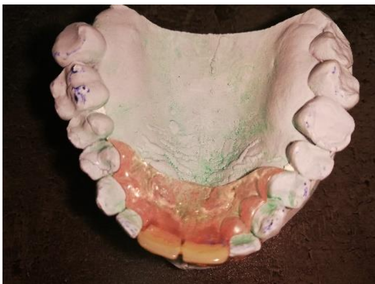
Slika 9. a. Privremena poliamidna proteza, okluzalni pogled