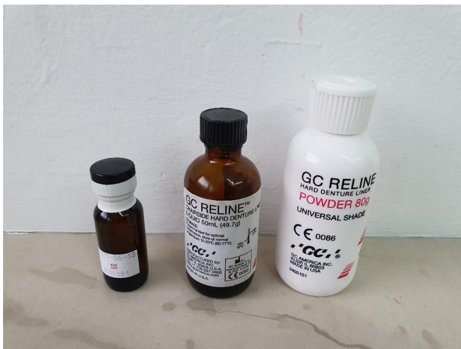
Slika 13. Materijal za podlaganje