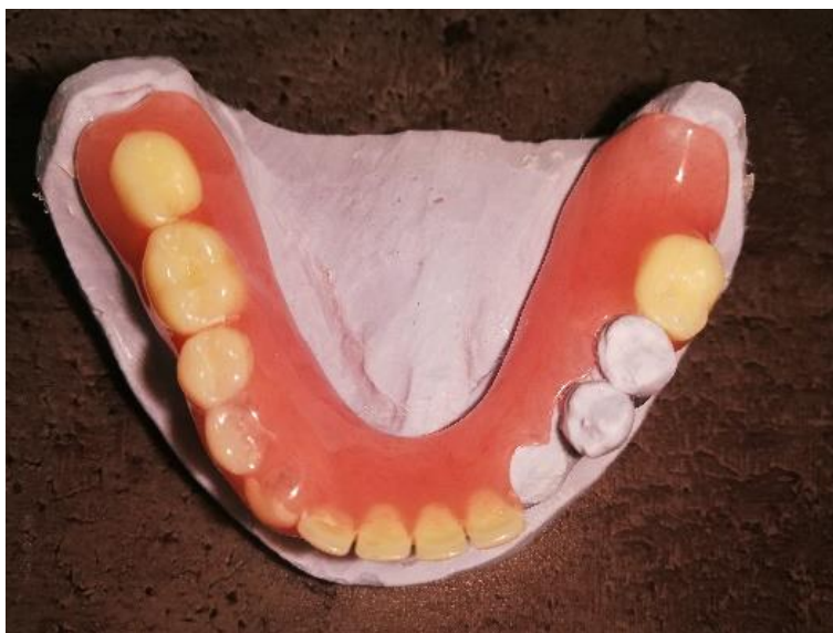
Slika 8. Privremena akrilatna proteza

isplativosti. U svakom slučaju pacijenta treba uputiti u način održavanja oralne higijene vlastitih zuba te higijene proteze (57).