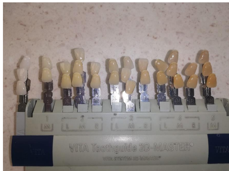
Slika 4. Ključ boja

Boja umjetnih zuba odabire se pri dnevnome svjetlu pomoću ključa boja, a treba biti usklađena s bojom očiju, kose i kože te s dobi pacijenta. Također je važno osvjetljenje, kut promatranja, promatračeva temeljna sposobnost razlikovanja boja i njegovo iskustvo. Ova je metoda subjektivna i ovisi o ograničenjima ključa boja (Slika 4.).