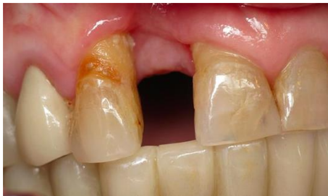
Slika 3. Restaurativni status susjednih zuba.