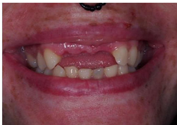
Slika 2. Produžen bezubi prostor u estetskoj zoni. Preuzeto uz dopuštenje autora: Luka Stojić, dr. med. dent.

Pri nedostatku dvaju ili više zuba u fronti povećava se estetski rizik ponajprije zbog nepredvidljivosti ponašanja mekog i koštanog tkiva, ali i otežanog uspostavljanja simetričnih odnosa (Slika 2.). Odlučujući čimbenik u odabiru broja implantata jest širina bezubog prostora, pri čemu je potrebno poštovati razmak koji između dvaju implantata mora biti 3 mm, a između implantata i prirodnog zuba 1,5 mm. Ako, primjerice, u bezubom prostoru u kojemu nedostaju tri zuba nije moguće poštovati navedene razmake, ne mogu se izraditi zasebne krunice na implantatima, nego prednost valja dati mostu. To u estetskoj zoni može značiti da se, u slučaju nedostatka očnjaka i bočnoga sjekutića, implantat ugrađuje na položaj očnjaka te se izrađuje privjesni most kojim se nadomješta sjekutić (3). U takvoj se situaciji međučlanom, u pravilu, jednostavnije postiže estetski rezultat nego implantatom. Ako se u navedenoj situaciji ugrade dva implantata, zbog nepoštovanja zadanih razmaka između dvaju implantata te implantata i zuba, nastaje gubitak potporne interproksimalne kosti i interdentalne papile uz narušenu crveno-bijelu estetiku.