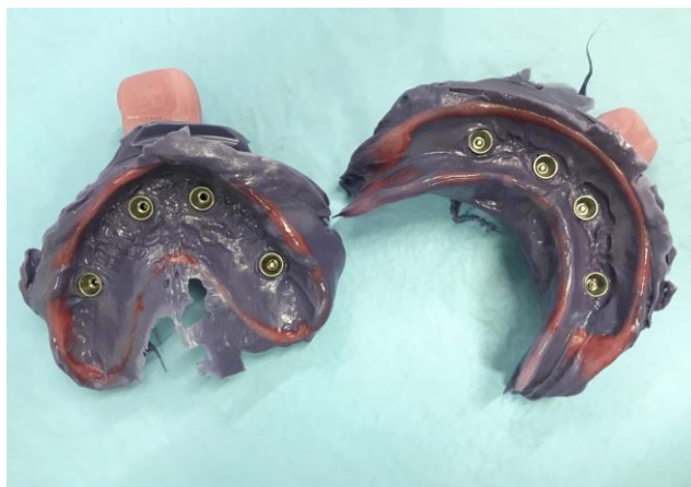
Slika 5. Definitivni otisci iz polietera