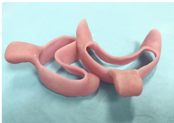
Slika 3. Individualne žlice.

Svrha otiskivanja jest precizan prijenos informacija dentalnom tehničaru o trodimenzionalnom položaju implantata u čeljusti, položaju vrata implantata te njegovu odnosu s periimplantatnim mekim tkivima. Otisak za izradu privremenog ili definitivnog rada u konceptu All-on-4 izrađuje se korištenjem tehnike otvorene individualne žlice uz korištenje otisnih prijenosnika (Slika 3). Kada otisak uzimamo neposredno nakon ugradnje dentalnih implantata i postave Multi-unit™ nadogradnji preko otisnih prijenosnika treba postaviti zaštitnu platicu-koferdam kako otisni materijal ne bi zaostao u periimplantatnim mekim prostorima s obzirom na postojanje svježih rana i kako bismo osigurali suho radno polje nakon operacije. Sve je to puno lakše prilikom otiskivanja za definitivni protetski nadomjestak kada su meka tkiva stabilna (Slika 4).