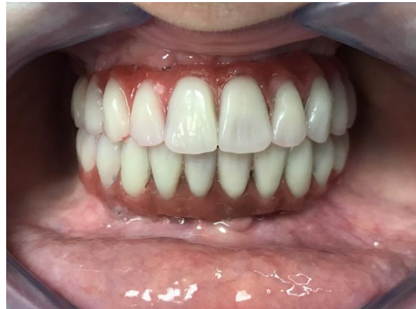
Slika 13. Prijenos postave na metalne konstrukcije.