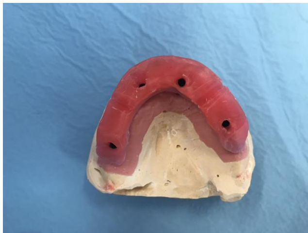
Slika 6. Izgled probne baze.

Odnos ozubljene gornje i donje čeljusti određen je okluzijskim površinama gornjih i donjih prirodnih zuba. Okluzija zuba u suglasju je s čeljusnim zglobovima. Gubitkom zuba gubi se oslonac mandibule na maksili, a mišići koji drže donju čeljust se skraćuju. Time se mijenja vertikalna dimenzija donje trećine lica, kao i odnos donje čeljusti prema gornjoj čeljusti i bazi lubanje. Nakon gubitka svih prirodnih zuba i resorpcije koštanog tkiva između gornjeg i donjeg bezubog grebena ostaje prostor koji će popuniti protetski rad. U bezubih osoba izgubljeni su mnogi anatomske činitelji koji označavaju vertikalnu dimenziju okluzije. Stoga je precizno određivanje vertikalne dimenzije u bezubim ustima vrlo teško (2).