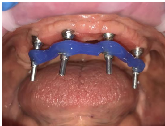
Slika 4. Postavljanje otisnih prijenosnika

Optimalan otisni materijal je polieter. Budući da kvaliteta radnog modela ovisi o točnosti reprodukcije detalja otiskom, precizan otisak čini temelj izrade nadomjeska s preciznim dosjedom na noseću strukturu. Nepreciznost, s druge strane, za posljedicu ima nadomjeske koji ne odgovaraju u potpunosti kliničkoj situaciji, što može uzrokovati i tehničke i biološke komplikacije. S tim u vezi opisane su komplikacije poput popuštanja fiksacijskih vijaka, lomova vijaka, lomova vrata implantata te okluzijske netočnosti (49, 50). Kod fiksnih