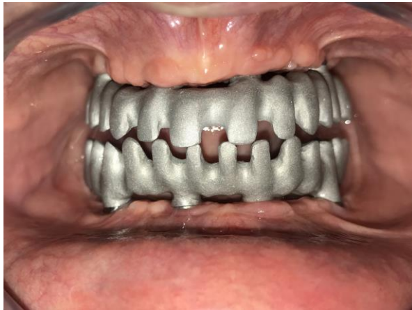
Slika 12. Proba metalnih konstrukcija.