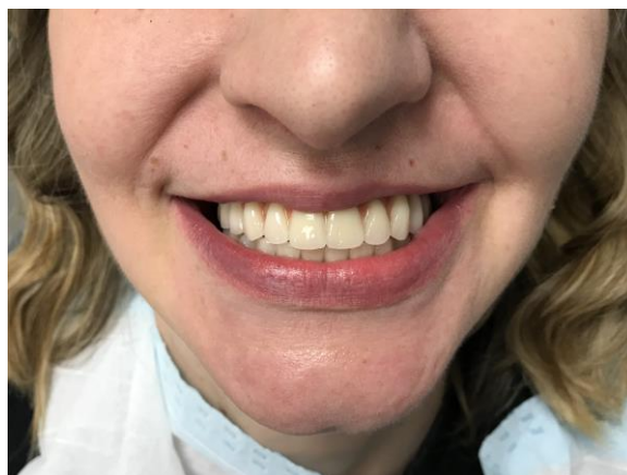
Slika 15. Gotov metal-kompozitni most (osmijeh).