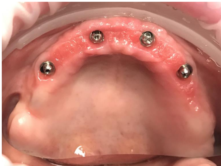
Slika 2. ALL-ON-4 s Multi-unit™ nadogradnjama (klinički prikaz).