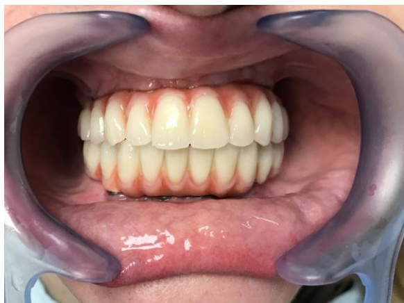
Slika 14. Gotov metal-kompozitni most.