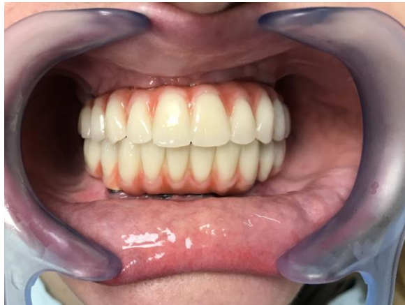
Slike 14. Gotov metal-kompozitni most.