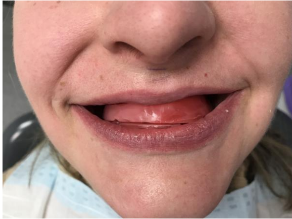
Slike 7. Probne baze.