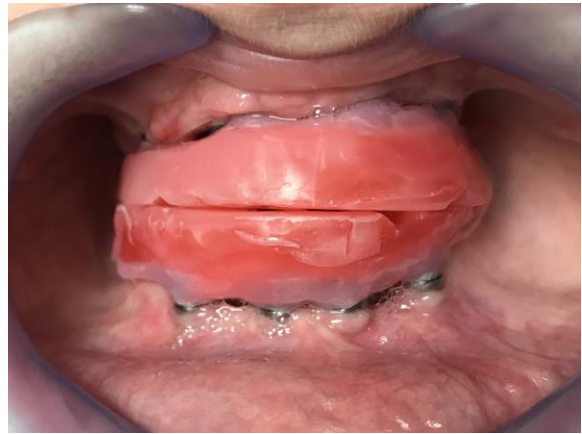
Slika 8. Probne baze dovedene u položaj centrične relacije.

Pomoću obraznog luka model gornje čeljusti je moguće prenijeti u artikulaturu i postaviti u isti prostorni odnos prema čeljusnim zglobovima i bazi lubanje kakav ima maksila u ustima pacijenta. To omogućuje točniji luk zatvaranja u artikulaturu. Obrazni je luk pomagalo slično kliznoj mjerki pomoću kojeg se određuje položaj gornje čeljusti prema prosječnoj ili točno određenoj transverzalnoj šarnirskoj osi i prema referentnoj ravnini glave. Služi za ispravnu prostornu orijentaciju modela gornje čeljusti prema kondilima i bazi lubanje. Dva su tipa obraznih lukova za prijenos modela gornje čeljusti u artikulaturu: