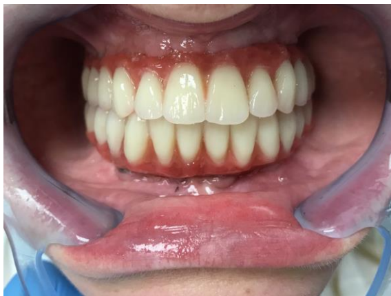
Slike 10. Proba postave.

zubnom nizu moraju se postaviti tako da osiguraju ispravan oslonac usnicama, da imaju zadovoljavajući izgled i da omogućuju pravilan izgovor. Osim toga, prednji zubi trebaju osigurati nesmetano incizalno vođenje. Gornji i donji prednji zubi najčešće se postavljaju, u manjoj ili većoj mjeri, ispred bezubih grebena. Koliko će se ti zubi postaviti ispred bezubog grebena, ovisi o stupnju resorpcije koštanog tkiva nakon vađenja zuba. U postavi se vodi računa o odnosu prednjih zuba prema horizontalnoj, frontalnoj i sagitalnoj ravnini (Slika 11). Oblik zuba odabrat ćemo s obzirom na oblik pacijentova lica te oblik alveolnog grebena, što se obično podudara.