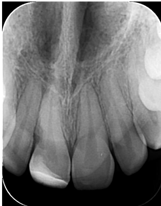
Slika 9. Rendgenski nalaz nakon uspješno provedene terapije