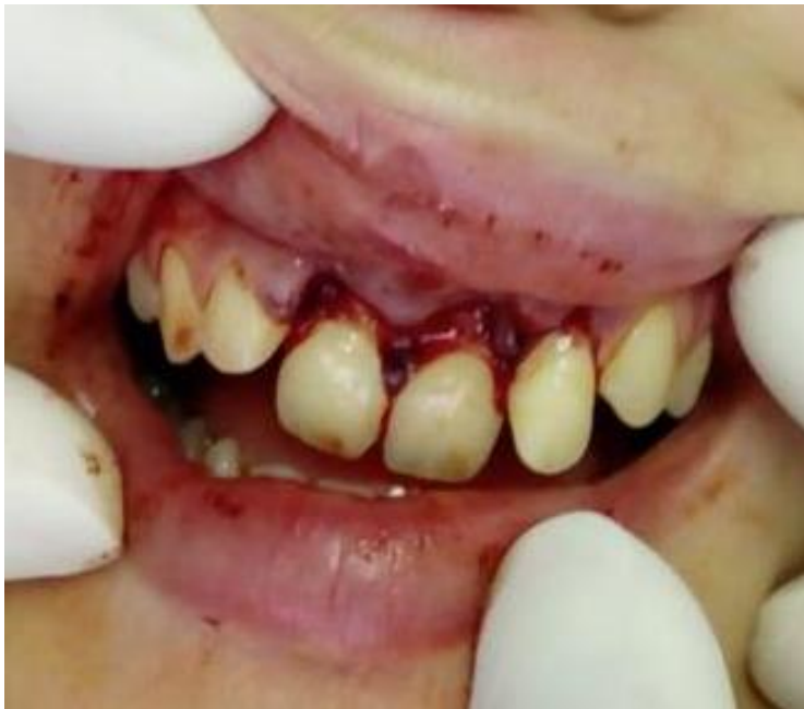
Slika 5. Ekstruzija zuba

Prikaz slučaja: pacijentica Dora Despenić stara 16 godina zaprimljena je 22.05.2018 na Zavod za dječju i preventivnu dentalnu medicinu gdje joj je dijagnosticirana ekstruzija gornjih središnjih i lateralnih sjekutića (vidi Sliku 5.) Trauma je uzrokovana padom u nesvijest na školskoj priredbi. Osim luksacijske ozljede pacijentica je ozlijedila i meka tkiva, gornju i donju usnu, te gingivu. Nakon što je snimljena rendgenska slika, uslijedio je klinički pregled na kojem je ustanovljeno da su traumatizirani zubi patološki pomični, bolni na palpaciju i perkusiju, a vitalitet im je negativan, te je napravljena rendgenska analiza. Terapija se sastojala od frenulektomije, postavljanja šavova, zaustavljanja krvarenja, repozicije 11, 21 i 22 te imobilizacije žičanokompozitnim splintom uz lokalnu topikalnu primjenu Medazola i lokalnog anestetika (vidi Sliku 6. i 7.) Pacijentici su nakon tjedan dana izvađeni šavovi i napravljen test vitaliteta koji je za 12 pozitivan, a za 11, 21, 22 negativan. Nedugo nakon toga uslijedilo je skidanje splinta, ponovio se test vitaliteta koji je bio pozitivan za sve traumatizirane zube, jedino što su zubi bili lagano pomični, lagano osjetljivi na perkusiju, a zub 11 je malo promijenio boju.