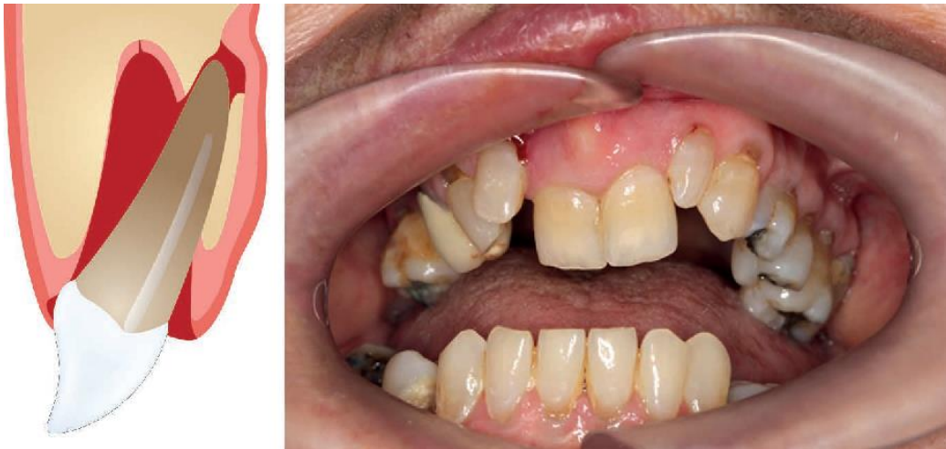
Slika 2. Lateralna luksacija 11 i 21 (preuzeto iz Oral surgery II: Part 1. Acute management of dentoalveolar trauma)