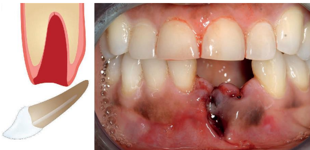
Slika 4. Avulzija zubi 31 i 32 (preuzeto iz Oral surgery II: Part 1. Acute management of dentoalveolar trauma)