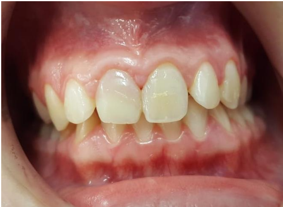
Slika 8. Ekstraoralna slika središnjih i lateralnih sjekutića nakon uspješno provedene terapije