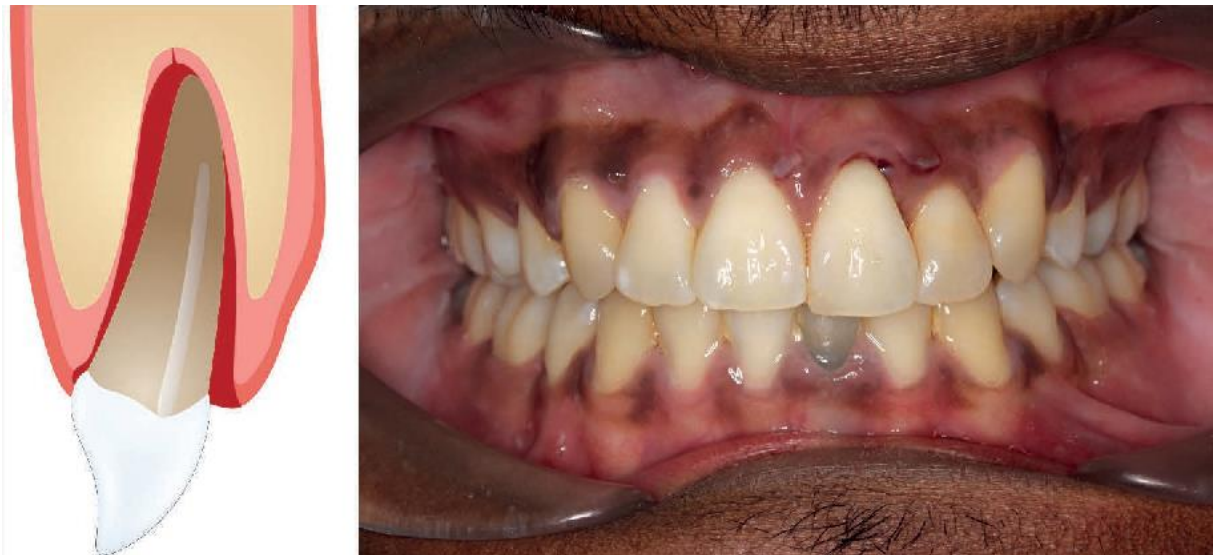
Slika 1. Ekstruzija zuba 21 (preuzeto iz Oral surgery II: Part 1. Acute management of dentoalveolar trauma)