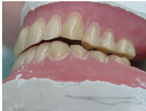
Slika 2. Tijekom laterotruzijske kretnje zubi neradne strane su diskudirani.