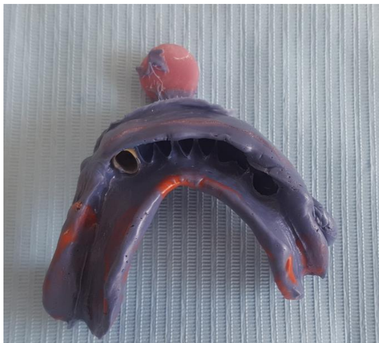
Slika 11. Funkcijski otisak donje čeljusti