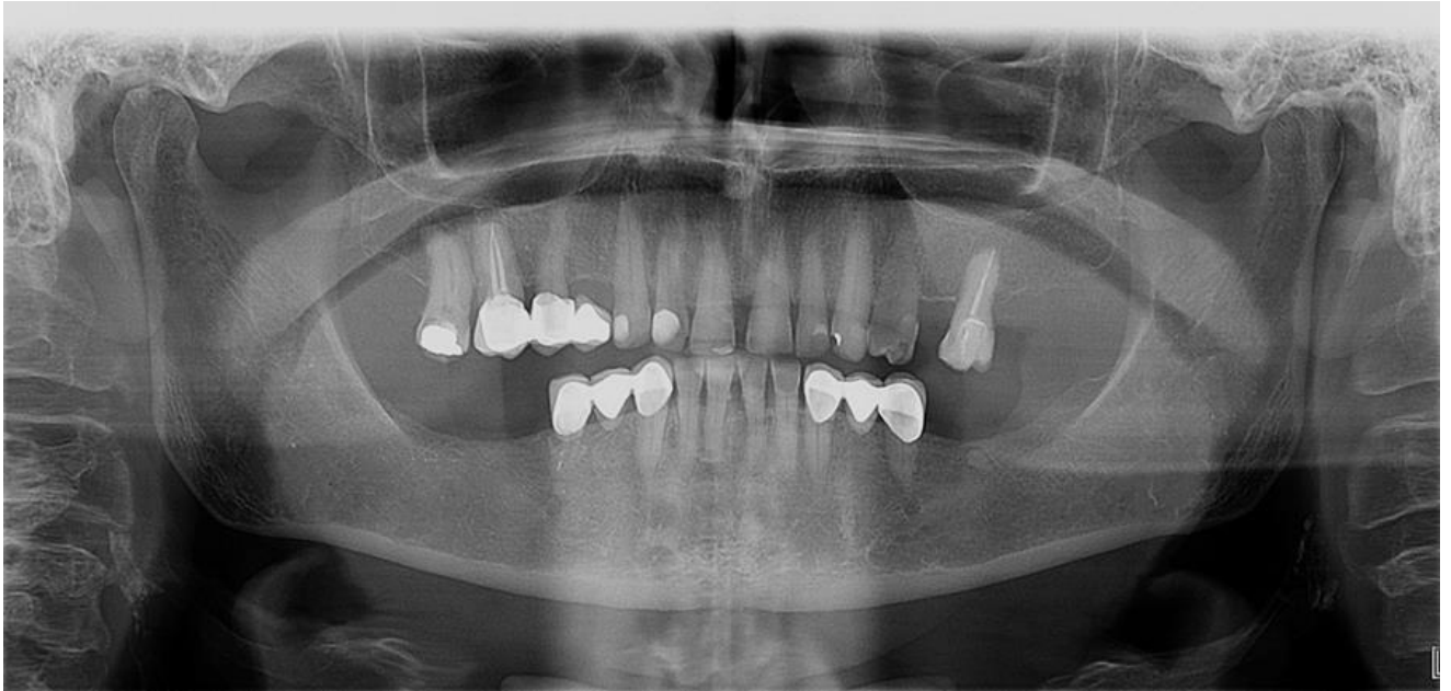
Slika 1. Ortopantomogram prije početka terapije

proba u ustima pacijentice. Nakon što je ustanovljeno da proteza zadovoljava sva pravila estetike i funkcije, rad je cementiran stakloionomernim cementom (FujiCEM 2, GC, Tokyo, Japan), a pacijentici su dane upute o nošenju i održavanju proteze (slike 17 i 18).