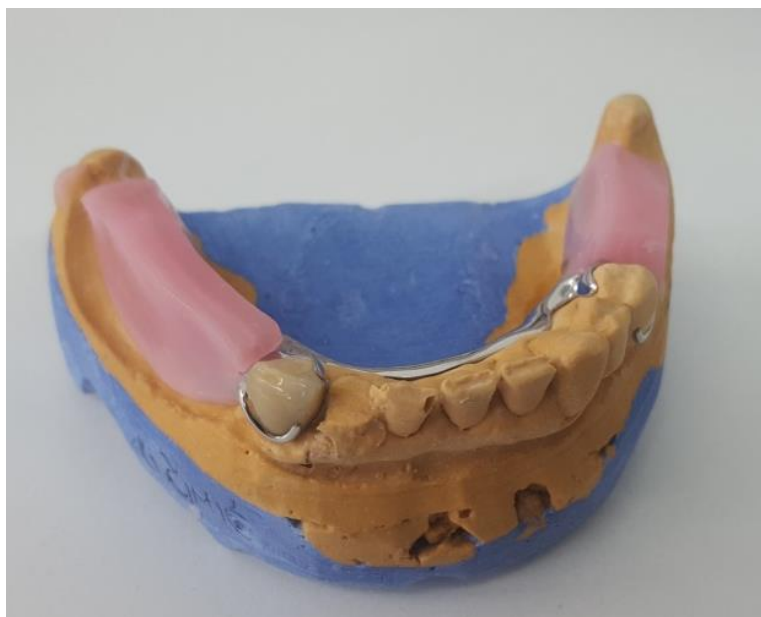
Slika 12. Metalna konstrukcija donje djelomične proteze s nagriznim bedemima