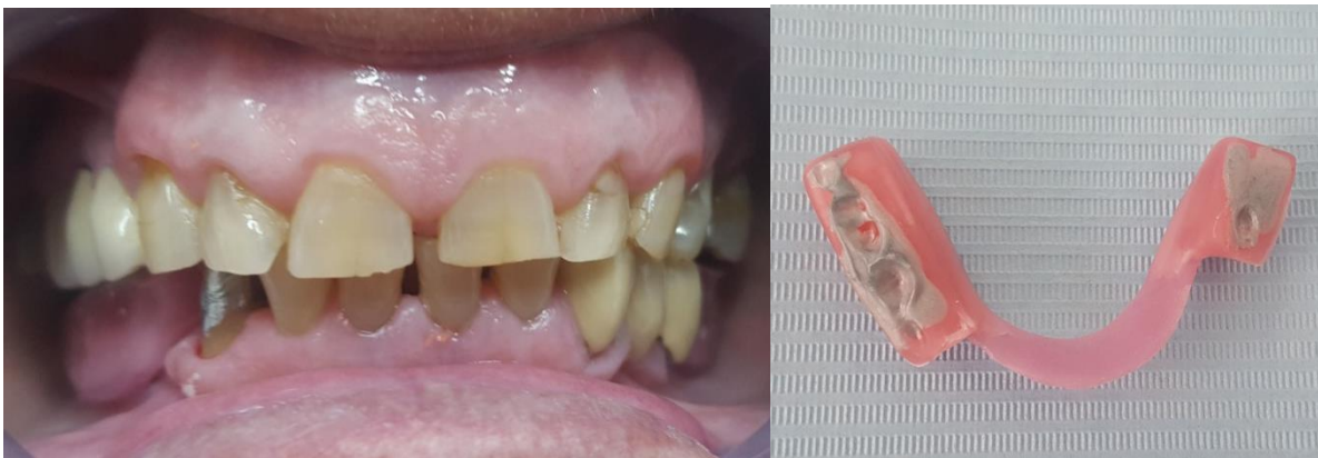
Slika 6. i 7. Određivanje međučeljusnih odnosa za krunicu