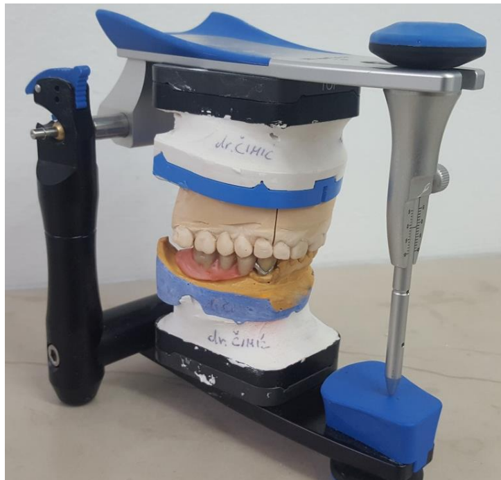
Slika 16. Postava zuba u artikulatoru