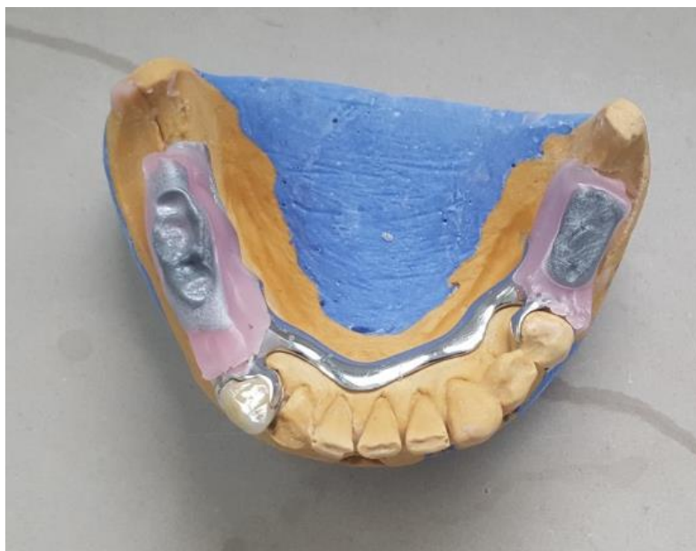
Slika 13. Određivanje međučeljusnih odnosa za djelomičnu protezu