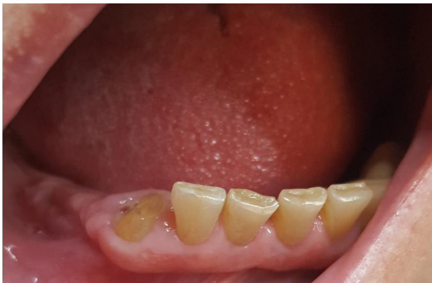
Slika 2. Preparacija zuba 43 za nadogradnju