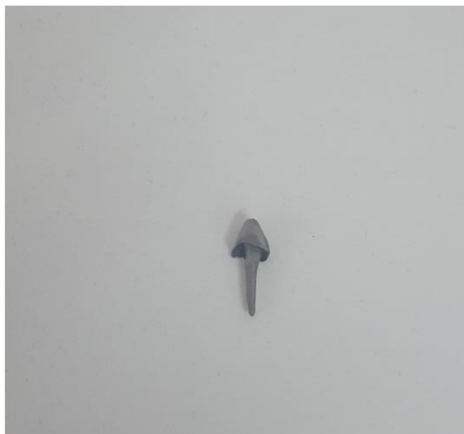
Slika 3. Metalna lijevana nadogradnja