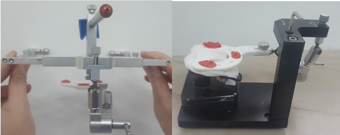
Slika 14. i 15. Prijenos međučeljusnih odnosa u artikulator