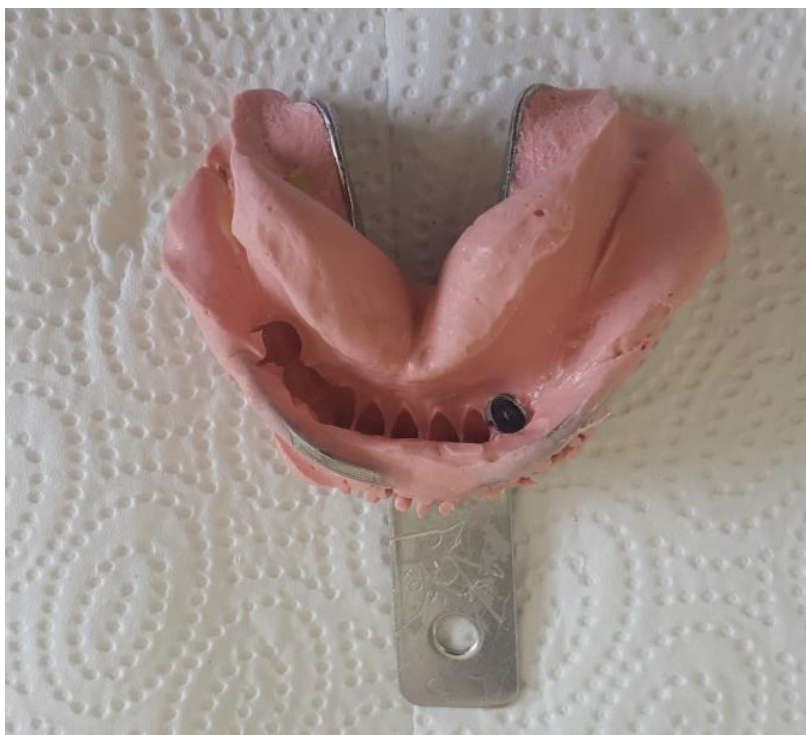
Slika 10. Alginatni otisak donje čeljusti za individualnu žlicu