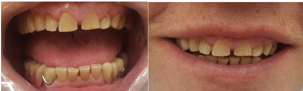
Slika 17. i 18. Predaja gotovog rada