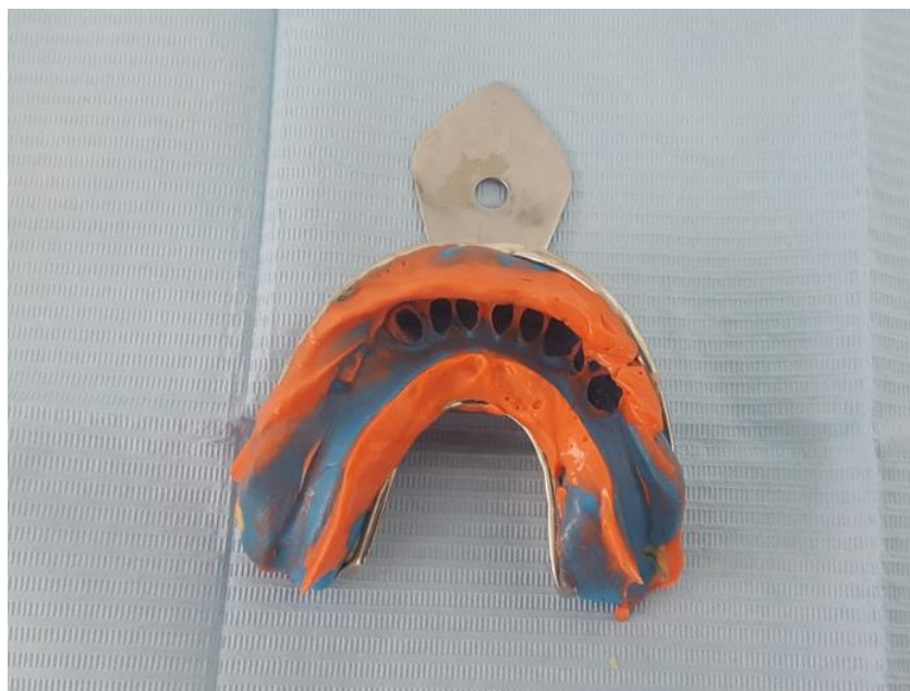
Slika 4. Korekturni otisak donje čeljusti