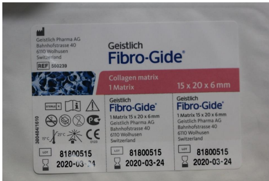
Slika 1. Fibro-Gide® kolageni matriks. Preuzeto s dopuštenjem autora: prof. dr. sc. Darko Božić.