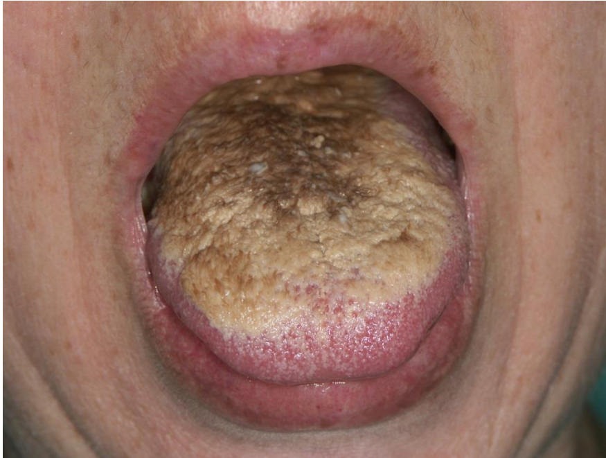
Slika 4. Crni obloženi jezik.

ambulanti moguće napraviti mehaničko uklanjanje naslaga s površine jezika uz pomoć prethodne primjene lokalnih keratolitika sa salicilnom kiselinom. Ako je obloženost jezika manja, pacijent ju može liječiti i sam, struganjem dorzuma jezika nekoliko puta tjedno, posebnom četkicom ili strugačem za jezik.