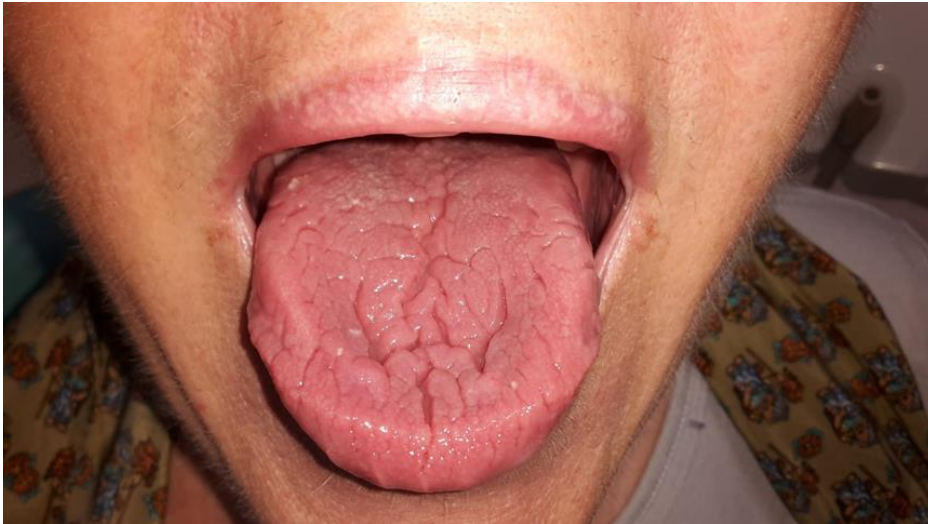
Slika 2. Fisurirani jezik.

Terapija: Terapija fisuriranog jezika nije potrebna. Ako su fisure dublje te češće dolazi do upale zbog zadržavanja hrane, pacijentima se preporučuje intenzivnije održavanje oralne higijene te upotreba antiseptika.