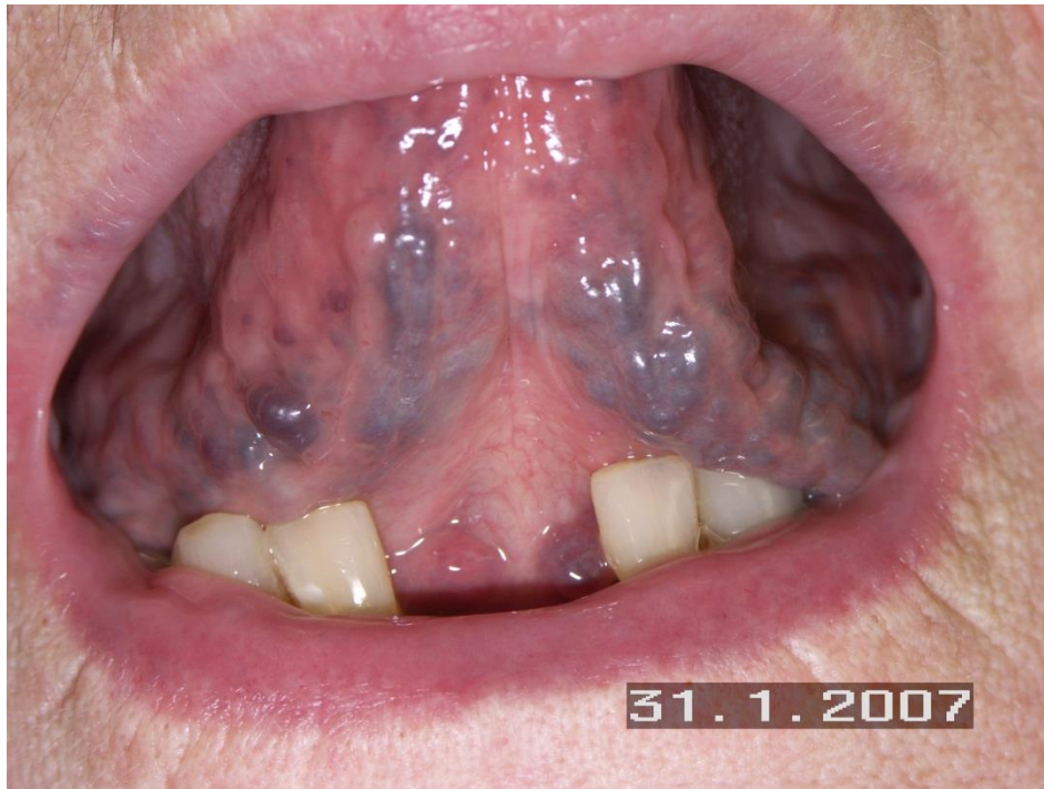
Slika 3. Jezični varikoziteti.

Terapija: Liječenje nije potrebno jer podjezični varikoziteti ne podliježu rupturama i krvarenju (12).