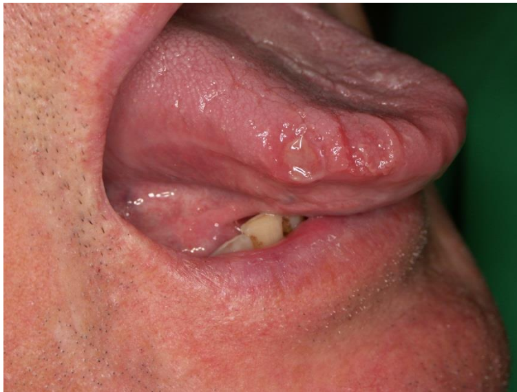
Slika 12. Aftozna ulceracija na jeziku.

Terapija: U terapiji ulkusa ordiniraju se protuupalni lijekovi, a ako ulkus ne cijeli dulje od dva tjedna – indicirana je biopsija (1).