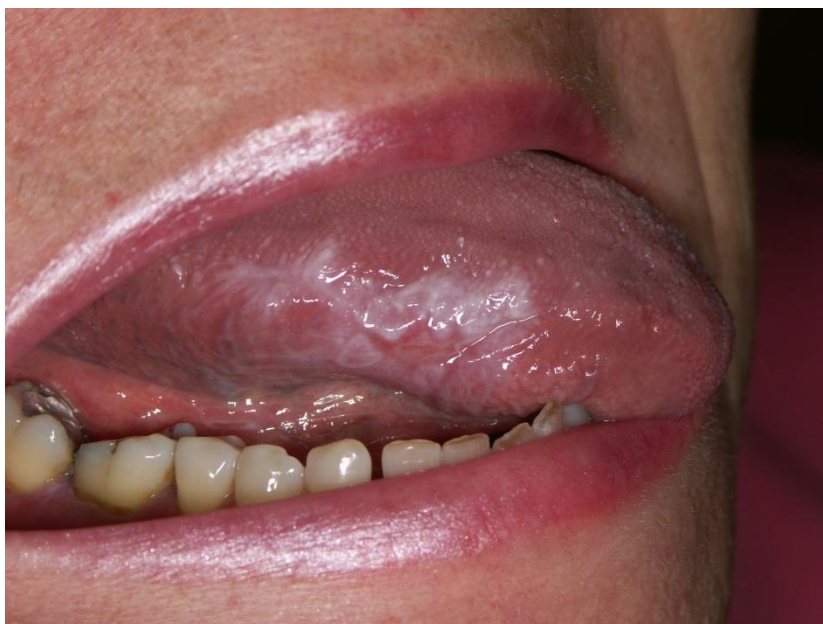
Slika 7. Lihenoidna reakcija na amalgam.

Često postoji problem s ukidanjem ili zamjenom terapije koja se pokazala učinkovitom u liječenju sistemske bolesti. Tada se vodimo mišlju o tome što predstavlja veći rizik za pacijentovo zdravlje. Valja naglasiti da je oralna lihenoidna reakcija kao i OLP potencijalno zloćudna lezija koja se može transformirati u oralni karcinom! Radi li se o dentalnim materijalima, njih treba ukloniti i zamijeniti, a dođe li do povlačenja lezija to je ujedno dokaz i terapija lihenoidne reakcije. Od terapije se primjenjuju lokalni antiseptici i kortikosteroidi (21, 22).