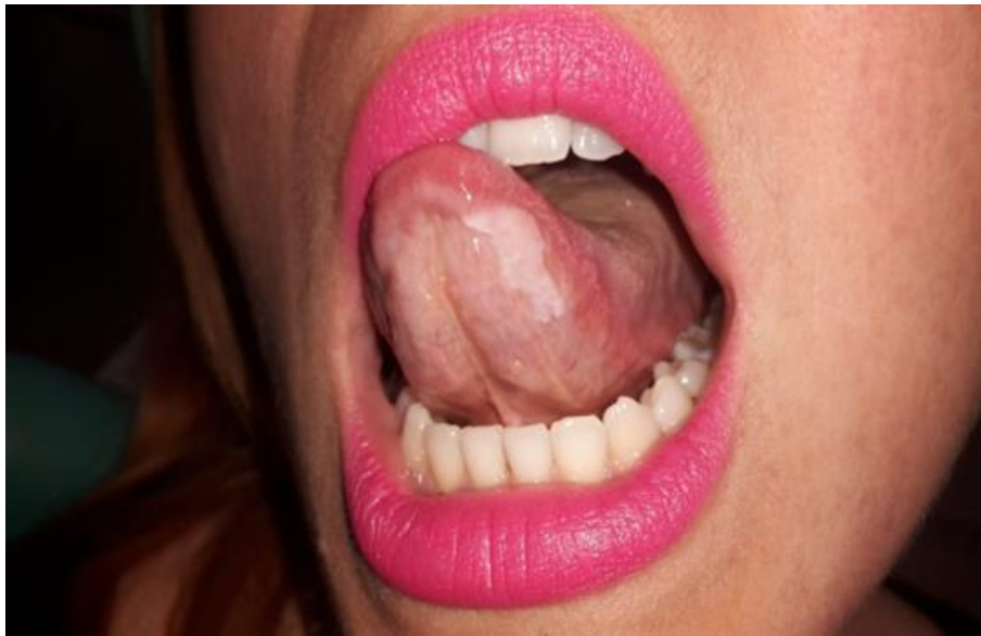
Slika 9. Leukoplakija.