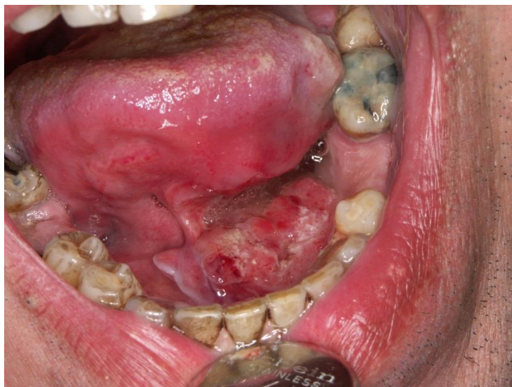
Slika 14. Karcinom podjezičnog prostora.