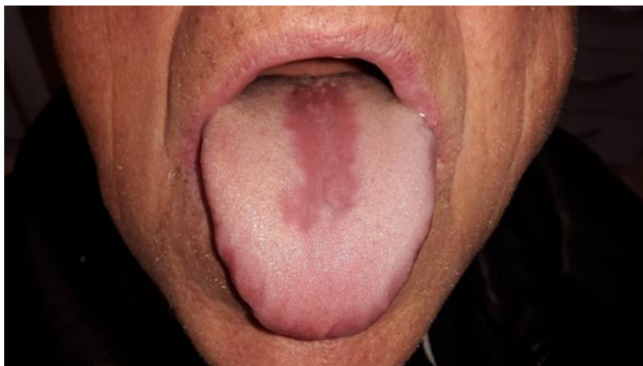
Slika 10. Medijalni rombični glositis.

Terapija: U liječenju rombičnog glositisa ordiniramo lokalne i/ili sustavne antimikotike. Uvjet za terapiju je prisutnost kandida i odgovarajuća klinička slika. Prvi izbor su lokalni antimikotici, a ako se radi o tvrdokornijim slučajevima koristi se sistemska terapija. Pri upotrebi sistemskih antimikotika, nužno je provjeravati jetrene probe jer su izrazito hepatotoksični (26).