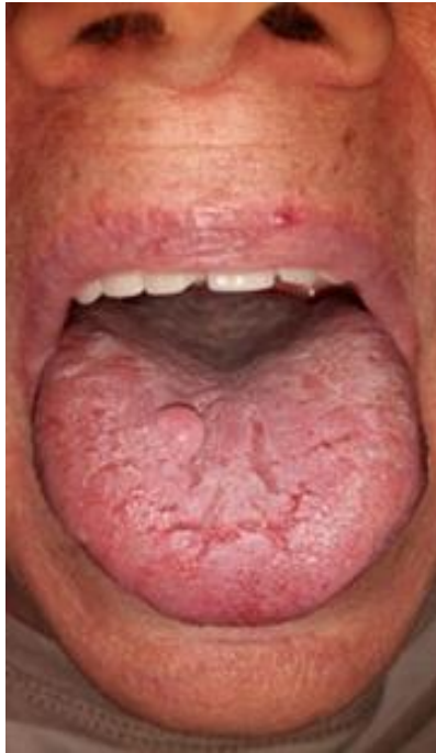
Slika 11. Fibrom na jeziku.

Terapija: Fibrom uklanjamo kirurški, ekscizijom dijela sluznice na kojoj se tvorba nalazi. U svrhu sprječavanja recidiva, moraju se isključiti elementi iritacije koji dovode do nastanka fibroma (33).