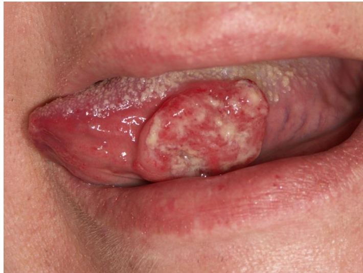
Slika 13. Karcinom jezika.

godine dana da bi se razvile kronične nuspojave poput radijacijskog karijesa, trizmusa i osteoradionekroze. Kod uznapredovalih slučajeva ili recidiva, koji imaju malu šansu izlječenja prethodnim terapijskim pristupima, kao opcija liječenja koristi se kemoterapija (cisplatin, karboplatin, 5-fluorouracil, paklitaksel...) (35). U ranom stadiju petogodišnje preživljenje iznosi 80%, dok u uznapredovalom stadiju tek 40%. Bolesnici s razvijenim metastazama umiru u roku od 4 mjeseca (35).