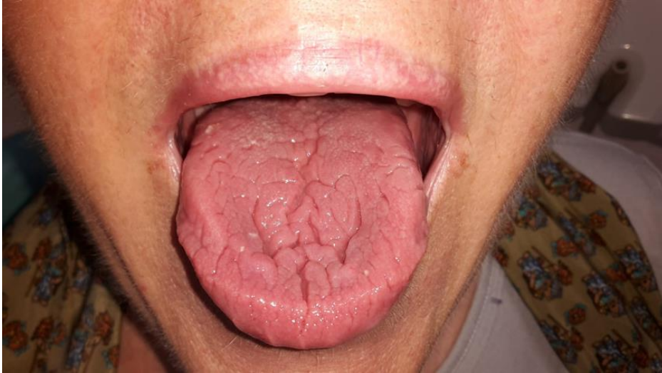
Slika 2. Fisurirani jezik.

Terapija: Terapija fisuriranog jezika nije potrebna. Ako su fisure dublje te češće dolazi do upale zbog zadržavanja hrane, pacijentima se preporučuje intenzivnije održavanje oralne higijene te upotreba antiseptika.