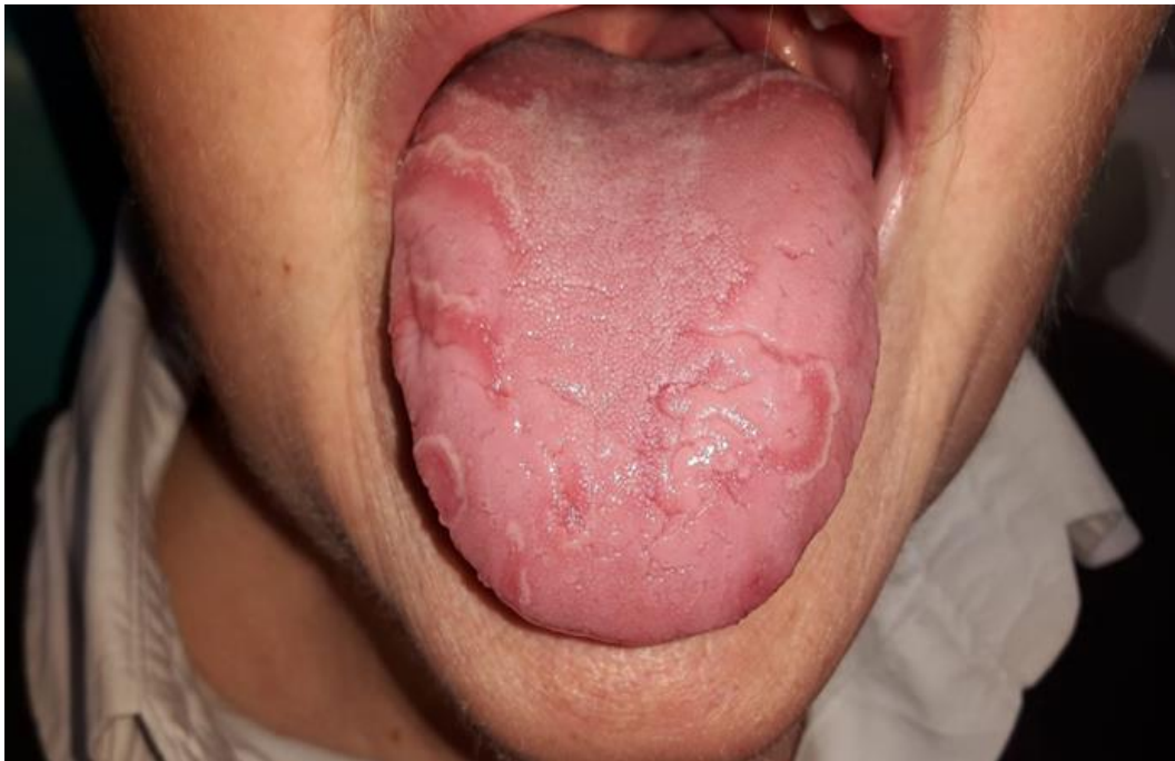
Slika 1. Geografski jezik.