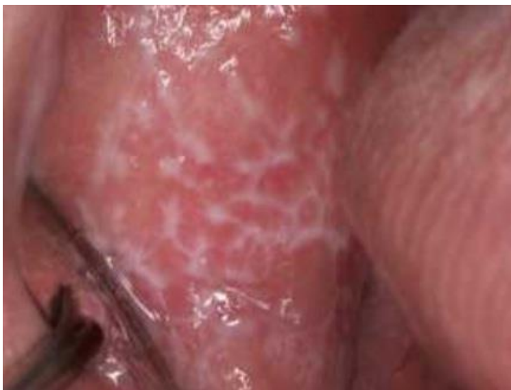
Slika 8. Oralni lihen planus.

lokalne kortikosteroide (0,05-postotni fluocinolon ili 0,05-postotni klobetazol). Kortikosteroidi imaju imunosupresivno i protuupalno djelovanje (26). Suportivno se uz topikalne kortikosteroide mogu primjenjivati antimikotici i antiseptici. U slučajevima većih erozija, kortikosteroide je moguće ordinirati i perilezijski ili sustavno (21, 22).