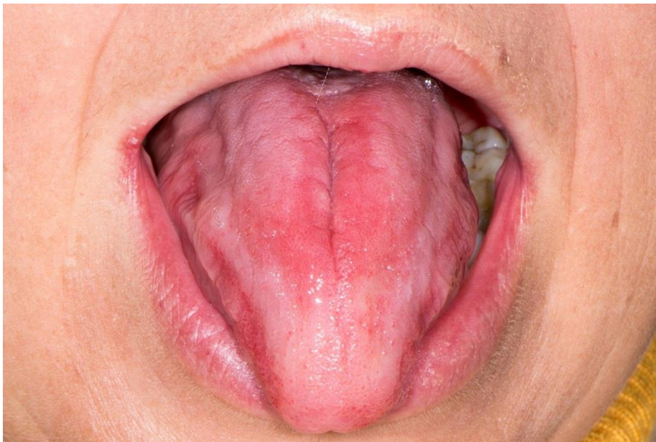
Slika 5. Atrofija jezika uslijed manjka vitamina B12.

Terapija: Cilj liječenja je smanjiti bol i osjetljivost jezika te dovesti do reepitelizacije. Ovisno o težini ili uzroku atrofije, ordinira se terapija. Loše i neobrađene radove treba popraviti ili napraviti nove. Nedostatak vitamina ili željezo liječimo nadoknadom istih. Nadomjeske željeza potrebno je uzimati barem dva mjeseca te nakon pauze ponovno provjeriti krvnu sliku. Terapiju lijekovima koji dovode do nastanka atrofije ukidamo (ako je moguće). U slučaju infekcijskih bolesti ordiniraju se antibiotici ili antimikotici.