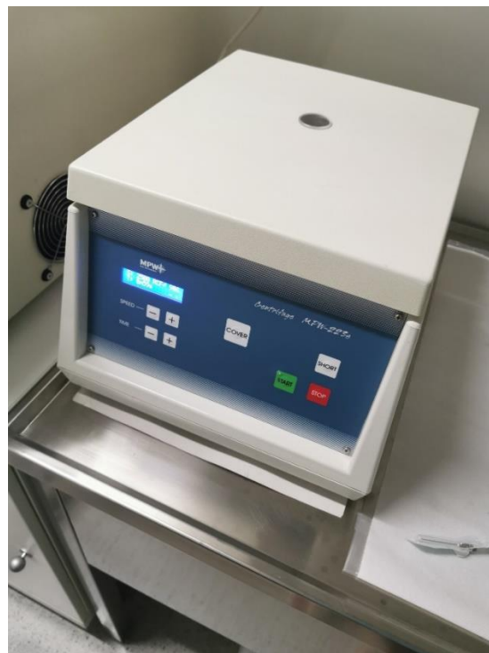
Slika 5. Uredaj za centrifugiranje