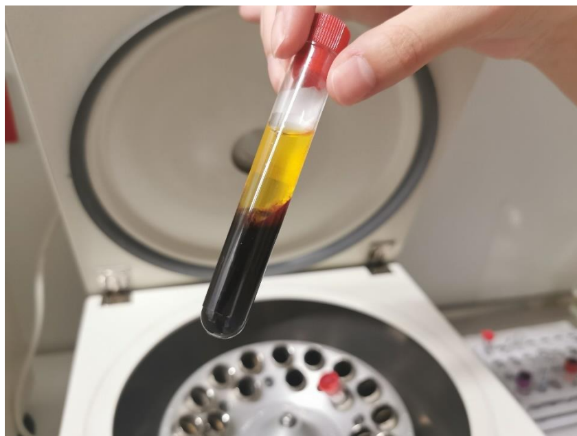
Slika 10. Kod korištenja nenahrapavljene plastične epruvete ne dolazi do stvaranja PRF ugruška.

Centrifugiranje se odvija kroz 10 minuta na 2500 o/min odnosno RCF (max) 559 g prema Choulkrounu (2006.), te se dobiva troslojni koloid, na površini tekući PPP, ispod njega PRF i na dnu sloj eritrocita (18). Postoje znatne razlike među autorima s obzirom na preporučeno optimalno trajanje centrifugiranja i relativnu centrifugalnu silu koja se upotrebljava, čak i pri korištenju iste opreme i istih količina krvi. Pojedini su autori mijenjali i usavršavali svoje formulacije tako da se one razlikuju tijekom godina. Choulkroun, Miron i Ghanaati objašnjavaju razlike u pojedinim radovima time da RCF nije jednak na vrhu epruvete, na sredini i na dnu. RCF se povećava eksponencijalno s povećanjem radijusa te je najveći na dnu epruvete. Internacionalni je dogovor da se centrifugalna sila izražava kao RCF (max), no u stručnoj literaturi postoje mnoga odskakanja od toga pravila što doprinosi konfuziji i otežava standardizaciju postupka (12). U priloženoj tablici 2. mogu se vidjeti neke razlike u navođenju relativne centrifugalne sile, pri čemu RCF (max) označava relativnu centrifugalnu silu na dnu epruvete gdje je sila najjača s obzirom na najveću udaljenost od rotora, RCF (min) označava silu na vrhu epruvete, RCF (av) označava srednju relativnu centrifugalnu silu, a