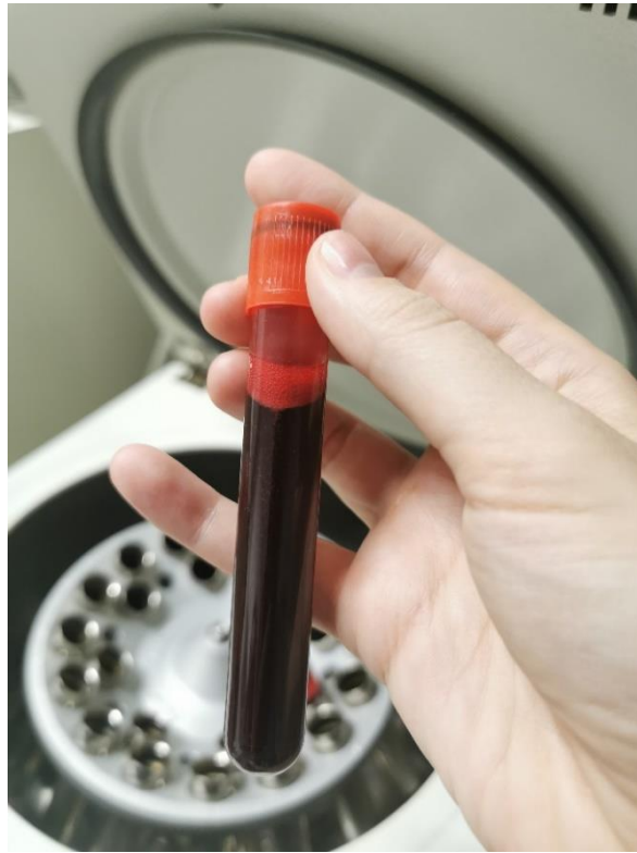
Slika 4. Izgled pune krvi prije centrifugiranja