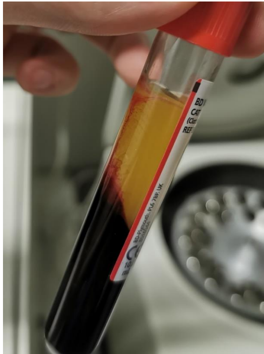
Slika 6. Produkt centrifugiranja na 2500 rpm (906 RCF) kroz 10 minuta