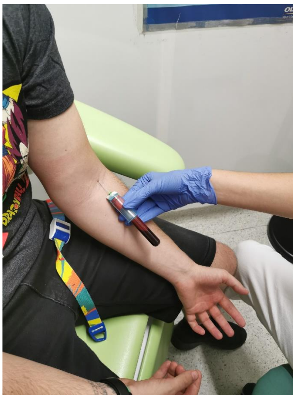
Slika 2. Vađenje 10 ml svježe pune krvi