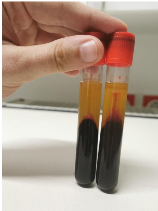
Slika 7. Usporedba sadržaja epruveta (lijevo 2500rpm, desno 1300rpm)