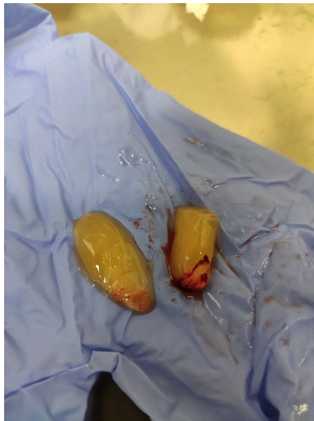
Slika 9. Usporedba veličine i konzistencije PRF ugruška (lijevo 2500rpm, desno 1300rpm)