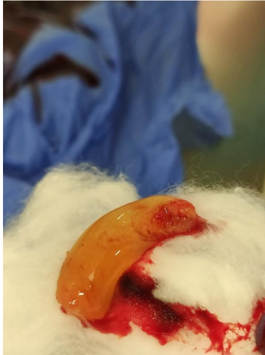
Slika 8. PRF ugrušak