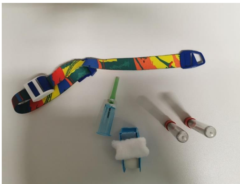
Slika 1. Instrumentarij za vađenje krvi

postavljanje u uređaj za centrifugiranje (slika 5). Za centrifugiranje se može koristiti bilo koji uređaj za centrifugiranje s pretprogramiranim postavkama ili s mogućnošću namještanja postavki. Na slici 5. je Centrifuge MPW-223e. Na slici 6. se поближе prikazuje PRF ugrušak dobiven centrifugiranjem na 2500rpm kroz 10minuta, a na slici 7. se uspoređuju dva protokola, lijeva epruveta je centrifugirana na 2500 rpm kroz 10 minuta, a desna na 1300 rpm kroz 8 minuta. U obje epruvete se nalazi površinski sloj PPP-a, zatim sloj PRF-a i na dnu sloj eritrocita. Slika 8. Prikazuje PRF ugrušak nakon procesa odvajanja od sloja PPP-a i sloja eritrocita sa sterilnim škaričama. Na slici 9. se uspoređuju veličina i konzistencija PRF ugrušaka dobivenih dvama različitim protokolima.