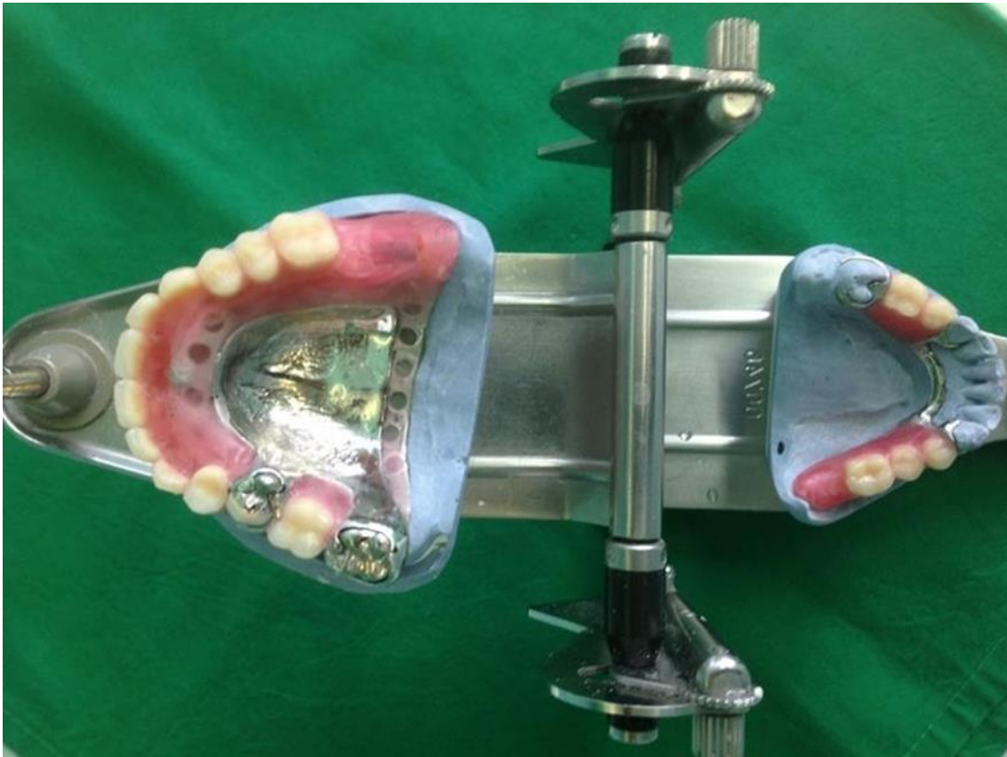
Slika 15. Probne baze s postavljenim zubima u artikulatoru.

Modeli gornje i donje čeljusti postavljeni su u artikulator. Potom su postavljeni umjetni zubi odgovarajuće boje, oblika i veličine. Umjetni zubi postavljeni su prema pravilima za postavljanje zubi uz određene (minimalne) modifikacije – usklađuje ih se i prema postojećim zubima agonistima i antagonistima u ustima (Slika 15.).