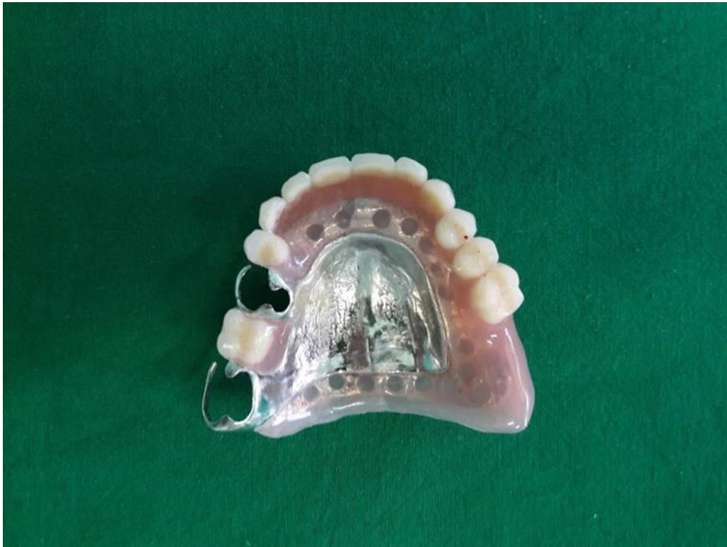
Slika 16. Gotova djelomična proteza za gornju čeljust.

Poslije postave zuba slijedi proba u ustima. Ukoliko je postava zubi odgovarajuća i nisu potrebni ispravci, slijedi laboratorijsko završavanje djelomičnih proteza - ulaganje u kivetu i polimerizacija. Nakon završene polimerizacije, površina proteze završno se obrađuje frezama i polira do visokog sjaja (Slika 16. i 17.).