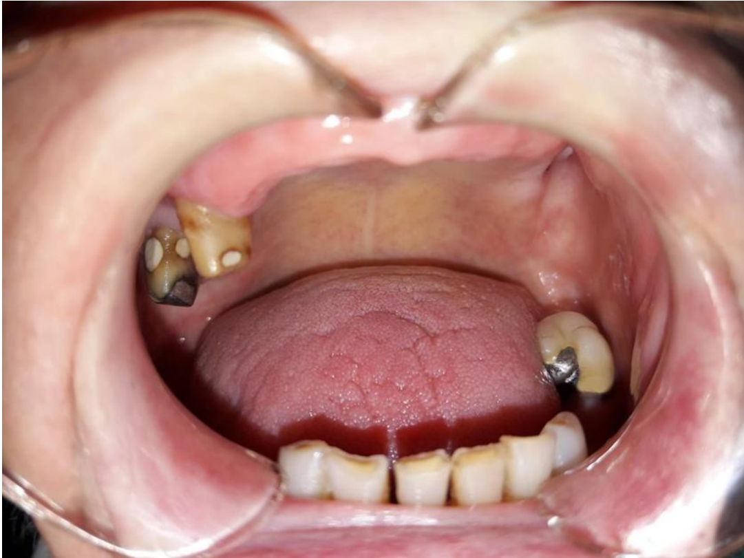
Slika 2. Intraoralni status.

Nakon detaljnog ekstaoralnog i intraoralnog pregleda, napravljen je plan za protetsku terapiju. Odlučeno je izraditi kombinirani fiksno-mobilni protetski rad: u gornjoj čeljusti modificirana fasetirana krunica na premolaru i modificirana potpuno kovinska krunica na molaru te djelomična proteza s metalnom bazom koja će se retinirati obuhvatnim kvačicama na preostalom premolaru i molaru. U donjoj čeljusti planira se izrada djelomične proteze s podjezičnim lukom retinirana obuhvatnom kvačicom na drugom lijevom molaru i razdvojenim T-kvačicama na donjim kaninima lijeve i desne strane.