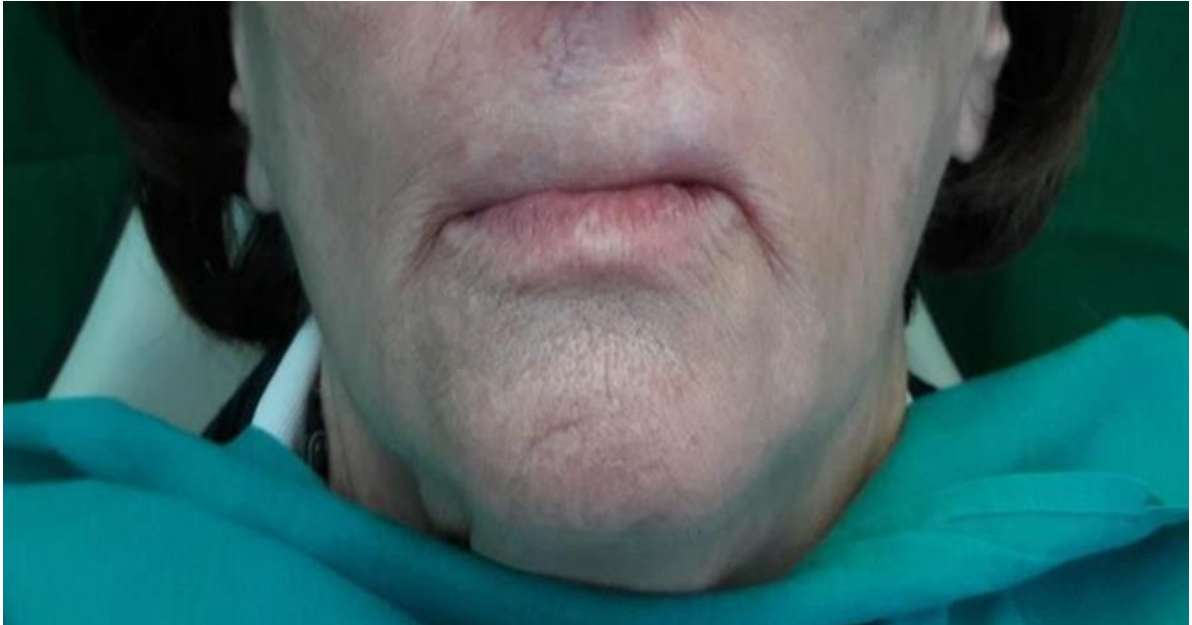
Slika 20. Izgled donje trećine lica s protezama.

Pacijentica je upućena u način stavljanja proteza u usta i njihovo vađenje. Date su joj upute o održavanju oralne higijene. Preporučeni su redoviti kontrolni pregledi svakih 6 mjeseci.