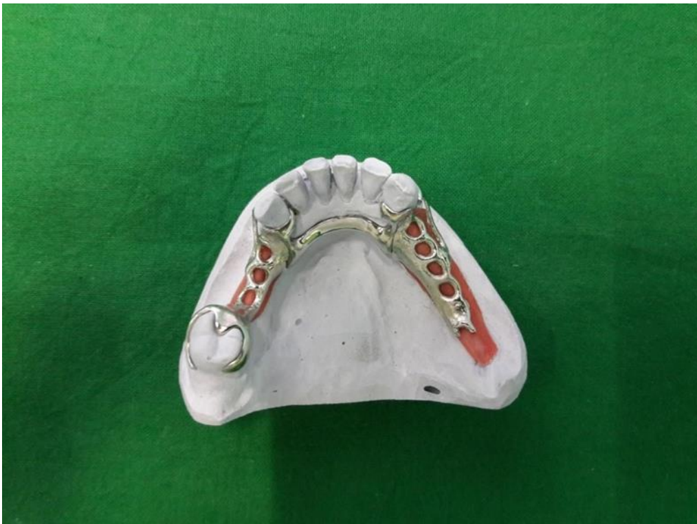
Slika 11. Radni model s metalnom bazom i retencijskim elementima za donju djelomičnu protezu.