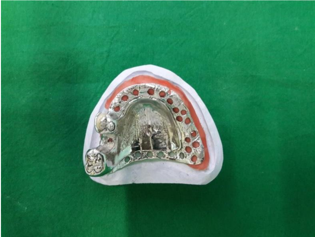
Slika 10. Radni model s metalnom bazom i retencijskim elementima za gornju djelomičnu protezu.