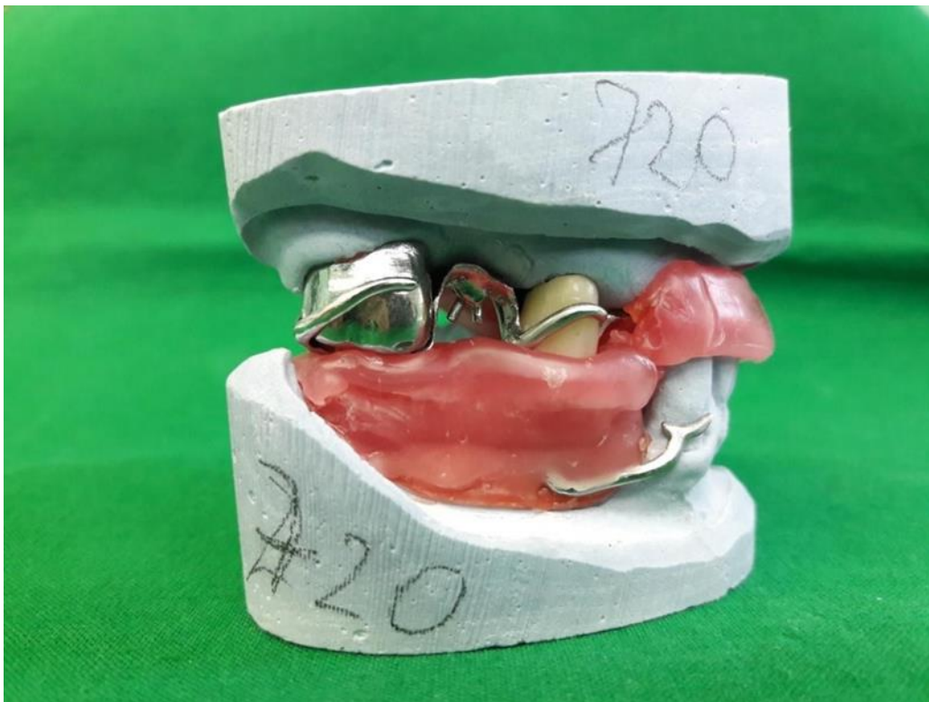
Slika 14. Metalne baze proteze s nagriznim bedemima iz voska spojene u centričnoj relaciji (lateralni prikaz).