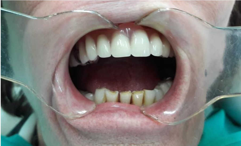
Slika 18. Predaja djelomičnih proteza.