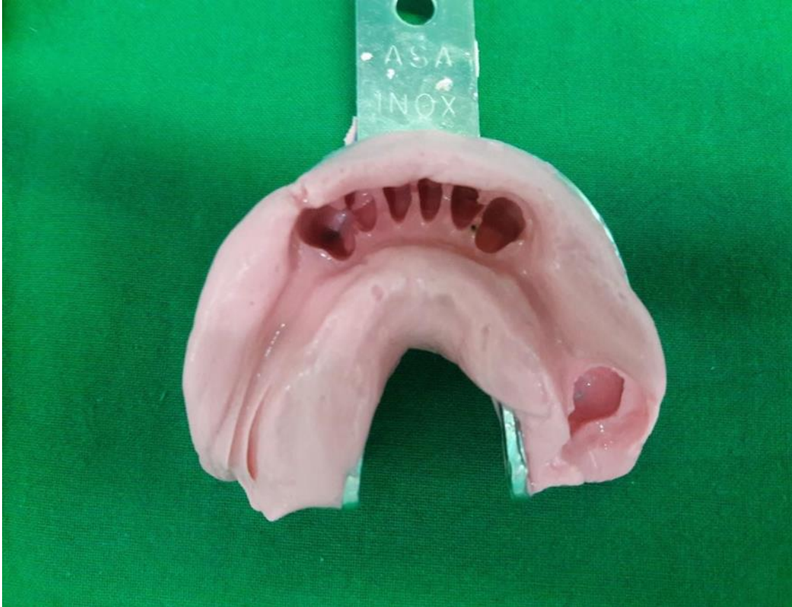
Slika 7. Otisak donje čeljusti s ireverzibilnim materijalom – alginat.

Anatomski otisak donje čeljusti uzet je uobičajeno konfekcijskom žlicom i ireverzibilnim hidrokolidom – alginatom ( Aroma Fine III, GC Corp, Tokio, Japan) (slika 7.).