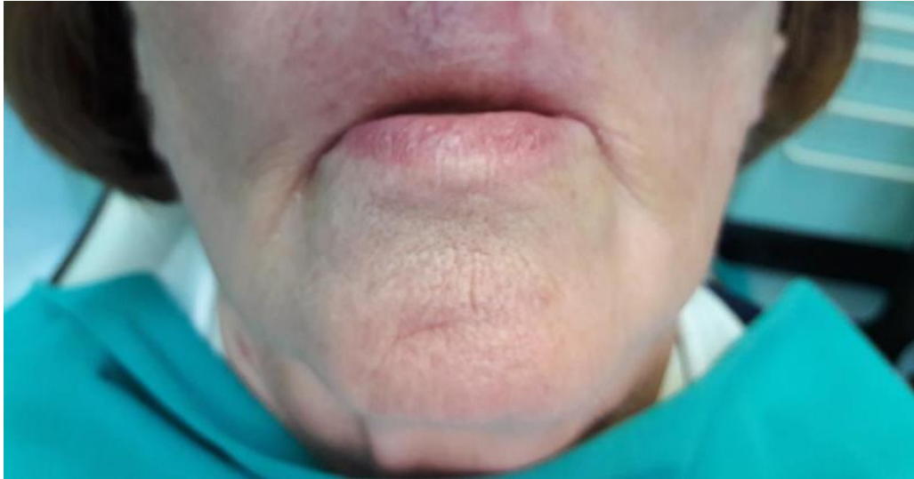
Slika 1. Donja trećina lica pacijentice s mikrostomijom.

Pacijentica u dobi od 60 godina dolazi na Zavod za fiksnu protetiku Stomatološkog fakulteta Sveučilišta u Zagrebu zbog potrebite protetske rehabilitacije. Etički odbor Stomatološkog fakulteta Sveučilišta u Zagrebu dao je suglasnost za izradu ovog rada. Ekstraoralnim pregledom vidljiva je mikrostomija (Slika 1.) nastala kao posljedica kirurškog liječenja i radioterapije neoplazme vestibuluma usne šupljine i gornje usne.