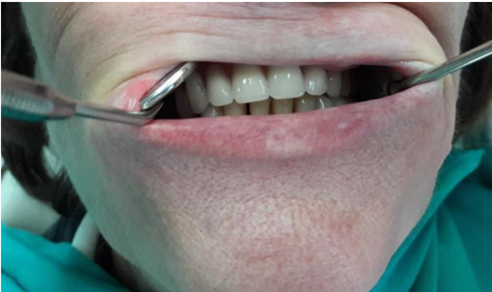
Slika 19. Gotove proteze u zagrizu.