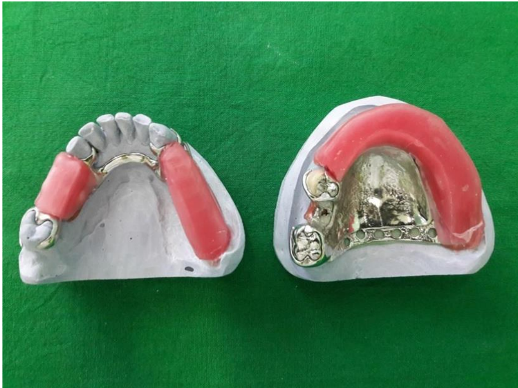
Slika 12. Probne baze s nagriznim bedemima iz tvrdog voska.

Slijedi proba metalnih baza za gornju i donju djelomičnu protezu u ustima pacijentice. Provjerena je točnost dosjeda metalnih baza gornje i donje proteze spram preostalih zubi i fiksno protetskih radova te prema bezubom alveolarnom grebenu. Potom su napravljene voštani zagrizni bedemi (Slika 12.) kako bi se u istom posjetu mogli registrirati i međučeljusni odnosi.