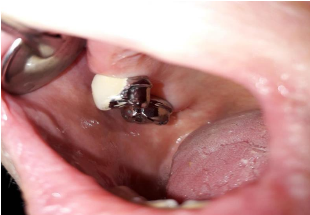
Slika 5. Proba gotove modificirane fasetirane i modificirane potpuno kovinske krunice u ustima pacijenta.