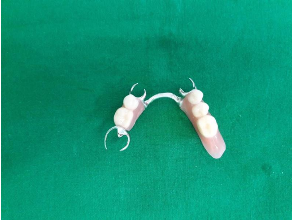
Slika 17. Gotova djelomična proteza za donju čeljust.

Prilikom predaje provjerava se dosjed proteze, okluzijski kontakti u centričnoj relaciji, fizionomija donje trećine lica i aktiviraju se kvačice (Slika 18., 19. i 20.).