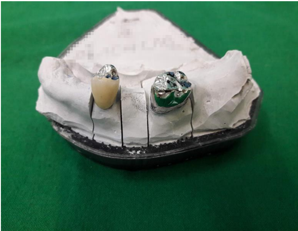
Slika 4. Radni model s odvojivim bataljcima i gotovim krunicama.

Gotove krunice (Slika 4.) isprobavaju se u ustima pacijentice (Slika 5.).