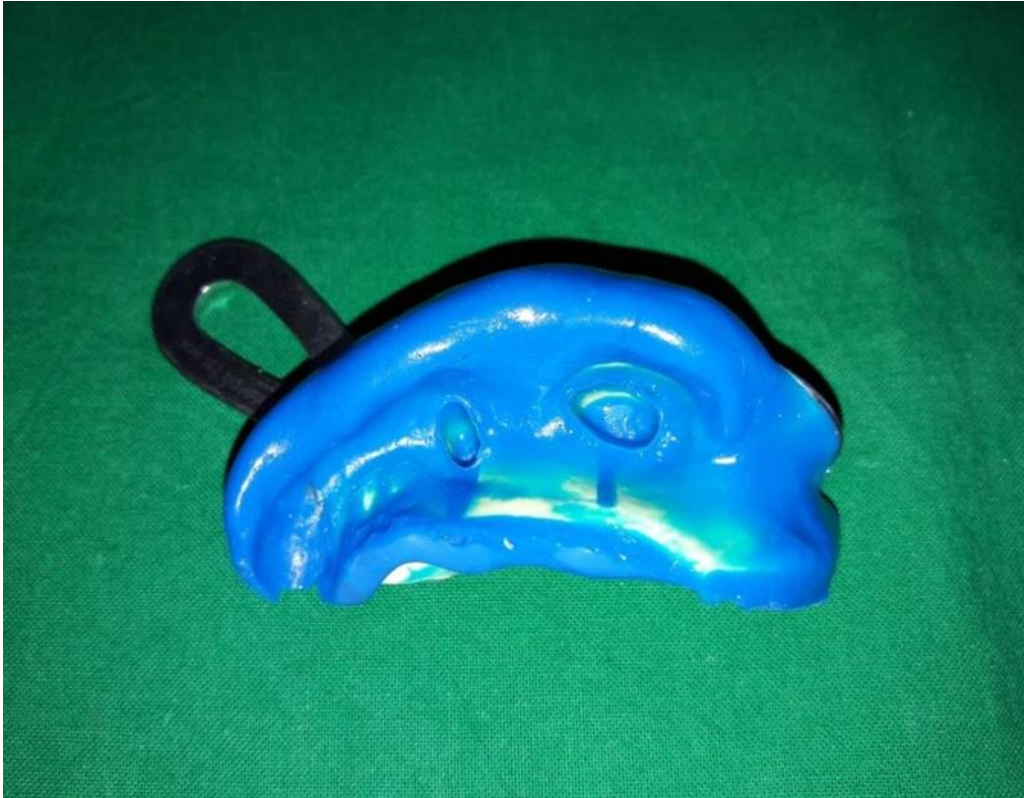
Slika 3. Korekturni otisak s otisnim materijalom i impresijom brušenih zuba u gornjoj čeljusti.

Zatim je u dentalnom laboratoriju izrađen radni model od tvrde sadre (Fujirock EP, GC Europe, Leuven, Belgija) s odvojivim radnim bataljcima te je uslijedio postupak navoštavanja i modeliranja modificiranih krunica u vosku, postupak ulaganja voštanih objekata u kivetu, predgrijavanje i žarenje kivete i konačno postupak lijevanja. Nakon lijevanja, metalni objekti obrađeni su te polirani do visokog sjaja.