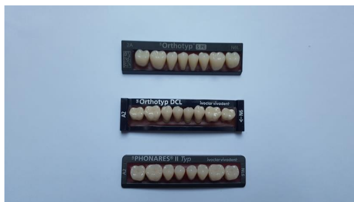
Slika 11. Prefabricirani zubi

Umjetni zubi svojim oblikom i bojom moraju odgovarati preostalim zubima u cilju postizanja funkcijske i estetske harmonije (Slika 11.). Oblik i veličina zuba moraju biti u skladu s oblikom lica i konstitucijom pacijenta. S obzirom na oblik razlikuju se četvrtasti, trokutasti i ovalni zubi, što se prvenstveno reflektira na odabiru prednjih zuba (41). Munsell analizira boju na temelju triju različitih dimenzija: nijanse, svjetline i kromatografske vrijednosti (42).