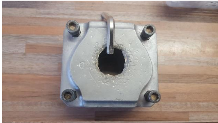
Slika 6. Kiveta za injekcijsku polimerizaciju

Kiveta se zatvori i do kraja ispuni sadrom. Nakon stvrdnjavanja se stavlja u vodu na 70 °C tijekom 7 minuta. Modelacijski vosak je tada dovoljno plastičan i kivete se mogu otvoriti, te se vosak ukloni.