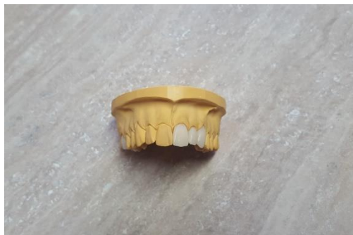
Slika 2. Privremene poliamidne krunice