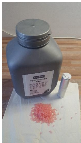
Slika 7. Poliamidni materijal i kartuša

U isto vrijeme se zagrijavaju i kivete tijekom 15 minuta u vodi na temperaturi od 90 °C, iz koje se vade 2 minute prije injekcije. Potrebno ih je osušiti i sadru premazati izolacijskim sredstvom prikladnim za injekcijsku tehniku. Ne smije se koristiti lak na bazi alginata jer on tijekom injekcijskog procesa sagorijeva, što ima negativni učinak na krajnji rezultat.