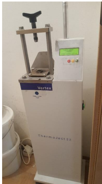
Slika 8. Uređaj za injekcijsku polimerizaciju

Hlađenje materijala se odvija u kivetama, postepeno. Tijekom 30 minuta se hlade na zraku, da bi se zatim hladile 20 minuta pod vodom. Proces se ne smije požurivati da se ne potkradu greške. Skelet proteze se odvaja od sadre i obrađuje (Slika 9).