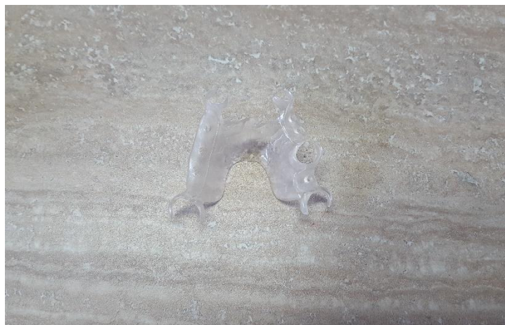
Slika 9. Skelet proteze (poliamid)

Hlađenje materijala se odvija u kivetama, postepeno. Tijekom 30 minuta se hlade na zraku, da bi se zatim hladile 20 minuta pod vodom. Proces se ne smije požurivati da se ne potkradu greške. Skelet proteze se odvaja od sadre i obrađuje (Slika 9).