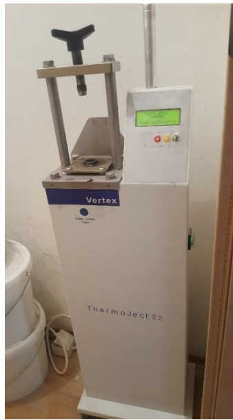
Slika 8. Uređaj za injekcijsku polimerizaciju

Hlađenje materijala se odvija u kivetama, postepeno. Tijekom 30 minuta se hlade na zraku, da bi se zatim hladile 20 minuta pod vodom. Proces se ne smije požurivati da se ne potkradu greške. Skelet proteze se odvaja od sadre i obrađuje (Slika 9).