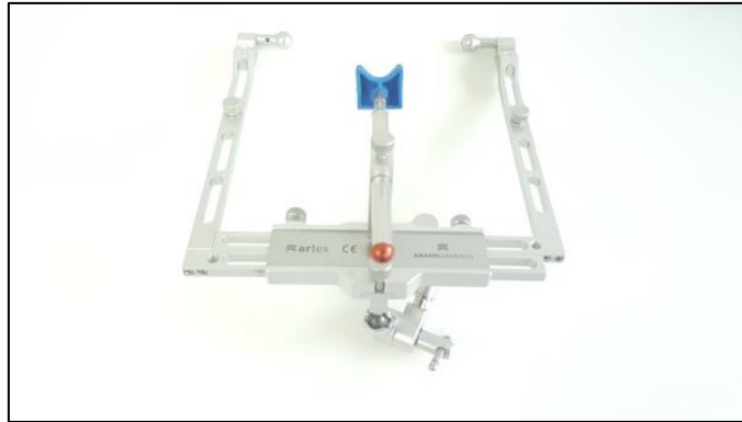
Slika 10. Obrazni luk