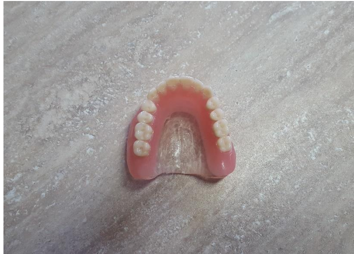
Slika 14. Ispolirana gornja potpuna poliamidna proteza s prozirnim nepčanim baznim dijelom

postojanija veza s umjetnim zubima. S druge strane, s obzirom na kombinaciju elastičnog (poliamid) i rigidnog (akrilat) materijala mogući su lomovi akrilatnih dijelova.