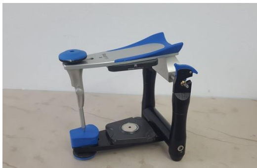
Slika 4. Artikulator