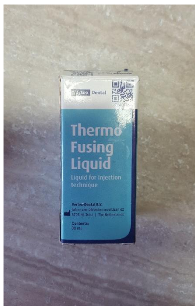
Slika 16. Termofuzijska tekućina

S obzirom na privremeni karakter protetskog rada tijekom perioda cijeljenja tvrdih i mekih tkiva, podlaganje privremene poliamidne proteze nije uobičajeno. Ipak, ukoliko se ukaže potreba za podlaganjem, protezu je moguće podložiti poliamidnim materijalom (indirektno) ili silikonom (direktno i indirektno) (51). Termofuzijska tekućina otapa gornji sloj poliamidnog materijala i omogućuje vezanje za druge materijale (Slika 16.).