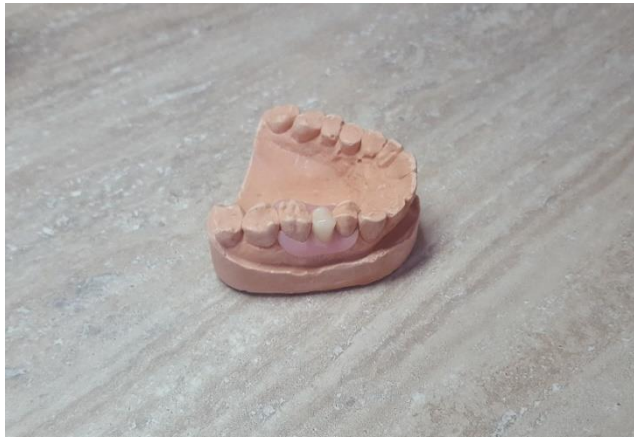
Slika 5. Privremena poliamidna proteza za jedan zub („žabica“)

Oblikovanje proteze ovisi o poziciji i veličini sedla. Kod manjih umetnutih sedala se radi privremena proteza bez velike spojke („žabica“) (Slika 5.), dok se kod većih umetnutih i produženih sedala radi privremena proteza s velikom spojkom s lingvalne strane donjih zubi ili preko nepca kod gornjih zubi.