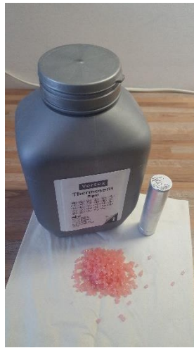
Slika 7. Poliamidni materijal i kartuša

U isto vrijeme se zagrijavaju i kivete tijekom 15 minuta u vodi na temperaturi od 90 °C, iz koje se vade 2 minute prije injekcije. Potrebno ih je osušiti i sadru premazati izolacijskim sredstvom prikladnim za injekcijsku tehniku. Ne smije se koristiti lak na bazi alginata jer on tijekom injekcijskog procesa sagorijeva, što ima negativni učinak na krajnji rezultat.