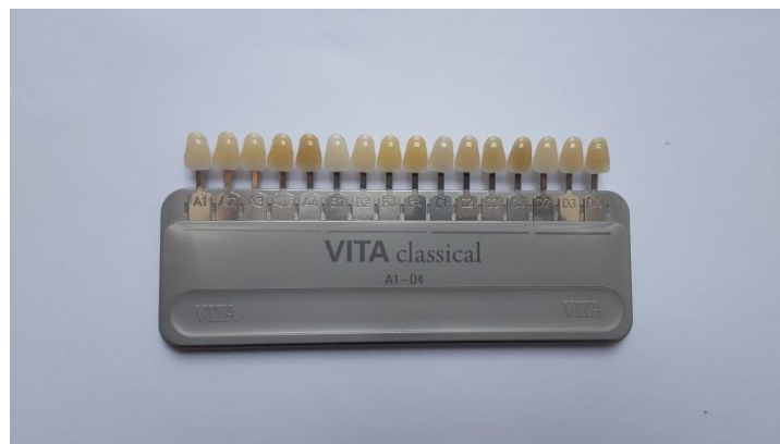
Slika 12. Ključ boja

U odabiru boje zuba veliku ulogu imaju boja kože, prirodne kose, boja očiju i dob pacijenta (43, 44). Boja se može odrediti vizualno i instrumentalno. U praksi se najčešće koristi vizualna metoda određivanja boje temeljena na ključevima boja. Ova metoda je subjektivna i ovisna o ograničenjima samog ključa boja (45). Pod utjecajem je čimbenika kao što su dob i spol pacijenta, iskustvo kliničara u sposobnosti razlikovanja boja (46), površinska struktura zuba i osvjetljenje (47). Najčešće korišteni ključ boja je Vita Classical (Vita Zahfabrik, Bad Sackingen, Njemačka), koji razvrstava 16 boja prema nijansi, svjetlini i zasićenosti (Slika 12.).