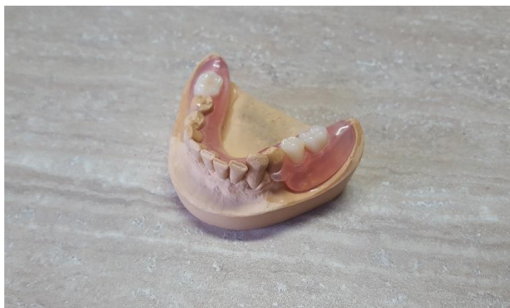
Slika 15. Završena donja djelomična poliamidna proteza