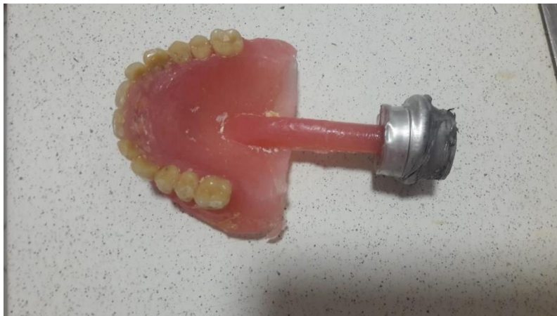
Slika 13. Neobrađena gornja potpuna poliamidna proteza

Nakon što se u vosku izmodelira gingiva ponavlja se postupak ulaganja modela u kivetu. Na opisani način se izradi imitacija gingive od poliamida s pripadajućim (prefabriciranim) zubima (Slika 13.).