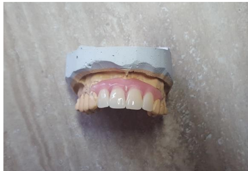
Slika 1. Poliamidna privremena proteza

Najlon je razvio Wallace Carothers zajedno sa suradnicima iz Du Pont Chemical Co, tridesetih godina 20. stoljeća. Kao materijal koji se koristi u stomatološkoj protetici spominje se 50-ih godina prošlog stoljeća, kada su napravljene prve protezne baze iz najlona. Zbog brojnih nedostataka nije naišao na široku primjenu sve do 1970-ih godina (5,6). Danas je primjena poliamida u stomatologiji učestala (Slika 1. i 2.). Oni koji se koriste u stomatološkoj protetici moraju imati vrlo specifične mehaničke karakteristike (4).