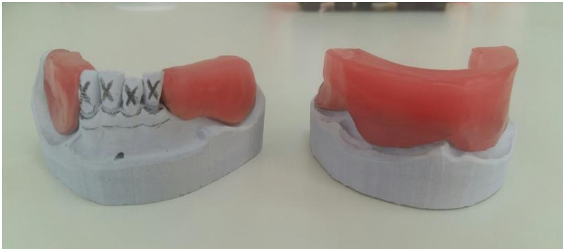
Slika 7. Gornja i donja probna baza

Međučeljusni odnosi određuju se pomoću probnih baza koje se izrađuju na radnom modelu. Probne baze ne smiju se pomaknuti za vrijeme određivanja međučeljusnih odnosa, moraju prekriti ležište i naslanjati se na preostale zube (Slika 7.). Da bi se postigla bolja retencija, moguće je postaviti i kvačice (2). Određivanje međučeljusnih odnosa jednostavnije je ako u objema čeljustima postoje zubi koji osiguravaju taj odnos, prije svega to se odnosi na sačuvane prve premolare. Tamo gdje su očuvani samo prednji zubi, visina okluzije ne postoji, stoga ju je potrebno odrediti kao kod potpune bezubosti (1).