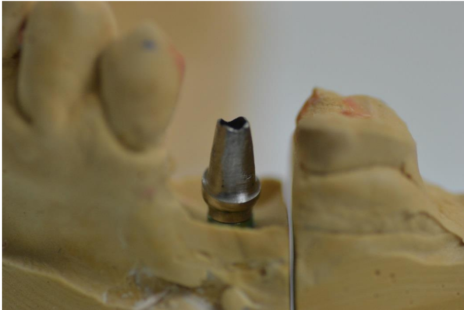
Slika 1. Nadogradnja na implantatu na koju se kruna cementira.

veze (Monobond Plus), Multilink Implant ostvaruje optimalnu vezu i s plemenitim i neplemenitim legurama i sa svim keramikama (15).