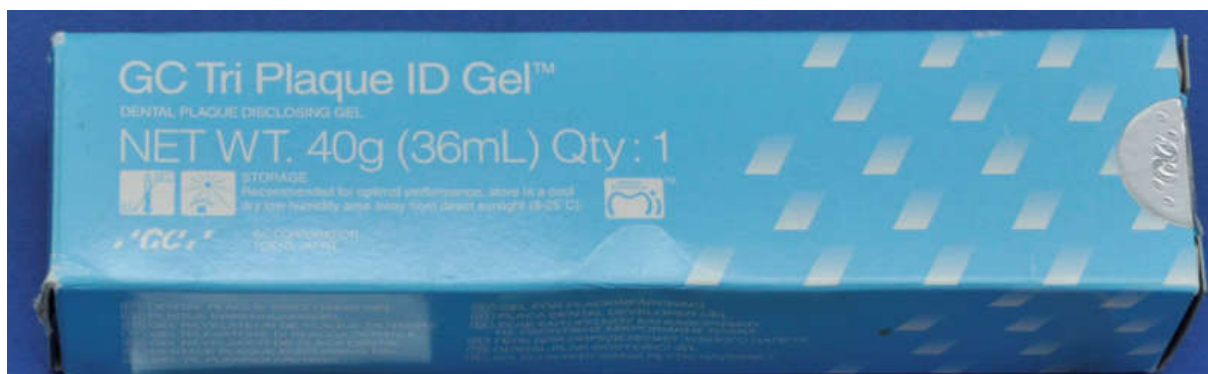
Slika 1. Primjer plak revelatora.

nastanak karijesa povećan (35). Testovi za određivanje pH vrijednosti sline i puferskih kapaciteta prikazani su na slici 4.