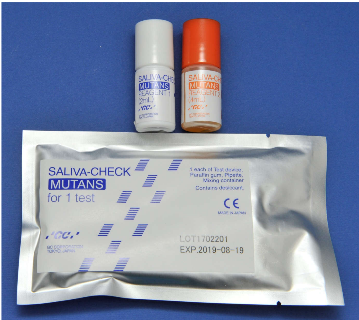
Slika 2. Primjer testa za određivanje količine S. mutansa u slini.