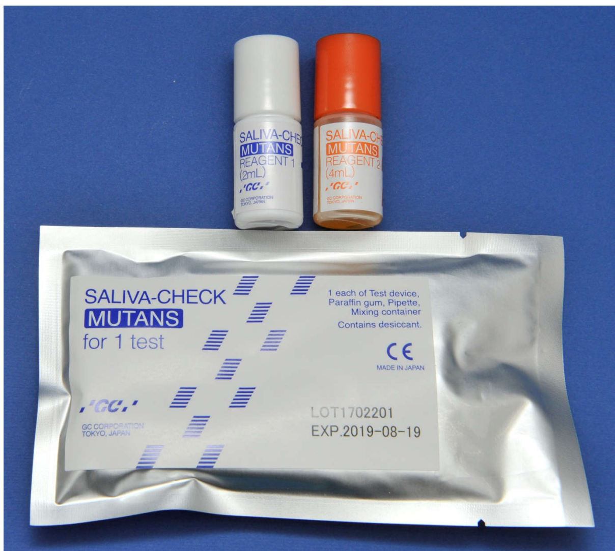
Slika 2. Primjer testa za određivanje količine S. mutansa u slini.