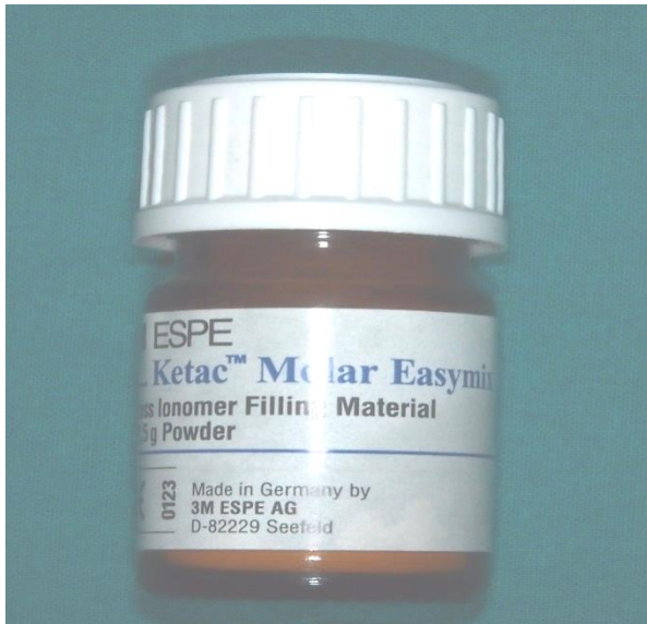
Slika 6. Predstavnik konvencionalnih stakleno-ionomernih cemenata Ketac Molar.