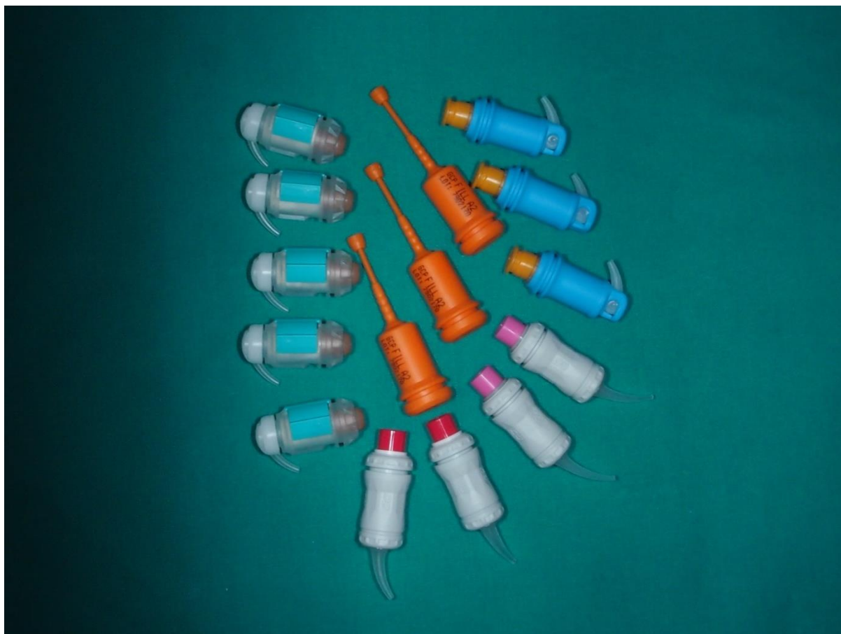
Slika 5. Stakleno ionomerni cementi u kapsuliranom obliku.

Prednost kapsuliranog SIC-a je smanjena mogućnost pogreške koja može nastati prilikom ručnog miješanja (11).