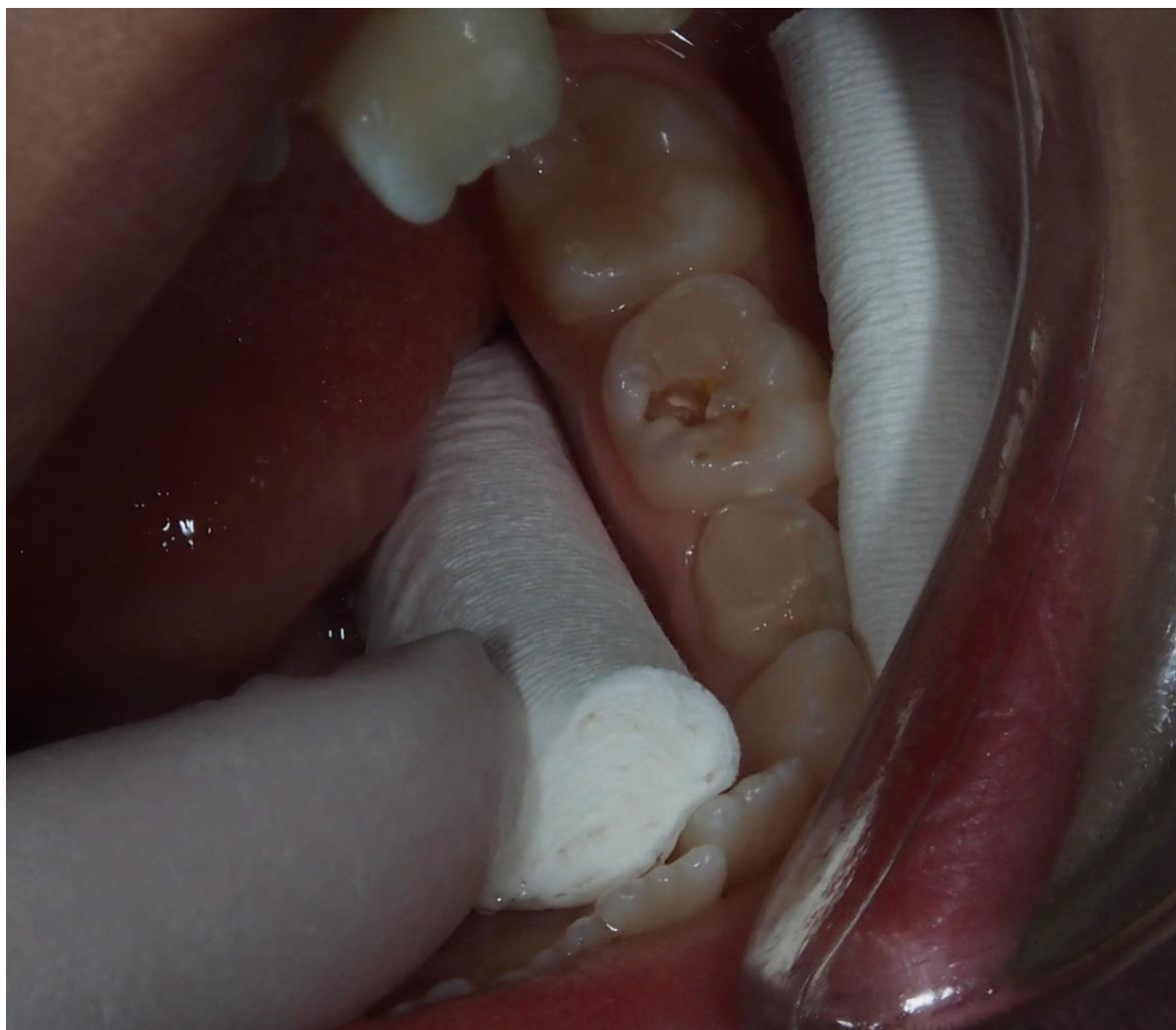
Slika 3. Kavitet mliječnog zuba nakon uklanjanja inficiranog dentina.