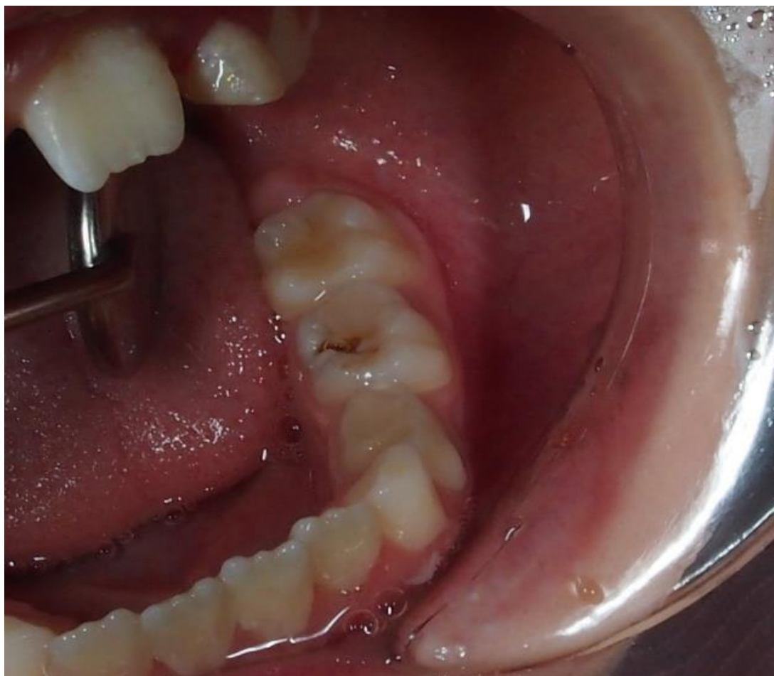
Slika 2. Kavitet zuba prije ART restauracije.