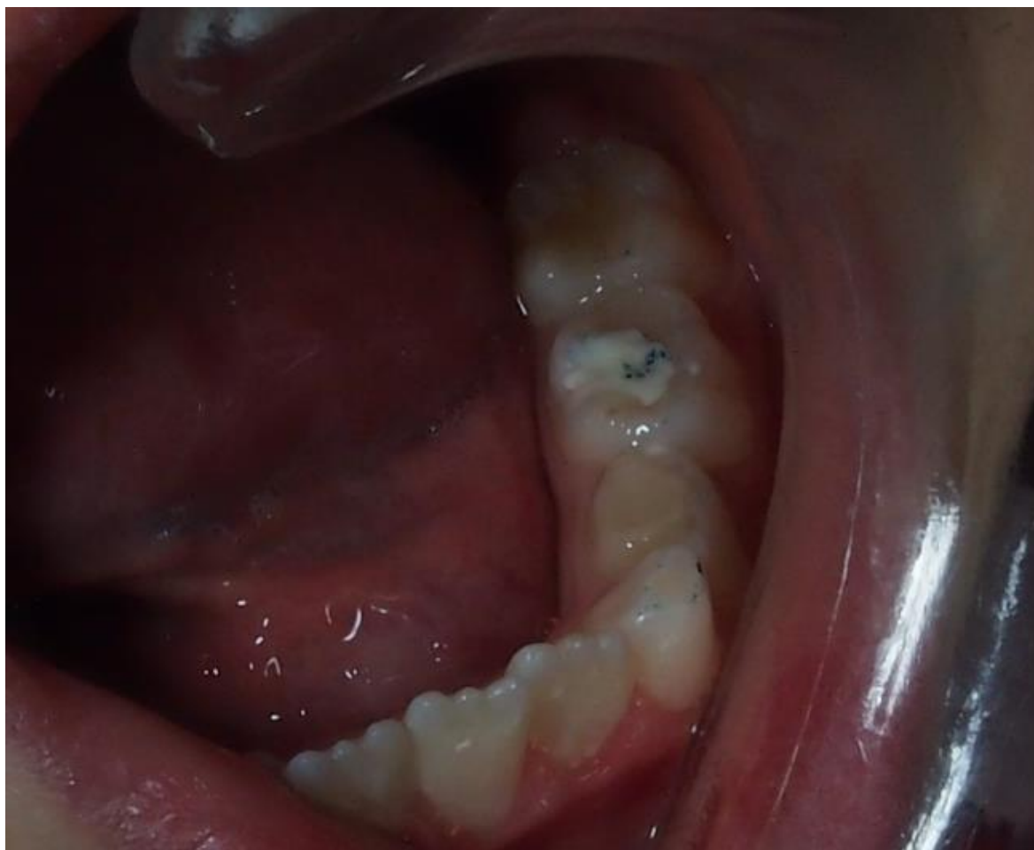
Slika 4. Kavitet mliječnog zuba nakon izrade ART ispuna.