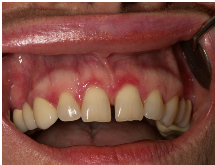
Slika 7. Eritematozna marginalna gingiva u prednjem dijelu gornje čeljusti.

Slučaj 1. Pacijentica se javlja na Zavod za oralnu medicinu Stomatološkog fakulteta u Zagrebu zbog bolova gingive u gornjem vestibulumu premolarno lijevo. Pomnim kliničkim oralnim pregledom nalazi se upala s diskretnom lihenoidnom promjenom. Lihenoidne, ali ponešto atipične promjene nalaze se na vestibularnim interdentalnim papilama, ali ne na svima. Na bukalnoj sluznici lijevo nalazi se jedna promjena nalik atrofiji, uz koju je diskretan pojas zrakaste hiperkeratoze. Desna bukalna sluznica je uredna.