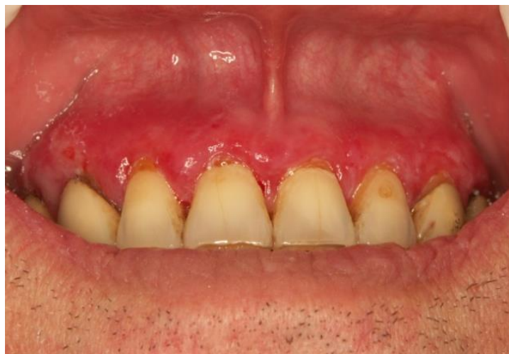
Slika 10a. Stanje na gingivi gornje čeljusti.