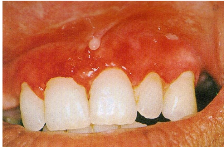
Slika 2. Deskvamativni gingivitis kao očitovanje pemfigusa vulgarisa.

Lezije na gingivi, zajedno s drugim oralnim lezijama mogu biti prvi znak bolesti i tada se to stanje naziva deskvamativni gingivitis. Manja povreda oralne sluznice može rezultirati deskvamacijom (Nikolskyjev znak) (6).