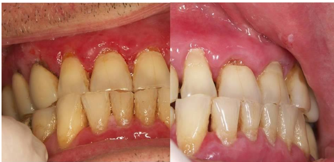
Slika 9a. Stanje na gingivi prije terapije.

U terapiji se lokalno koristi Beloderm u orabazi te se njime premazuju lezije 3x dnevno te Rojazol gel kroz 14 dana 4x dnevno pola mjerne žlice treba promućkati i progutati. Na daljnjoj kontroli u terapiju se uvodi Belosalic krema za premazivanje gingive 3x dnevno i Rojazol gel kao i do sada.