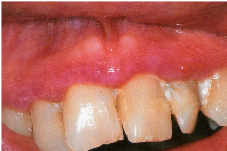
Slika 3. Deskvamativni gingivitis kao očitovanje buloznog pemfigoida. Preuzeto iz: Laskaris G. Atlas oralnih bolesti. Prvo hrvatsko izdanje. Jastrebarsko: Naklada Slap; 2005 (1).

Deskvamativni gingivitis se također može pojaviti u sklopu buloznog pemfigoida. Lezije na gingivi očituju se generaliziranim edemom, upalom i ljuštenjem sluznice s lokaliziranim područjima diskretnih vezikula. Lezije buloznog pemfigoida se klinički i histološki ne mogu razlikovati od lezija MMP-a iako je rana remisija češća u buloznom pemfigoidu (30).