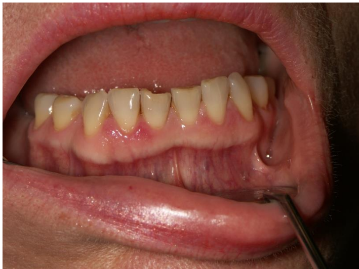
Slika 8. Nalaz u fronti donje čeljusti: blagi eritem

Na daljnjim kontrolama, nakon dva mjeseca, klinički je vidljiv izraženiji eritem na gingivi iznad gornje fronte te je u terapiji i dalje propisan lokalno Stomadheziv .