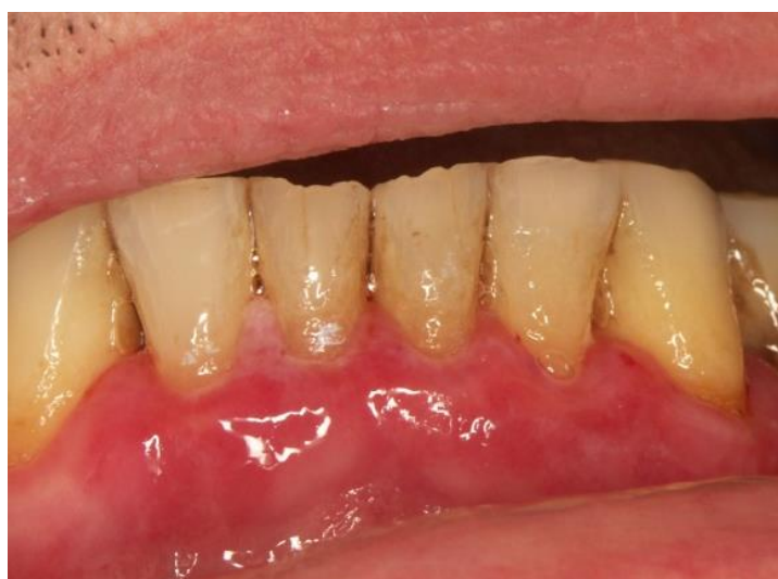
Slika 10b. Stanje na gingivi donje čeljusti.