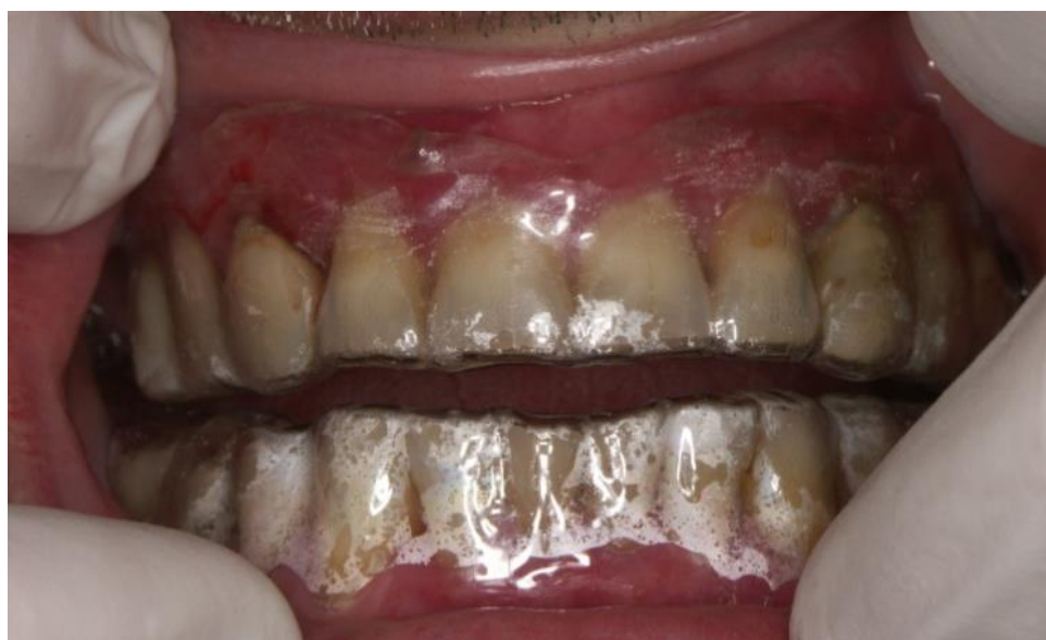
Slika 12. Mekane udlage za lokalnu primjenu lijeka.