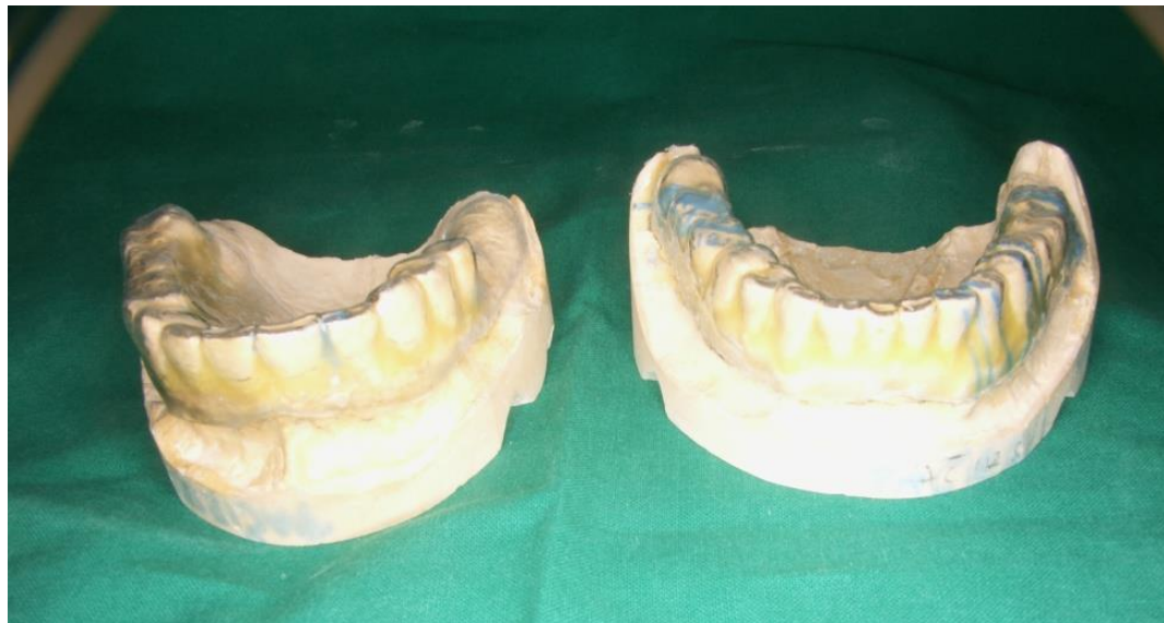
Slika 11. Mekane udlage na sadrenim modelima.