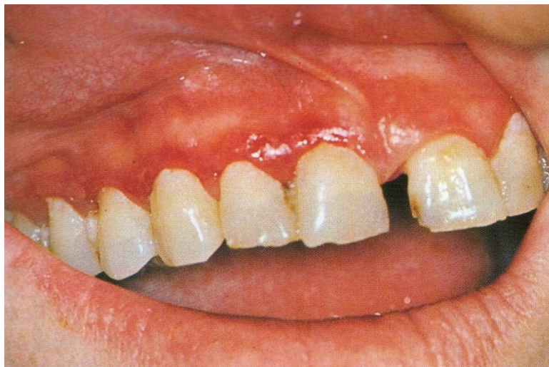
Slika 4. Deskvamativni gingivitis kao očitovanje ožiljkastog pemfigoida. Preuzeto iz: Laskaris G. Atlas oralnih bolesti. Prvo hrvatsko izdanje. Jastrebarsko: Naklada Slap; 2005 (1).

Prvi, a ujedno i najčešći, simptomi javljaju se na oralnoj sluznici u više od 90% bolesnika i to kao deskvamativni gingivitis, vezikulobulozne lezije i ulcercije. Periodi egzacerbacije i remisije se izmjenjuju iako neke lezije ostaju nepromijenjene godinama (60, 61).