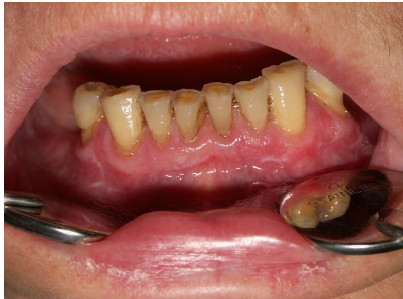
Slika 13. Gingivitis i Wickhamove strije vidljive na gingivi.

Slučaj 3. Pacijentica je upućena na Zavod za oralnu medicinu Stomatološkog fakulteta Sveučilišta u Zagrebu od svog dr. med. dent. zbog promjena na gingivi. Kliničkim pregledom nalazi se vidljiv deskvamativni gingivitis te Wickhamove strije na gingivi i bukalnoj sluznici. Postavljena je dijagnoza OLP – ruber.