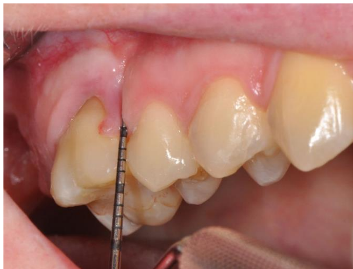
Slika 3: Gingivna invaginacija nastala nakon ekstrakcije zuba 16 i kasnim ortodontskim zatvaranjem prostora.

U mnogim se studijama vrijeme pokazalo kao jedan od glavnih rizičnih faktora za nastanak gingivne invaginacije (20). Ustanovljeno je da se najčešće javljaju u slučaju kasnijeg zatvaranja prostora, kada je već prošlo dosta vremena od ekstrakcije, zbog čega je izrazito važna dobra komunikacija među specijalistima. Terapija može biti različita, a najviše ovisi o obujmu zahvaćenosti gingive. Ukoliko invaginacija zahvaća samo meko tkivo, moguće je takav defekt tretirati skalpelom, elektrokauterom ili diodnim laserom za meka tkiva, čija je prednost minimalna postoperativna bol. Kako bi se prevenirala gingivna invaginacija, može se u postekstrakcijskom području provesti vođena koštana regeneracija (GBR), iako se još uvijek smatra najboljom prevencijom pravovremena aproksimacija zuba odmah nakon ekstrakcije zuba (1).