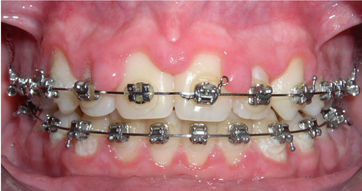
Slika 2: Gingivna hiperplazija uzrokovana neprimjerenom oralnom higijenom.

na hiperplastičnoj gingivi (19). Neki su autori povezali gingivnu hiperplaziju s alergijskom reakcijom na nikal koji se oslobađa kod primjene metalnih bravica. Takvu alergijsku reakciju karakterizira proliferacija keratinocita i povećana proliferacija epitelnih stanica, što često rezultira hiperplazijom gingive. Upravo je iz tih razloga važno u anamnestičkom upitniku kod svakog pacijenta saznati povijest alergija na metale kako bi se to moglo prevenirati (1).