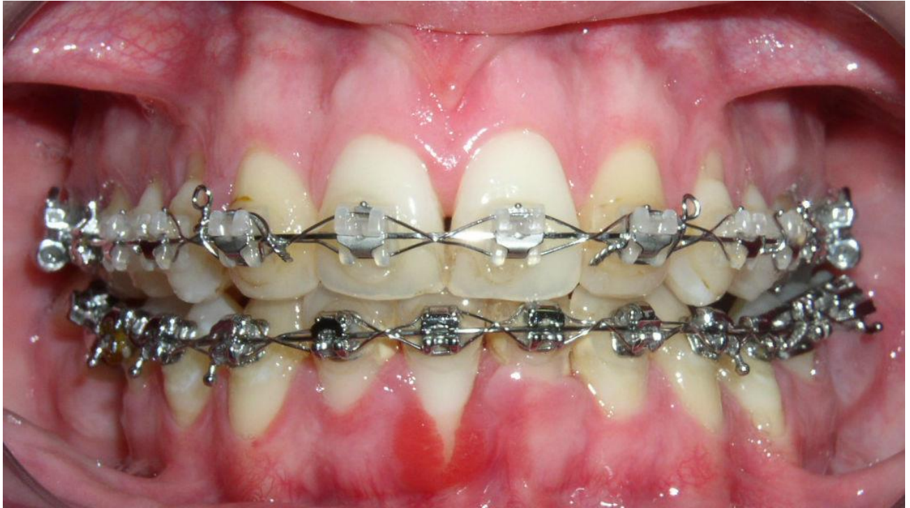
Slika 4: Gingivna recesija na zubu 41, nastala tijekom ortodontske terapije

Kako bi se dehiscijencije i posljedične recesije prevenirale i izbjegle, trebale bi se tijekom ortodontske terapije primjenjivati lagane, balansirane sile na grupu zubi, a ne na jedan zub pojedinačno. Kod primjene takvih sila često dolazi do kompenzacije na način, da lokalni periost prima podražaje od deformiranih medijatora i uzrokuje apoziciju kosti i zadebljanje na bukalnoj kortikalnoj ploči. To znači da tijekom labijalnog pomaka zubi, uz frontalnu resorpciju paradontnog zida alveolarne kortikalne ploče, kompenzacijski dolazi do apozije na bukalnoj kortikalnoj ploči (22), Slika 5.