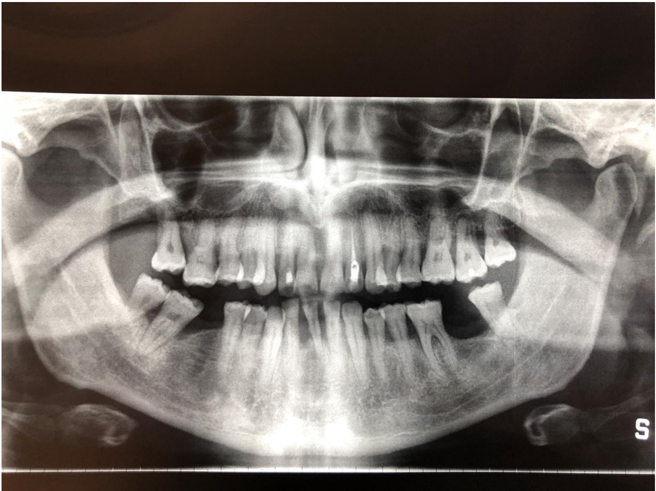
Slika 3 -ortopantomogramska snimka čeljusti i zubi pacijenta G.D. prije terapije laserom

(Pismena dozvola pacijenta da se snimka u radu prikaže