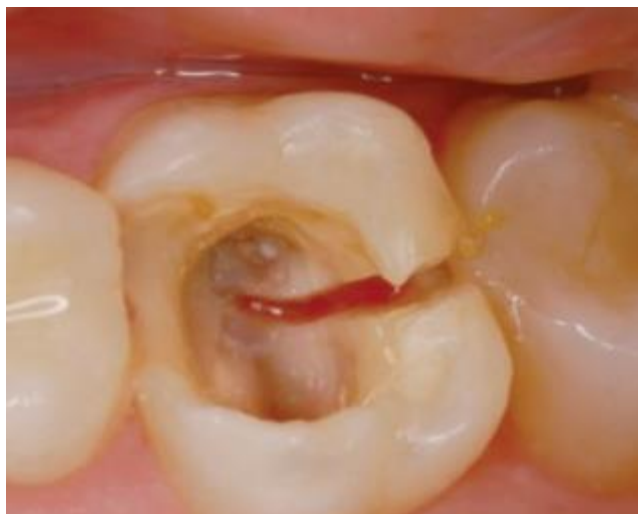
Slika 7. Vertikalna fraktura gornjeg prvog kutnjaka. Jedina terapija je vađenje zuba (preuzeto iz: 8, uz dopuštenje izdavača)