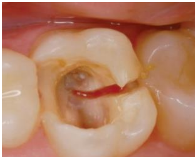
Slika 7. Vertikalna fraktura gornjeg prvog kutnjaka. Jedina terapija je vađenje zuba