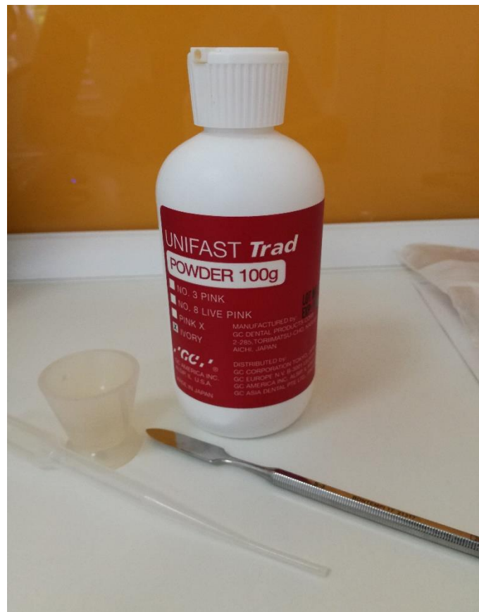
Slika 4. Unifast TRAD, GC Europe, MMA materijal za izradu privremenih nadomjestaka. Slika je izravni doprinos autora diplomskog rada.

bataljka prethodno navlaženoj monomerom (7). Dostupni su u više nijansi, a osim dobrog rubnog dosjeda postižu i visoku čvrstoću. Dobro se poliraju, no njihova je površina osjetljiva na abraziju te kao takva nije indicirana za dugotrajnu primjenu, kao ni kod pacijenata s parafunkcijama (7). Nedostatci uključuju značajan postotak volumetrijskog skupljanja, visoku temperaturu egzotermne reakcije polimerizacije (72 °C), toksičnost rezidualnog monomera na pulpno tkivo i gingivu te progresivan gubitak mehaničkih i estetskih svojstava proporcionalan dužini primjene. Zbog pulpotoksičnosti primjenu bi trebalo ograničiti na situacije kada pulpno zdravlje nije upitno i preparacija ne seže duboko u dentin. Ovi su materijali karakteristično jakog neugodnog mirisa koji pacijentima može smetati, a prijavljeni su i slučajevi tkivne reakcije na monomer (7). Slika 4. prikazuje jedan od metil-metakrilatnih materijala dostupnih na tržištu.