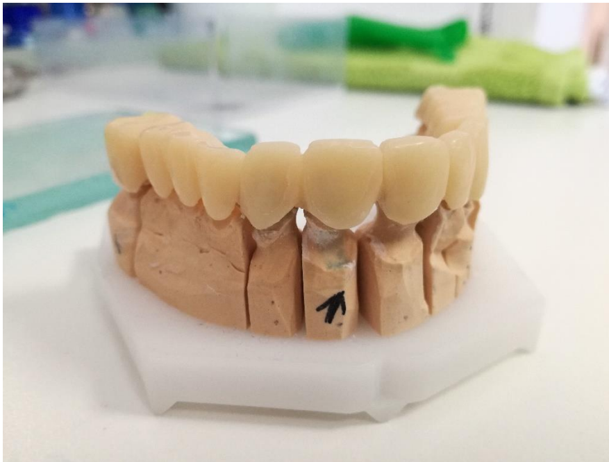
Slika 2. Nadomjestak napravljen metodom nadopunjavanja u otisku.