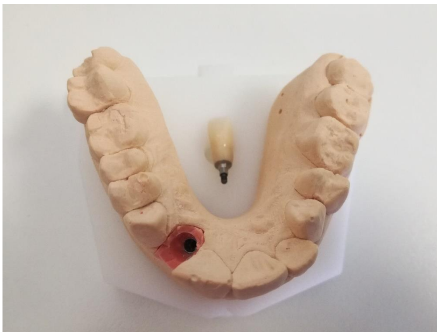
Slika 3. Privremena krunica na implantatu izrađena CAD/CAM tehnologijom. Slika je izravni doprinos autora diplomskog rada.