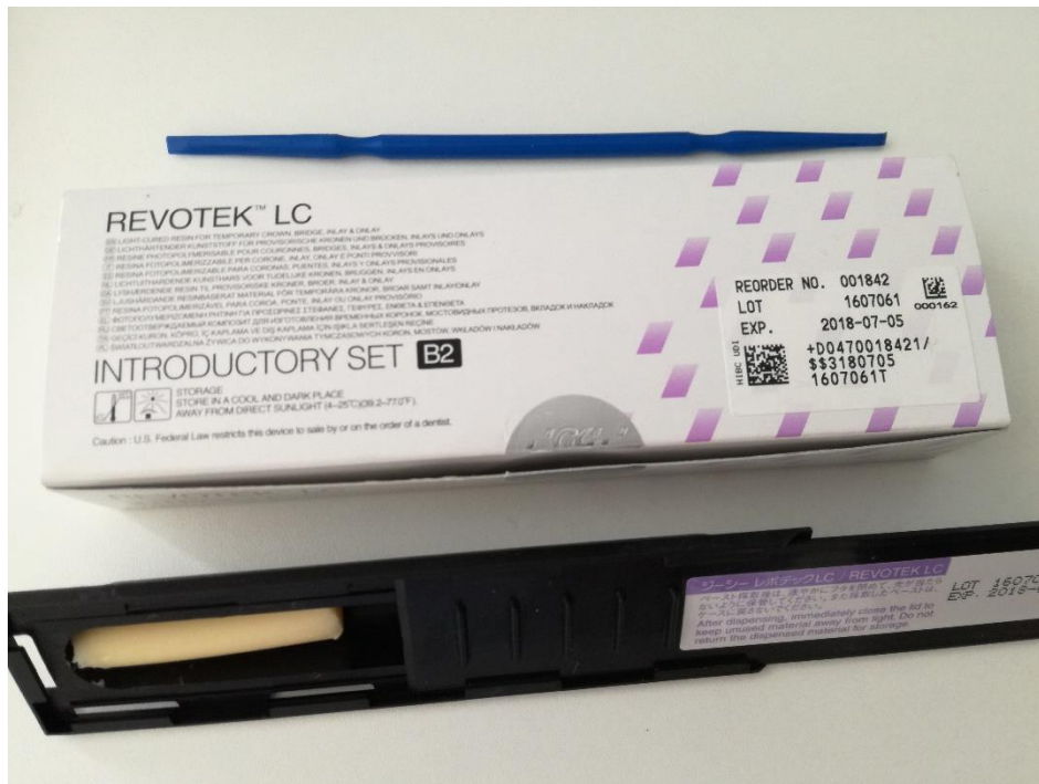
Slika 6. REVOTEK™ LC, GC America, UDMA svjetlosno polimerizirajući materijal za izradu privremenih nadomjestaka. Slika je izravni doprinos autora diplomskog rada.

Radica® (DENTSPLY Ceramco, York, PA) jest termoplastični materijal koji se koristi kod laboratorijske izrade nadomjestka predviđenog na duži period kao i imedijatno opterećenih proteza na implantatima (7). Materijal je čvrst, rezistentan na abraziju i dobro se polira. Dolazi u obliku seta šprica različitih caklinskih i dentinskih boja koje se griju u posebnom spemniku te nakon toga u slojevima unose u obrađeni otisak situacijskog modela ili wax-up a i oblikuju zagrijanim nastavkom za oblikovanje. Time se postiže vrlo zadovoljavajuća razina estetike. Otisak punjen materijalom vraća se na radni model te nakon postizanja sobne temperature od njega odvaja i svjetlosno polimerizira u pripadajućim jedinicama.