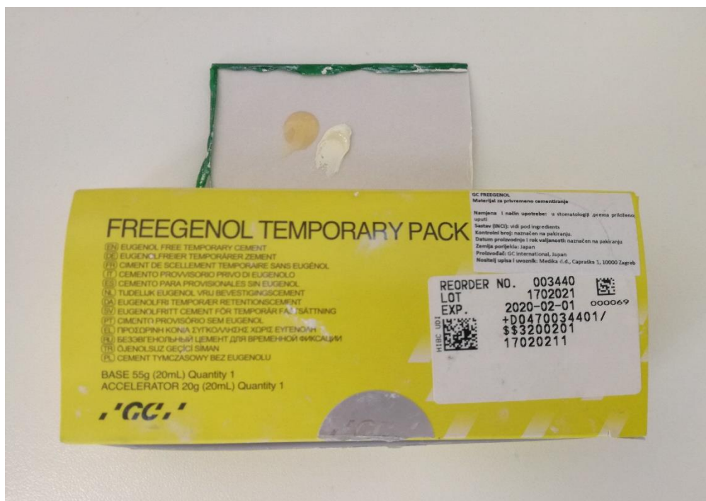
Slika 7. Eugenol – free privremeni cement za cementiranje privremenih radova. Slika je izravni doprinos autora diplomskog rada.