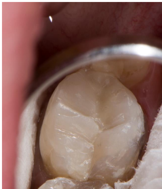
Slika 1. Kompozitni ispun