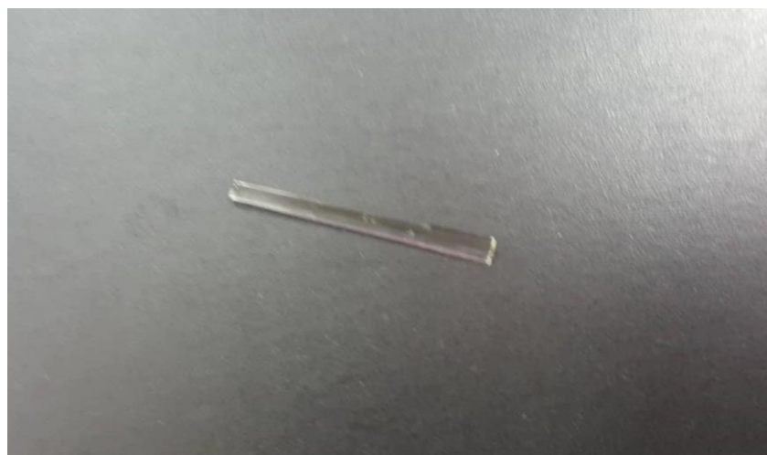
Slika 6. Individualni svjetlosno-polimerizirajući kolčić