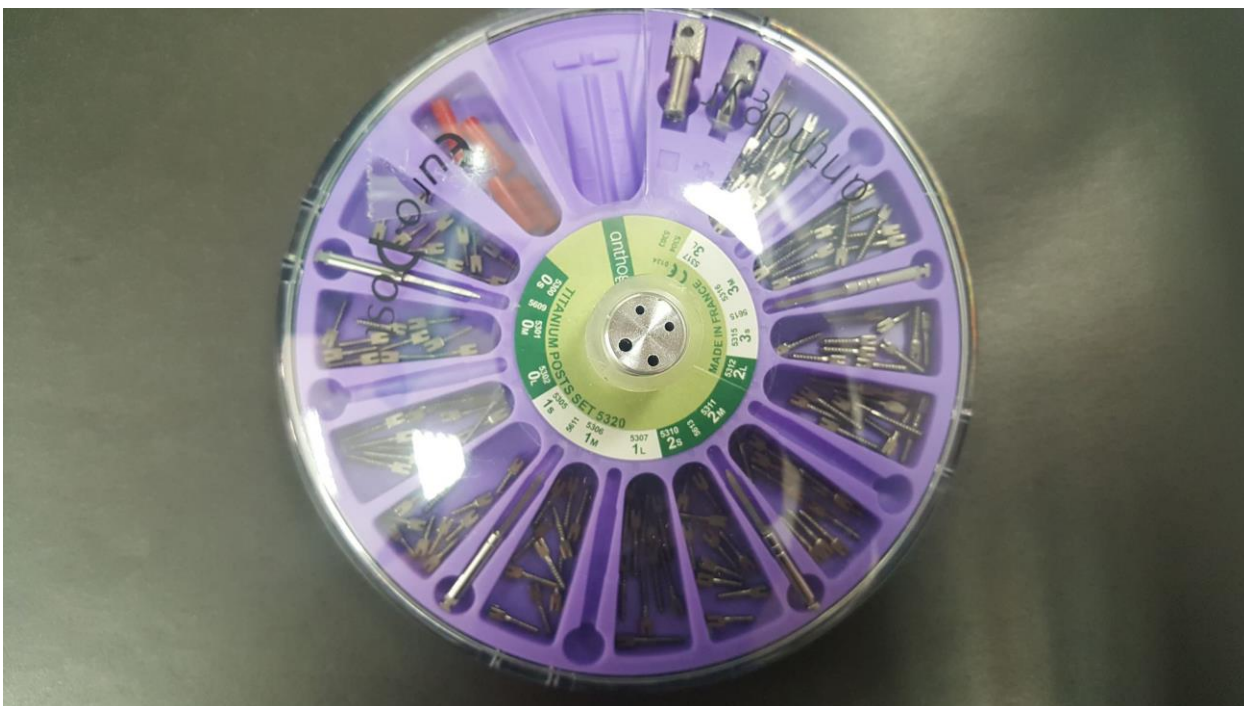
Slika 3. Konfekcijski intrakanalni kolčići