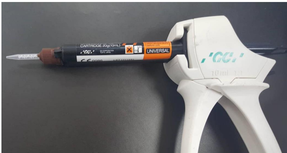
Slika 8. Adhezivni cement