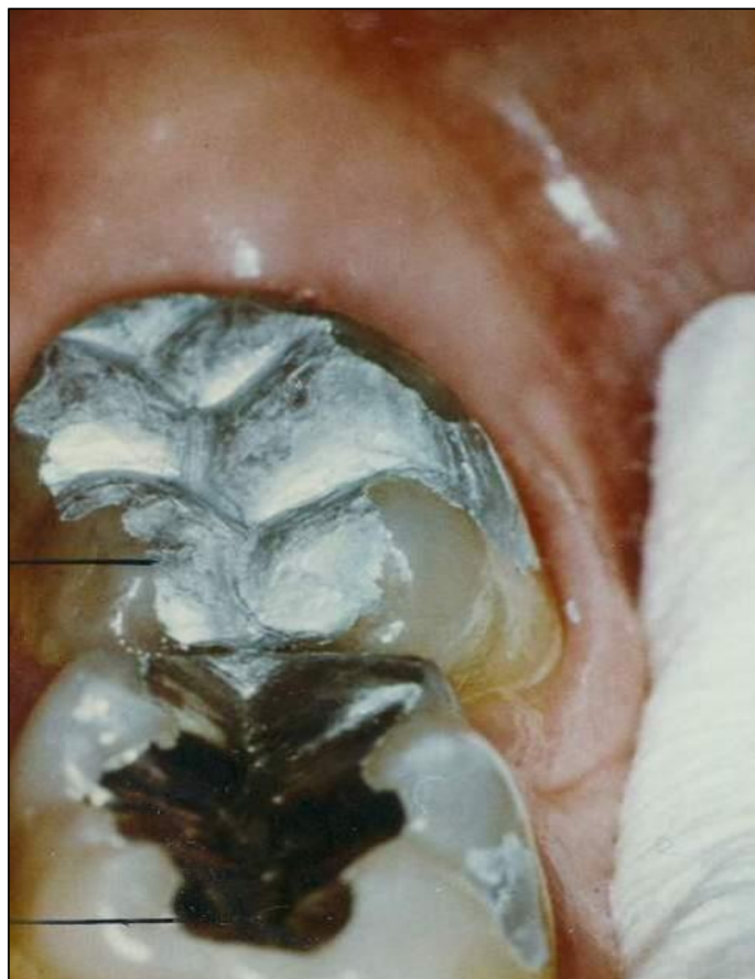
Slika 2. Amalgamski ispuni