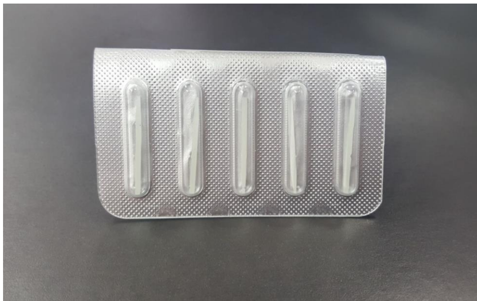
Slika 5. Bezmetalni kolčići ojačani vlaknima