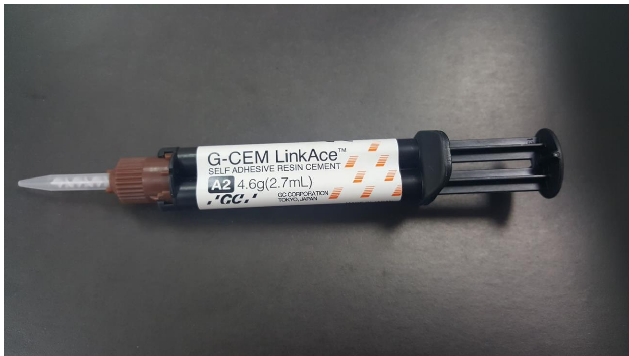
Slika 7. Adhezivni cement

Za razliku od neadhezivnih, adhezivni cementi ostvaruju kemijsku vezu s dentinom i većinom materijala za izradu kolčića i nadogradnji. (Slika 7. i Slika 8.) Povećavaju otpornost na frakturu jer dentin, cement i kolčić postaju cjelina. Koriste se zajedno s niskoviskoznim smolama (bond) koje pomažu u stvaranju kemijske veze, stvaranju hibridnog sloja i smanjenju rubnog propuštanja. Neki otpuštaju fluor i djeluju antikarijesogeno.