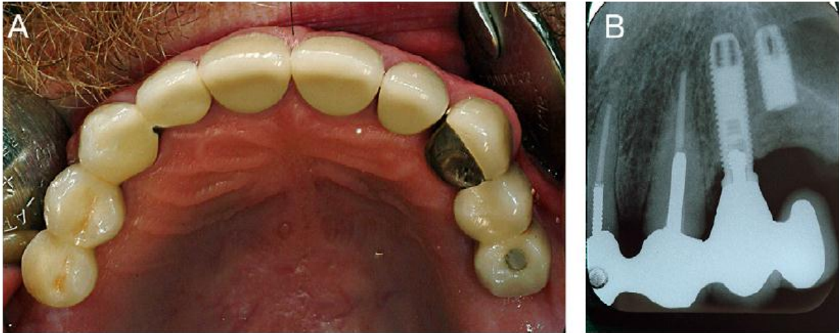
Slika 2. 57-ogodišnji pacijent s frakturom implantata na poziciji 25 uzrokovanoj preopterećenjem. Preuzeto s dopuštenjem (27).

otpuštanje protetskog vijka, odcementiranje, frakture protetskog dijela tzv. „chipping“ keramike, frakture baze proteze i proteznih zuba (39).