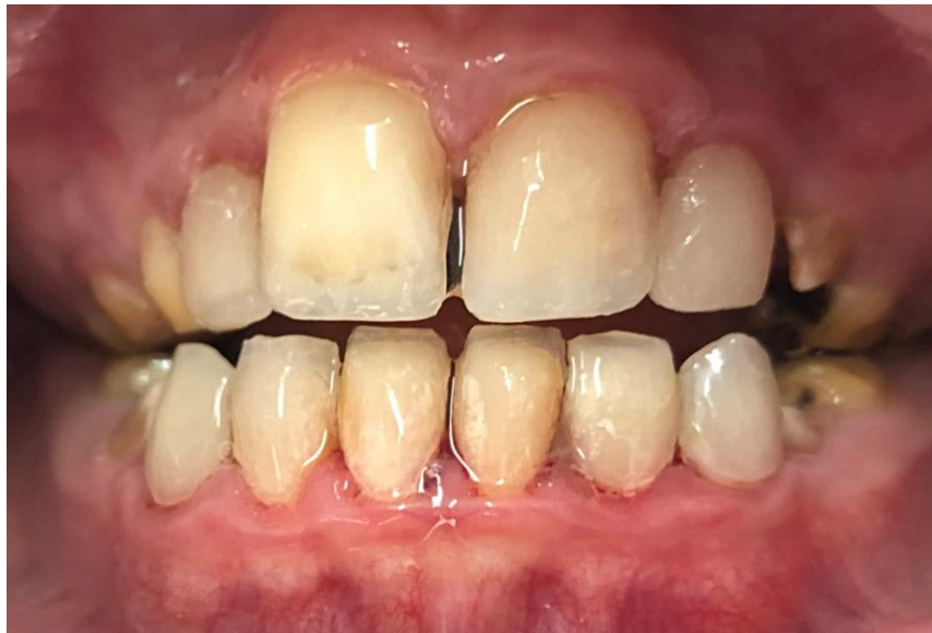
Slika 14. Završni rezultat terapije AI direktnim kompozitnim ljuskama

Indirektna tehnika izrade kompozitnih ljuski omogućuje restauraciju defekata prouzročenih AI (Slika 14). Osim estetskog učinka, fasete djeluju i na funkciju redukcijom preosjetljivosti zuba.