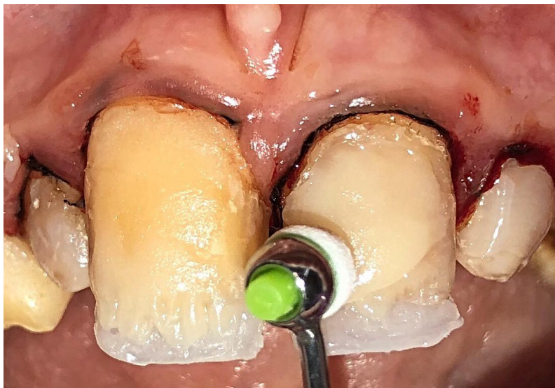
Slika 11. Slojevito nanošenje kompozitnog materijala