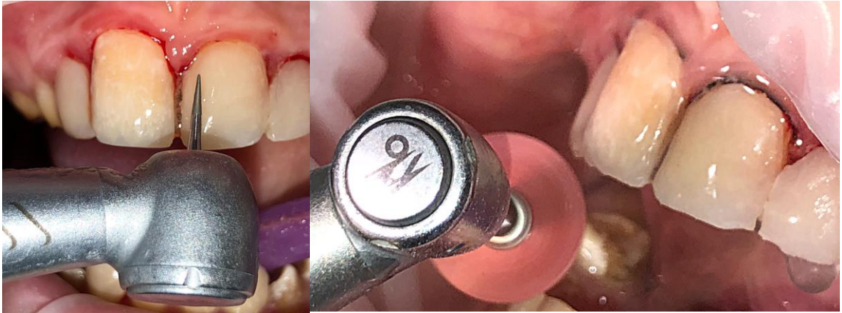
Slika 12. Završno oblikovanje dijamantrnim svrdlima (lijevo)