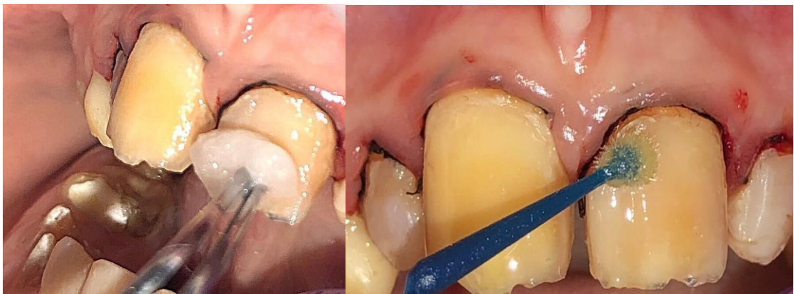
Slika 8. (lijevo) Aplikacija 5 % NaOCl