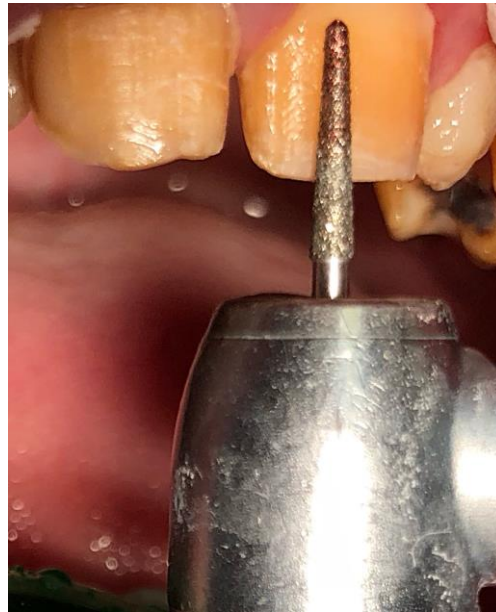
Slika 7. Preparacija vestibularne stijenke dijamantrnim svrdlom