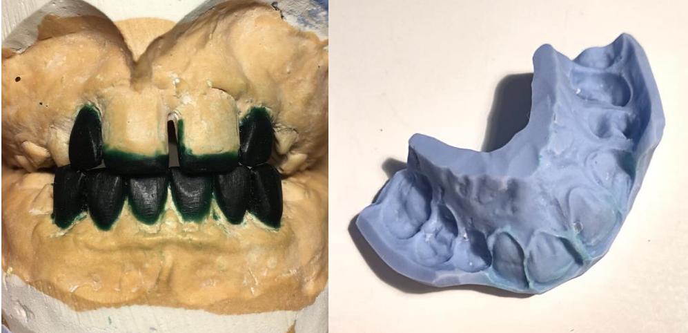
Slika 3. (lijevo) Wax up na sadrenom modelu

odstranit će višak proteina koji mogu omesti adheziju. Primjena samojetkajućih adheziva rezultirat će demineralizacijom cakline manjeg stupnja s posljedično jačom čvrstoćom adhezijske veze.