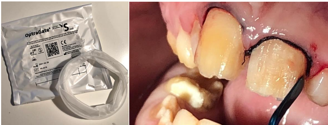
Slika 5. (lijevo) OptraGate Small (Ivoclar Vivadent)