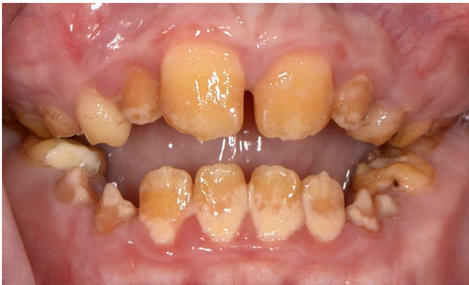
Slika 1. Amelogenesis imperfecta – hipoklacifikacijski tip

Zubi su hrapavi i prekriveni samo dentinom te izrazito osjetljivi na toplo i hladno. Boja varira od žute do tamnosmeđe. Jednako zahvaćena i mliječna i trajna denticija. Uočena je velika količina supragingivnog zubnog kamenca te skeletni prednji otvoreni zagriz (Slika 1).