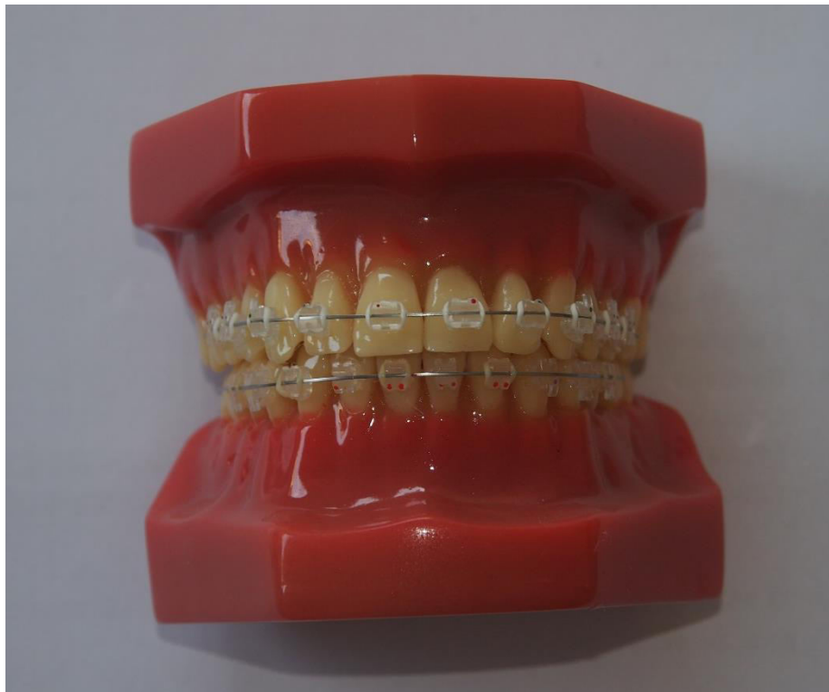
Slika 2. Estetske bravice s MBT preskripcijom.