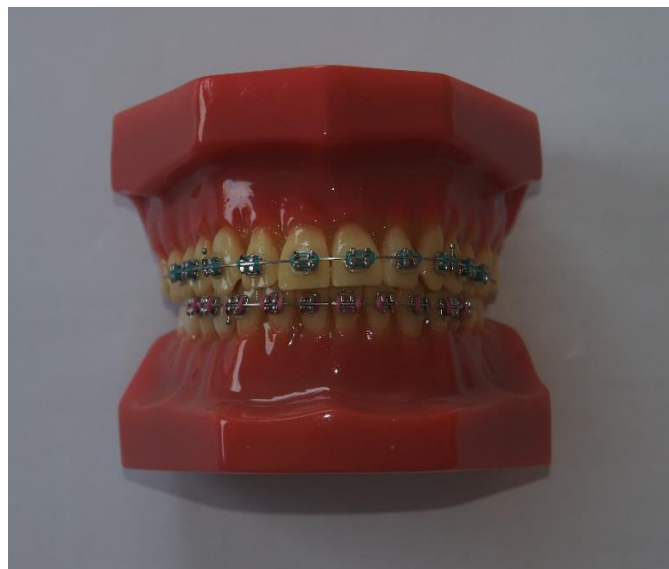
Slika 1. Metalne bravice – Rothova tehnika.