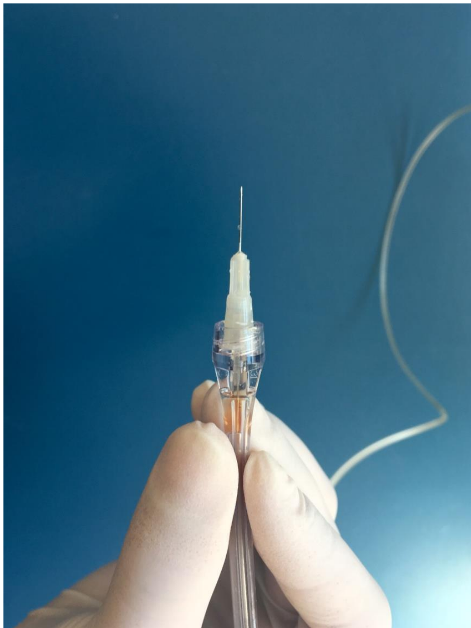
Slika 1. The Wand radni nastavak pridržava se u ruci poput olovke.

Proizvođač navodi da kontinuirani pozitivni tlak koji uređaj stvara omogućuje da kap anestetika u svakom trenutku prethodi vršku igle tijekom insercije igle u tkivo. Teorija je da je u slučaju sporog prodiranja igle u tkivo, kap anestetika koja prethodi vršku igle odgovorna za analgeziju tkiva kroz koje igla tek mora prodrijeti. Kombinacija stvorenog “puta anestetika” i kontroliranog protoka trebale bi osigurati neosjetnu ili barem manje bolnu injekciju (20, 21).