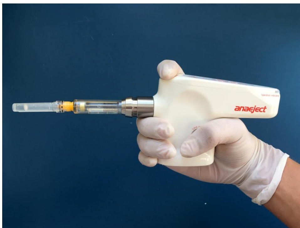
Slika 4. Anaeject se u ruci drži poput pištolja.