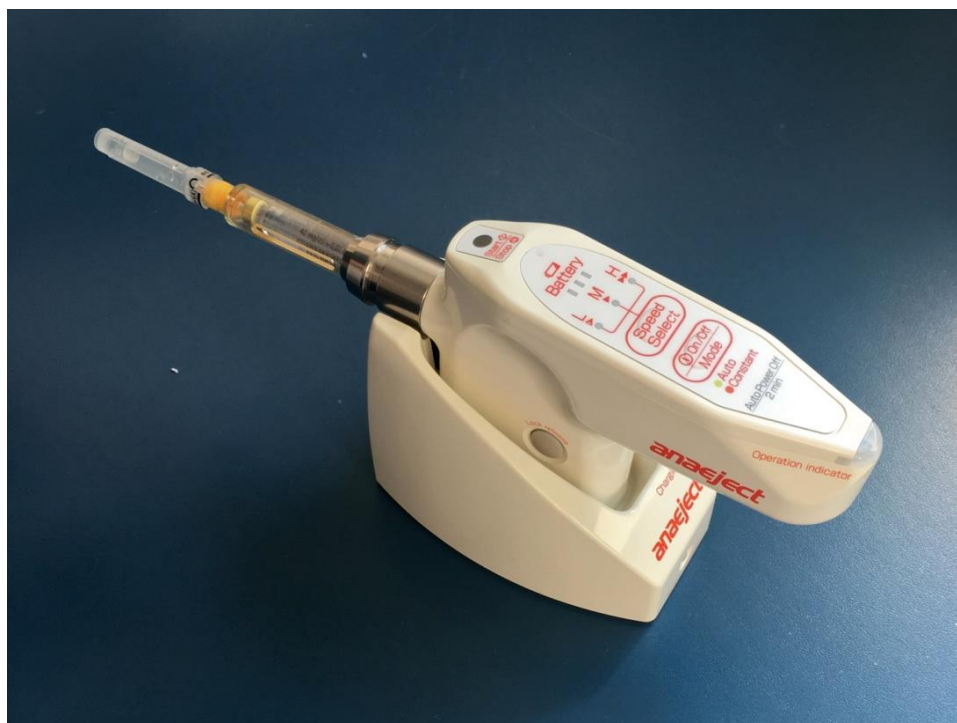
Slika 3. Anaeject u pripadajućem punjaču.