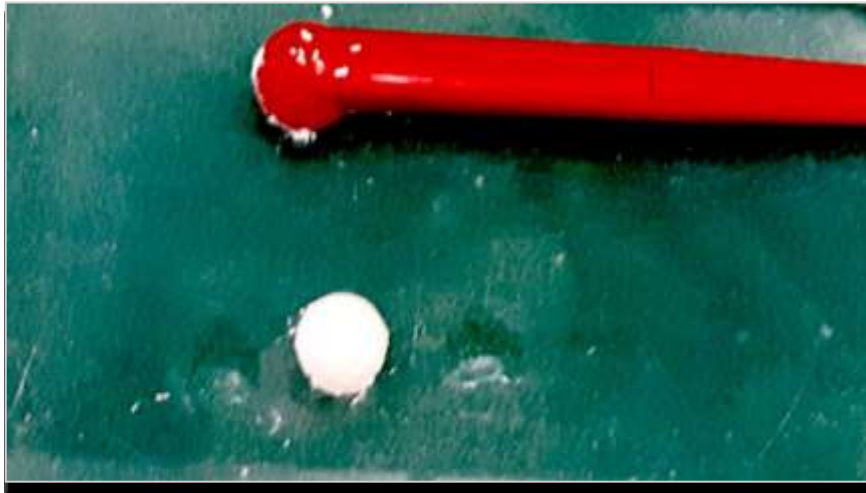
Slika 1. Konvencionalni SIC u obliku tekućine i praha za ručno miješanje.