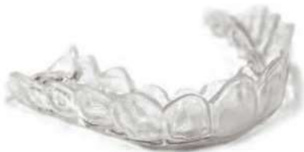
Slika 9. Udlaga za izbjeljivanje zubi. Preuzeto iz: (14)

izbjeljivanje, postupak izbjeljivanja je duži. Udlaga se može nositi od tjedan dana pa sve do 6 mjeseci kod teških obojenja zubi poput tetraciklinskih (1). Nakon što se postigne željeni rezultat od pacijenta se zatraži vraćanje udlage da ne bi došlo do prekomjernog izbjeljivanja. To je potrebno jer pacijenti postanu opsjednuti izbjeljivanjem i nastave ga provoditi bez obzira na upute (1).