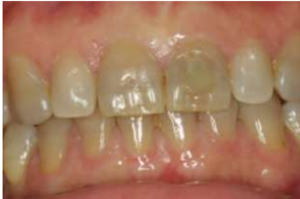
Slika 2. Tetraciklinsko obojenje zubi. Preuzeto iz: (6)