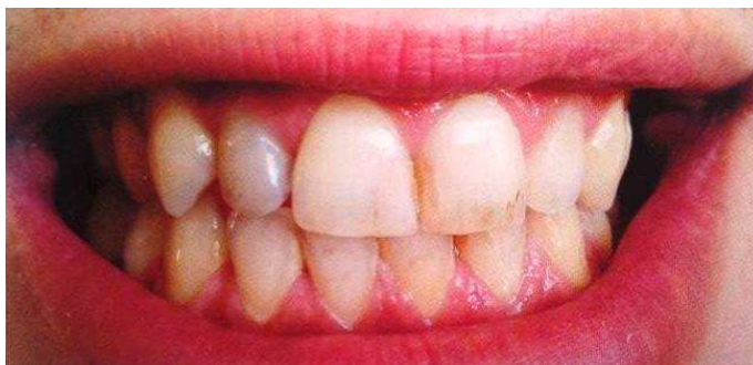
Slika 4. Vanjsko obojenje zubi uzrokovano nikotinskim pigmentom. Preuzeto iz: (2)

profilaktički postupci u ordinaciji poput pjeskarenja, poliranja zubi i čišćenja kamenca (2).