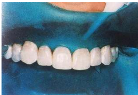
Slika 8. Izolirano radno polje pomoću koferdama i zaštitnog sredstva.