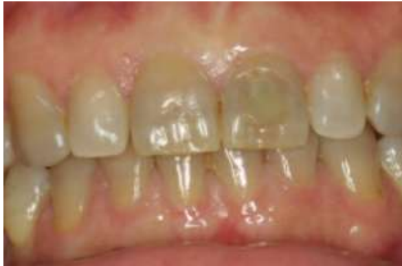
Slika 2. Tetraciklinsko obojenje zubi. Preuzeto iz: (6)