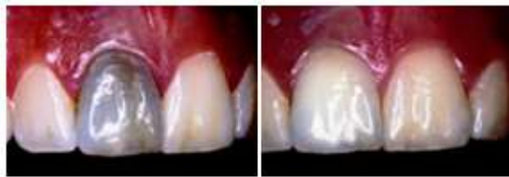
Slika 10. Prije i poslije izbjeljivanja avitalnog zuba. Preuzeto iz: (6)

može biti cinkoksifosfatni ili staklenoionomerni cement (23). Podloga služi kao zaštitna barijera od prodiranja sredstva za izbjeljivanje visoke koncentracije u korijenski kanal. Za izbjeljivanje avitalnih zubi koristi se 35% vodikov peroksid ili 95% natrijev perborat koji se postavljaju u predhodno očišćenu pulpnu komoricu (2). Kavitet se zatvori privremenim ispunom te se pacijenta naručuje najduže za tri dana ( Walking Bleach ). Postupak se ponavlja dok ne dobijemo željeni rezultat te se može kombinirati s drugim tehnikama izbjeljivanja (1) (Slika 10).