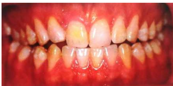
Slika 1. Hipomaturacijski oblik amelogenesis imperfecta. Preuzeto iz: (2)

nastale tijekom odontogeneze klinički se mogu očitovati u obliku hipokalcifikacije ili hipoplazije (2). Najčešći razvojni poremećaj cakline koji uzrokuje obojenje zuba jest amelogenesis imperfecta (2).