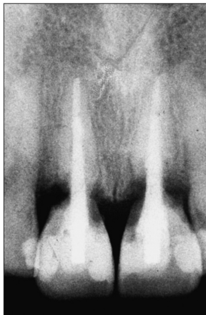
Slika 12. Vanjska resorpcija korijena uzrokovana izbjeljivanjem. Preuzeto iz: (6)