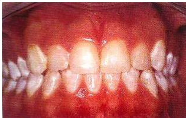
Slika 3. Fluoroza.