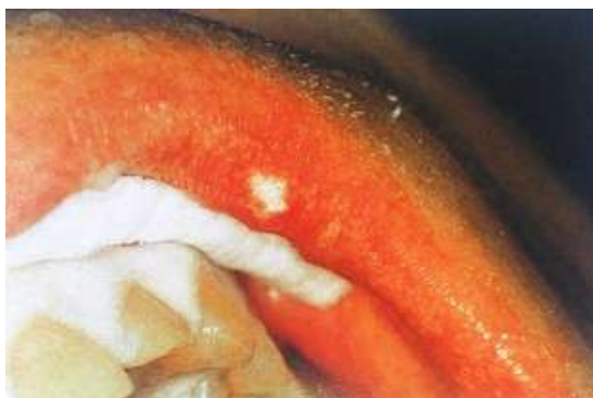
Slika 11. Kemijska opeklina. Preuzeto iz: (1)

Uporabom nižih koncentracija sredstva za izbjeljivanje, također će se smanjiti nuspojave gingive (1). Treba obratiti pažnju na količinu sredstva koje pacijent nanosi u udlagu i objasniti pacijentu da se višak materijala mora ukloniti kako bi se spriječila iritacije mekih tkiva. Zaglađivanjem i poliranjem rubova udlage preventivno se djeluje na iritaciju gingive (1,26). Tijekom postupka važno je upozoriti pacijenta na iznimnu važnost održavanja oralne higijene.