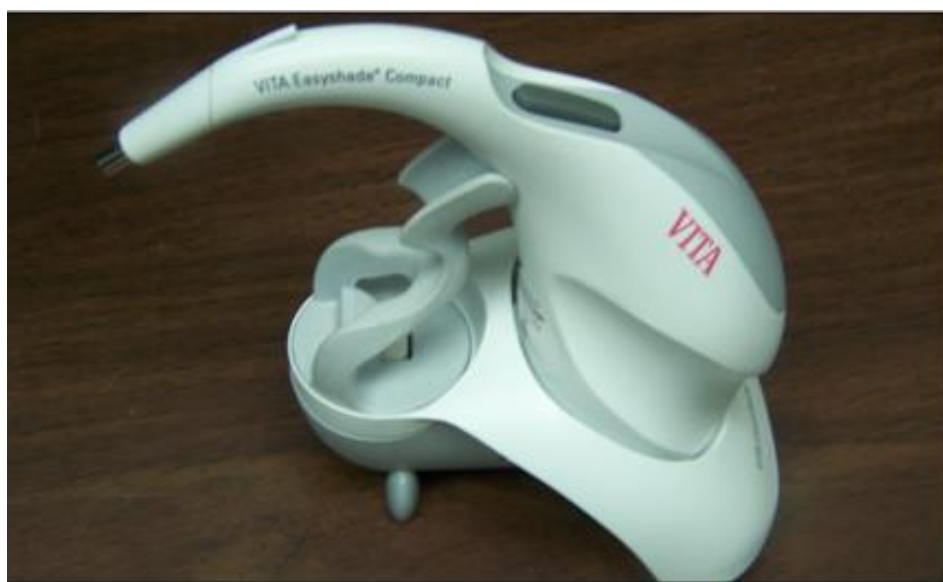
Slika 4. Kolorimetar – digitalni uređaj za određivanje boje zuba.

No, osnovni nedostatak svih digitalnih metoda njihova je visoka cijena, a problem također leži u subjektivnom tumačenju dobivenih podataka, dok su tehnike oblikovanja estetskih nadomjestaka i slojevanje materijalima različitih optičkih svojstava još uvijek u domeni dentalnih tehničara.