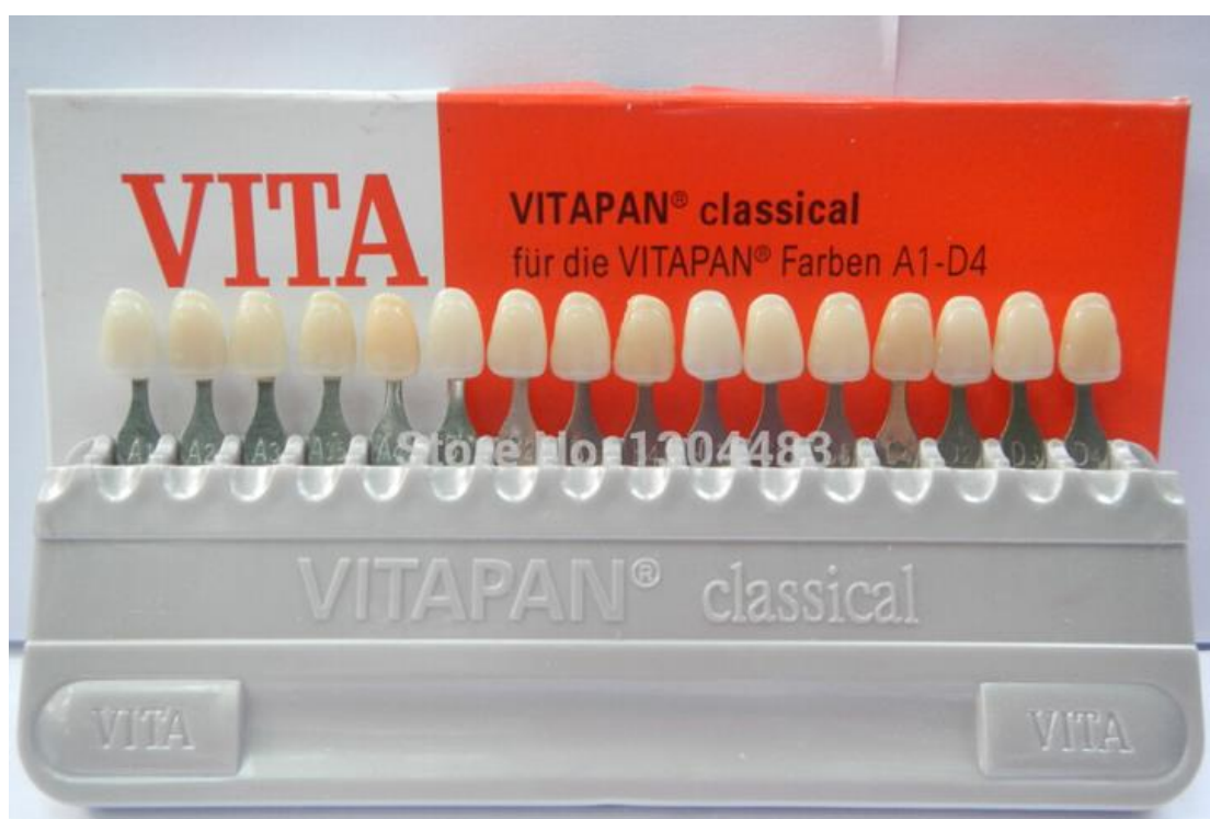
Slika 2. Ključ boja.

brojkom, a potom je unutar svake nijanse stupanj zasićenosti od nižeg ka višem označen dodatnim brojkama. Iako se ova metoda koristi i danas, i donedavno je bila jedini način određivanja i uspoređivanja boja, ima mnogo nedostataka. Prije svega, radi se o subjektivnom dojmu kod kojeg su mogući različiti otkloni uzrokovani pogreškom promatrača te utjecajem okoline. Problem je i što često ključevi boja ne posjeduju sve karakteristike boje, pogotovo onu vezanu uz stupanj translucencije. Da bismo izbjegli te nedostatke, potrebno je prethodno dobro uvježbati oko, za što danas postoje razni edukacijski programi (12).