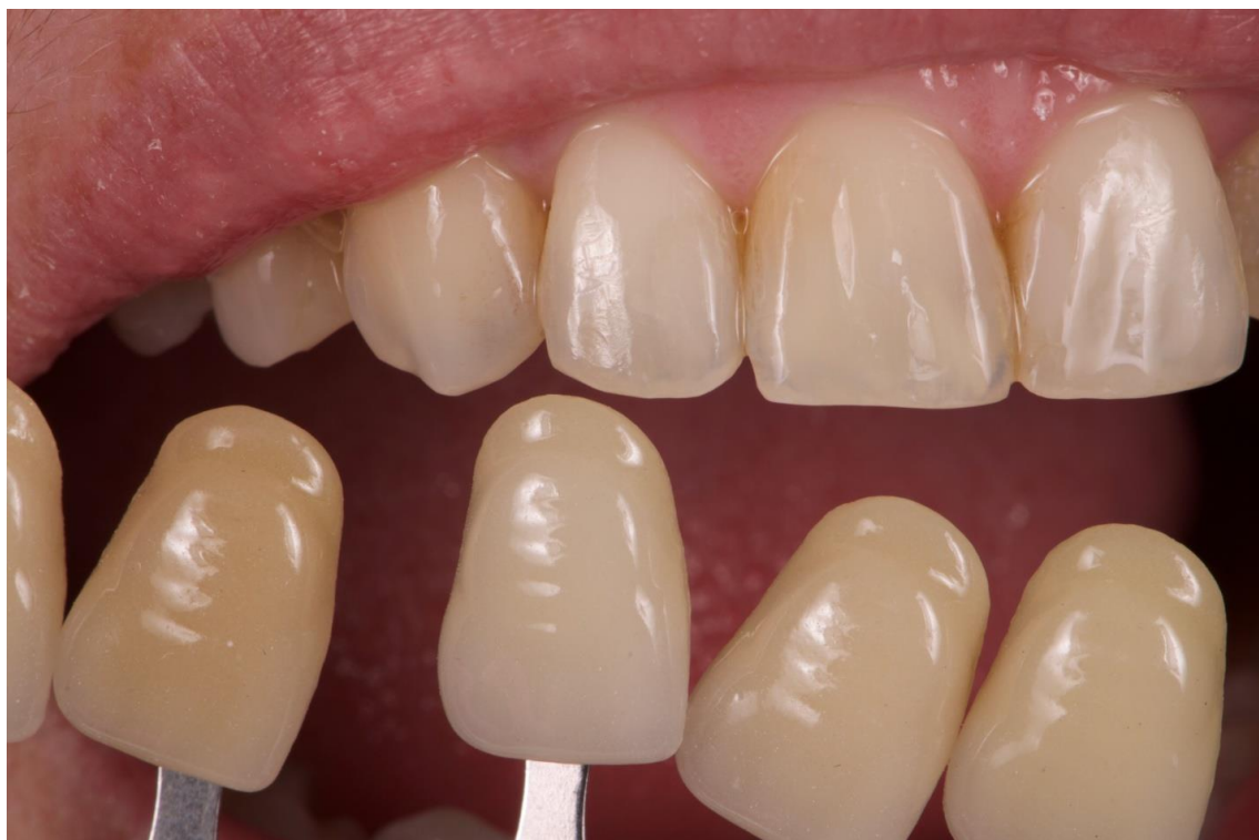
Slika 3. Primjena ključa boja.

Digitalno određivanje boje zuba omogućuje nam procjenjivanje željene boje objektivno, bez utjecaja velikog broja različitih čimbenika i bez utjecaja promatrača i okoline, što ovu metodu čini točnijom i pouzdanijom od klasične metode procjene uz uporabu ključa boja. Ovim načinom moguće je istovremeno procijeniti nijansu, svjetlinu, stupanj zasićenosti te translucenciju boje. Ovisno o principu prema kojem se određuju boje, danas postoje tri različite vrste digitalnih metoda - digitalna kamera, spektrofotometar i kolorimetar. Među njima, najjednostavnija je metoda procjene boje uporabom digitalne kamere i Adobe Photoshopa, zbog čega se ova metoda najčešće koristi. Njom se prikupljaju samo osnovni podaci o boji koji pomažu u komunikaciji stomatologa i dentalnog tehničara pružajući informacije o količini neke nijanse. No, nedostatna je pri dubljoj analizi karakteristika boje (1).