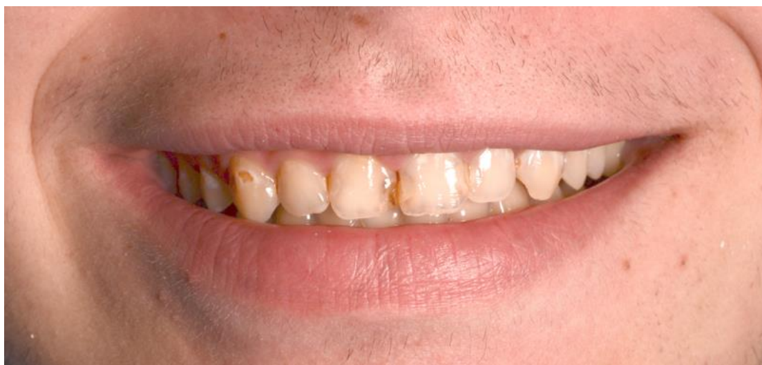
Slika 1. Pokazatelj potrebe za pretprotetskom terapijom.

Atricija je gubitak tvrdih zubnih tkiva uzrokovan kontaktom zuba o zub za vrijeme funkcijskih ili parafunkcijskih kretnji, a razlikujemo fiziološku, interproksimalnu, intenziviranu te patološku. Pri fiziološkoj se atriciji najprije troše incizalni bridovi sjekutića uključujući gubitak incizalnih brazdi, a zatim se troše okluzalne plohe kutnjaka i završno, palatinalne kvržice gornjih te bukalne kvržice donjih kutnjaka. Uzroci intenzivirane i patološke atricije su parafunkcije kao što je bruksizam i različita stanja poremećaja mineralizacije.