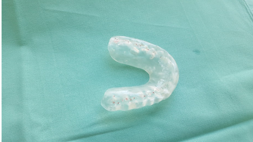
Slika 5. Prikaz dodira na relaksacijskoj udlazi (dodiri označeni artikulacijskom folijom).

10). Artikulacijskom se folijom debljine 8 mikrometara ( \mu\text{m} ) intraoralno ispituju točkasti kontakti u položaju centrične relacije te pri laterotruzijskim i protruzijskim kretnjama, a nepoželjni kontakti dodatno se ubrušavaju nasadnikom i frezom (Slika 5.).