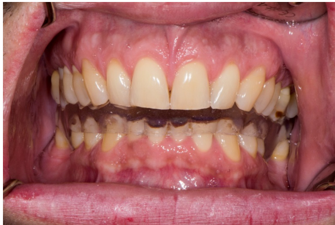
Slika 2. Donja relaksacijska udlaga.

Relaksacijska, odnosno stabilizacijska udlaga mobilna je ortopedska naprava izrađena od tvrdog akrilata koja svojim ravnim ploham prekriva jedan zubni luk i osigurava točkaste kontakte s antagonističkim zubima u centričnoj relaciji te vođenje očnjakom pri ekscentričnim kretnjama (Slika 2.). Udlagu su osmislili Ramfjord i Ash na Michiganskom sveučilištu (SAD) za potrebe liječenja disfunkcije TMZ-a i kontrole bruksizma te se još naziva i michiganskom udlagom, odnosno Michigan splint (4).