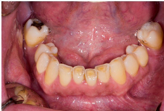
Slika 1. Posljedice bruksizma na zubima.

Kliničkim pregledom vidljivi su abnormalni gubitak tvrdog zubnog tkiva (brusne fasete), lom ispuna i uzdužne infrakcije cakline, gingivne recesije, povećana mobilnost zubi, linea alba na obraznoj sluznici i impresije jezika (16, 18) (Slika 1.). Tijekom parafunkcijskih kretnji kondili se ne nalaze u stabilnom položaju te postoji opasnost od nastanka mikrotrauma (2, 21).