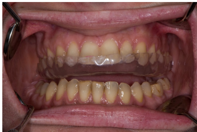
Slika 4. Okluzijsko vođenje očnjakom.

okluzalne plohe (4). Rubovi udlage trebali bi prekrivati dio nepca u obliku potkove, udaljeni dva centimetra od cervikalnog ruba zuba sa završetkom iza zadnjeg kutnjaka, čime se smanjuje opasnost od supraerupcije zuba nepokrivenih udlagom (4, 10). Na model gornje čeljusti vakuumski se aplicira termo folija određene debljine. Folija se reže i adaptira do prethodno označenih rubova na sadrenom modelu. Model se vraća u artikulator gdje se udlaga modelira hladno polimerizirajućim akrilatom uz dodatnu polimerizaciju u visokotlačnom loncu (Ivomat, Ivoclar Vivadent, Schaan, Lihtenštajn). Polimerizirana udlaga vraća se na model gornje čeljusti u artikulator kako bi se ubrušavanjem akrilata postigli pravilni interokluzijski dodiri. Relaksacijska udlaga zahtijeva izradu ravnih glatkih ploha (ili blagih impresija) koje u stražnjem području osiguravaju točkaste kontakte radnih kvržica uz istovremenu disokluziju prednjih zuba (10, 23). Pri ubrušavanju je važno postići okluziju vođenu očnjakom (Slika 4.), što znači da ekscentrične kretnje donje čeljusti trebaju ostvariti dodire na očnjacima uz disokluziju stražnjih i prednjih zuba u visini od barem jednog mm (10).