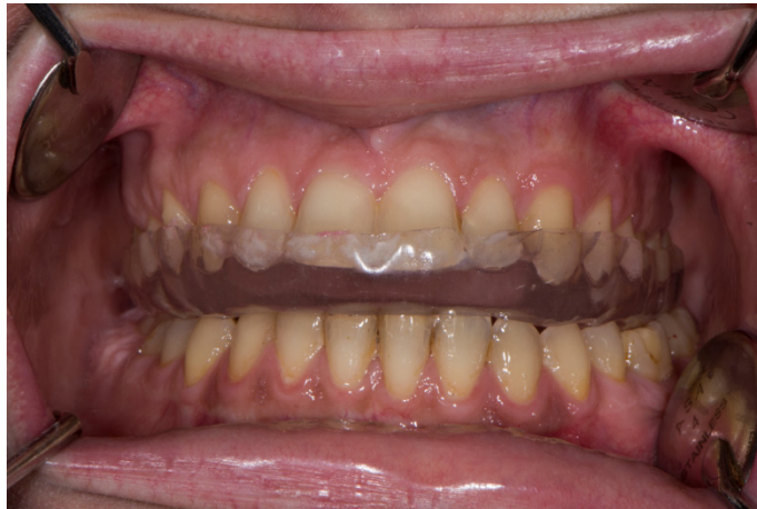
Slika 3. Gornja relaksacijska udlaga.

tehnologije koja se koristi kod izrade akrilatnih udlaga (proteza, kirurških vodilica i slično.) stereolitografija. U 3D se printeru akrilat (koji dolazi u tekućem stanju) nanosi sloj po sloj i pri tome se svaki sloj svjetlosno polimerizira kako bi se u konačnici dobila dizajnirana udlaga. Akrilat za 3D printanje razlikuje se kod različitih proizvođača, kao i 3D printeri (valne duljine polimerizacijskog svjetla) te je potrebno voditi računa o tome da često nije moguća kombinacija različitih materijala i 3D printera.