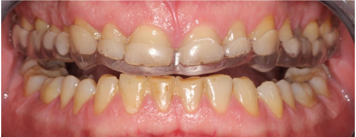
Slika 5. Protruzijska kretnja s okluzijskom udlagom.