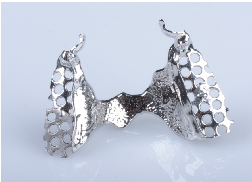
Slika 5. Isprintana metalna baza djelomične proteze nakon obrade, poliranja i čišćenja