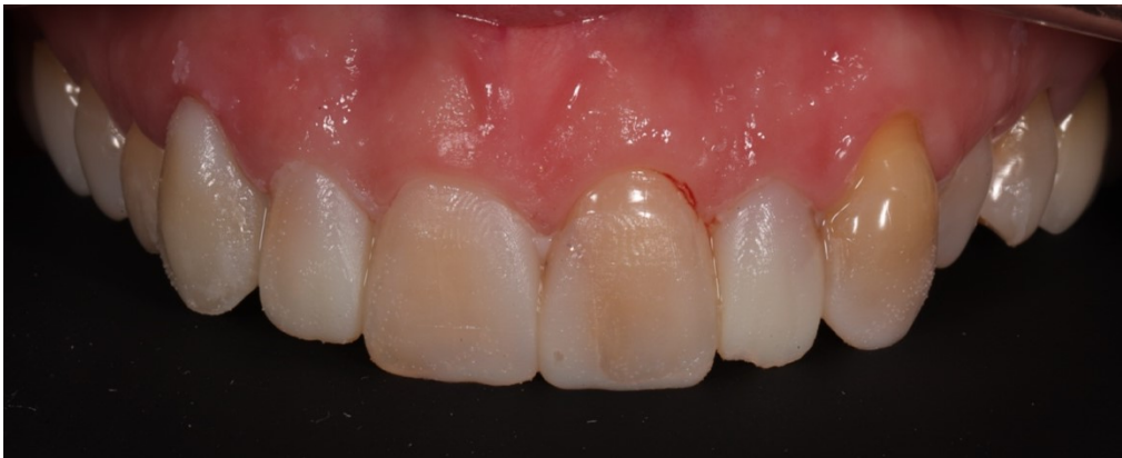
Slika 1. Intraoralni prikaz dijagnostičkog mock-upa na gornjim prednjim zubima.

preciznom planiranju zahvata, omogućujući da se unaprijed identificiraju i riješe potencijalni problemi. Drugo, pruža vizualnu prezentaciju pacijentu kako bi on mogao dobiti jasnu sliku o konačnom rezultatu terapije, što olakšava komunikaciju i povećava zadovoljstvo pacijenta. Također, wax-up služi kao vodič tijekom zahvata same preparacije jer imamo buduće stanje zuba koje gledamo omogućujući stomatologu da precizno prati planirane promjene i osigurava optimalan estetski i funkcionalni rezultat. Pomoću dijagnostičkog wax-upa može se izraditi i privremeni nadomjestak (5). Proces započinje uzimanjem otiska modela sa wax-upom pomoću silikonskog materijala ili izradom kalupa od prešane folije. Silikonski ključ ili kalup se potom napuni autopolimerizirajućom smolom i postavlja na zube pacijenta u ustima. Nakon što se smola stvrdne, stvara se privremeni nadomjestak koji služi kao prototip za konačni protetski rad. (14). Plan terapije možemo prenijeti i pacijentu u usta tehnikom mock-upa . Dijagnostički mock-up predstavlja klinički ekvivalent dijagnostičkom wax-upu (Slika 1.) (14).