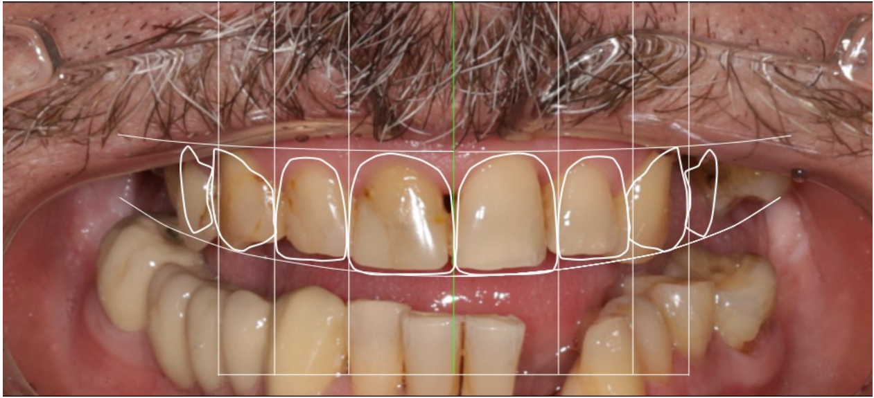
Slika 2. Prikaz pripreme DSD protokola na intraoralnoj fotografiji pacijenta.