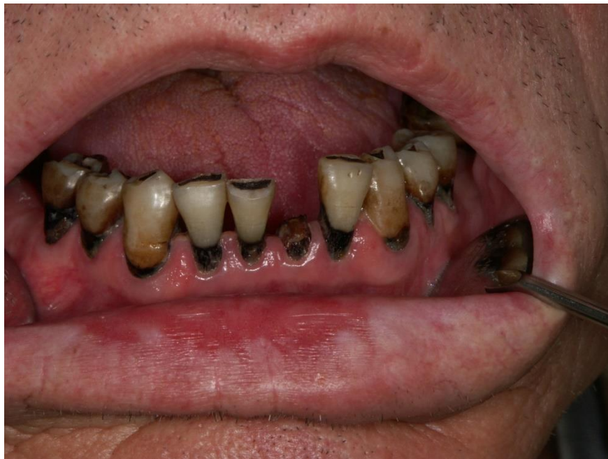
Slika 1. Radijacijski karijes.

Trauma, uključujući ekstrakciju zubi, je već godinama prepoznata kao jedan od najznačajnijih faktora rizika za nastanak ORN. Trauma povećava rizik za nastanak bolesti tri puta. Većina slučajeva ORN u literaturi posljedica su ekstrakcije zuba, najčešće zbog radijacijskog karijesa (Slika 1) (6,11).