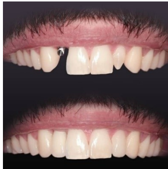
Slika 2. Titanska nadogradnja na implantatu na poziciji zuba 12.

Rub titanskih implantata odnosno titanske nadogradnje može sivkasto prosijavati kroz periimplantatna meka tkiva, posebno vidljivo kod tankog biotipa gingive i visoke linije usne. Kod nedostatka facijalne koštane stijenke dolazi do recesije gingive što prikazuje rubove implantata. U svrhu poboljšanja estetike počinju se koristiti keramički implantati i nadogradnje. Titanske nadogradnje (Slika 2.) smatraju se vrlo pouzdanima, pokazuju veliku čvrstoću i otpornost na distorziju, no ne preporučuju se u estetskoj zoni, tim više jer može trajno obojiti meka tkiva. Itrijem ojačani cirkonij-oksidi je inertan materijal koji ne korodira te je izrazito biokompatibilan. Istraživanjima je dokazano da je adhezija bakterijskog biofilma manja nego na titanskim strukturama. Cirkonij-oksidne nadogradnje (Slika 3.) pokazale su se estetski istovjetnima, ali mehanički boljima od aluminij-oksidnih nadogradnja. Krunice na nadogradnjama mogu biti izrađene od glinične keramike na cirkonij-oksidnoj ili metalnoj osnovi, od monolitnog litij-disilikata ili monolitnog cirkonij-oksida. U estetskoj zoni preporuča se, kao obložni materijal, koristiti gliničnu keramiku zbog izvrsnih optičkih svojstava na cirkonij-oksidnoj jezgri s obzirom na to da su okluzijske sile neznčajne, pa je rizik od loma malen. (1, 18 – 20)