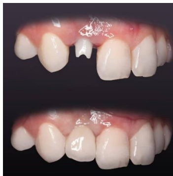
Slika 3. Cirkonij-oksidna nadogradnja na implantatu na poziciji zuba 12.