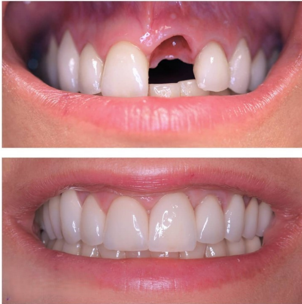
Slika 4. Implantoprotetski rad uklopljen u postojeći zubni niz na poziciji zuba 21. Preuzeto s dopuštenjem autora: izv. prof. dr. sc. Nikola Petričević.

Kako bi rezultati bili visoko estetski, posebna pozornost se pridodaje adekvatnosti mekog tkiva i kosti, pa je kod odabira kandidata za postavu implantata izrazito važno procijeniti situaciju te utvrditi potrebu za augmentacijom ili podešavanjem postojećih tkiva. U tome pomažu, uz klinički pregled, i razna dijagnostička sredstva kao što je rendgensko snimanje. Uz anatomske preduvjete, kako bi se rad uklopio u estetiku osmijeha, potrebno je razmotriti liniju usne te dubinu zagrizu. Treba uzeti u obzir da se ne vidi rub implantata na koji je učvršćena protetska nadogradnja, pogotovo kod osoba s vidljivom gingivom prilikom govora ili osmijeha. Poseban oprez je potreban da gingivalne konture budu usklađene. Kontinuitet papila je pritom ključan za estetiku, a u slučaju da nedostaju, vidljivi su „crni trokuti“ koji se ne smatraju lijepima. Postojanje papile je ovisno o razini pričvrška susjednih zubi, stoga se preporučuje