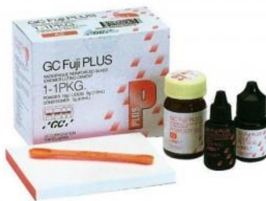
Slika 4. Akrilatom pojačani staklenoionomerni cement za cementiranje.

maksimalna količina praha i poboljšana su mehanička svojstva. Tip 3 cementi ovisno o odnosu praha i tekućine mogu se podijeliti na dvije podskupine. Skupina za podloge („lineri“) koja ima malu količinu praha, time i smanjena mehanička svojstva. Dizajnirani su kao podloga definitivnim materijalima. Drugu podskupinu čine SIC-i koji se koriste kao baze ili zamjena za dentin. Potrebna su dobra mehanička svojstva, time je dodana velika količina praha u omjeru 3:1 naspram tekućem dijelu (16). Staklenoionomerni cementi se još dijele prema kemijskom sastavu i načinu stvrdnjavanja. Razlikujemo konvencionalne samostvrdnjavajuće, akrilatom pojačane svjetlosnopolimerizirajuće, akrilatom pojačani samostvrdnjavajući te svjetlom aktivirani samostvrdnjavajući cementi (15). Komercijalni nazivi SIC cemenata su Glasionomer Tip 1 (Shofu), Ketac-bond (Espe), Ketac-fill (Espe), GC Fuji 1 (G.C.), GC Fuji PLUS 1-1 (G.C.).