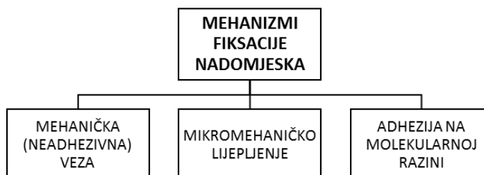
Slika 1. Prikaz vrsta mehanizama fiksacije nadomjestka

To su mehanička (neadhezivna) fiksacija, mikromehaničko lijepljenje i adhezija na molekularnoj razini (Slika 1).