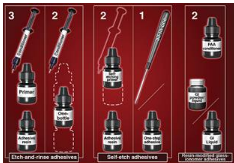
Slika 6. Klasifikacija adhezivnih sustava prema interakciji sa zubnim tkivom. Preuzeto iz: (32)

Dakle, nakon pripreme površine zuba nanosi se adheziv na bataljak. Adheziv se ne polimerizira kao kod postupka izrade ispuna. Takav nepolimeriziran adheziv zadržava svojstvo bolje impregnacije s cementom te bolje integriraju jedan s drugim. Kada se nanaese adheziv, pažljivo se ispuhivanjem stanji sloj. Pozornost treba obratiti i na jakost osvjetljenja jedinice, da se spriječi prijevremena polimerizacija adheziva i cementa (27). Nakon ovog postupka slijedi priprema cementa, nanošenje cementa na bataljak i u nadomjestak te fiksiranje.