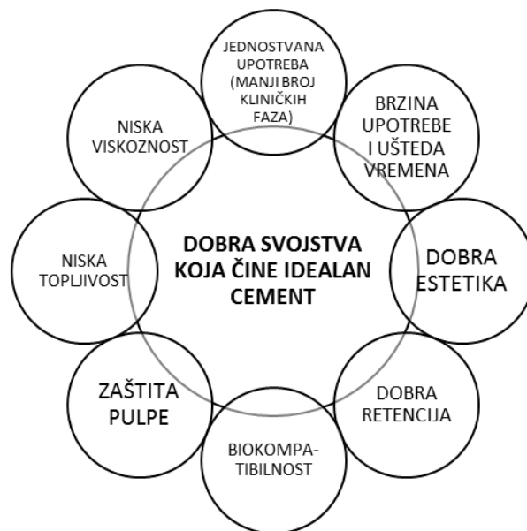
Slika 2. Prikaz svojstava koja čine idealan cement

Vrijeme rada treba biti dovoljno dugo, a vrijeme vezivanja omogućiti postavljanje materijala u nadomjestak dok je još u fazi optimalne konzistencije. Korisno je da cement daje dovoljno vremena za manipulaciju, dakle duže radno vrijeme, ali da uz to ima kratko vrijeme stvrdnjavanja (6). Kod protetskih radova kod kojih postoji mogućnost prosijavanja boje cementa kroz stijenku, npr. akrilat ili staklokeramika, potrebno je individualno uskladiti boju cementa boji zuba putem ključa boja. Istovremeno se uzima u obzir i stupanj transparencije i translucencije materijala nadomjestka. Cement direktno utječe na estetiku kompletnog rada te njegova dobra estetska svojstva čine nezaobilazan korak prema idealnom protetskom radu (3). Na slici 2 prikazana su svojstva nabrojana u tekstu.