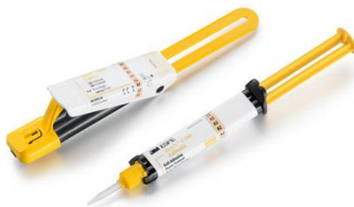
Slika 7. Samoadhezivni cement na bazi smole.

cemenata su: Panavia F (Kuraray Dental), Variolink Veneer, Variolink Esthetic, Multilink Automix, SpeedCEM Plus (Ivoclar Vivadent), RelyX™ (3M Espe).