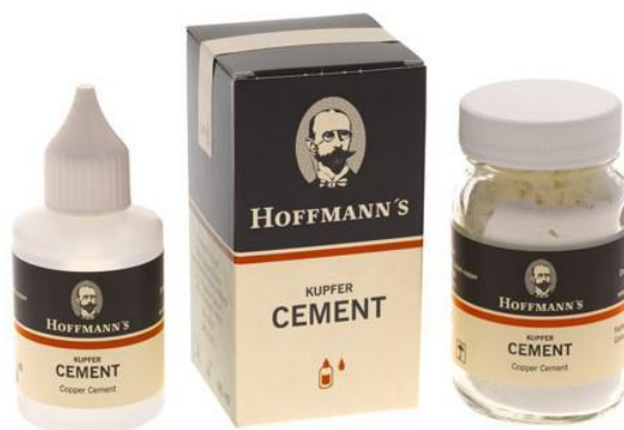
Slika 3. Cinkoksifosfatni cement. Preuzeto iz: (13)

prednosti i nedostatke. Kao slabosti i svojstvene probleme prije svega treba spomenuti visoku topljivost ovih cemenata. Tekući dio sastoji se od fosforne kiseline koja može uzrokovati osjetljivost pulpe nakon tretmana. Cinkoksifosfatni cement nema svojstvo pečaćenja, ne otpušta fluoride i nije translucentan. Da vrijeme „gazi“ ovaj cement najviše je zaslužna adhezivna era i spajanje materijala kemijskom vezom za tvrda zubna tkiva (11). Pripravljavanje cementa vrlo je osjetljiv korak u fazi cementiranja. Cementna prašina podijeli se u nekoliko dijelova te se svaki dio pojedinačno umiješa u tekućinu. U usporedbi s modernijim cementima, klinički rad s cinkoksifosfatnim cementom je izazov (12). Prednosti ovog materijala su ekonomičnost, jednostavnost rukovanja, predvidljivo ponašanje u raznim situacijama te lako uklanjanje stvrdnutog cementa. Koristi se za cementiranje kovinskih i estetskih nadomjestaka s metalnom osnovom, te kod potpuno keramičkih radova (aluminijeva i cirkon-oksida keramika) (1). Najpoznatiji tvornički naziv je Harvard cement (Richter & Hoffmann, Njemačka).