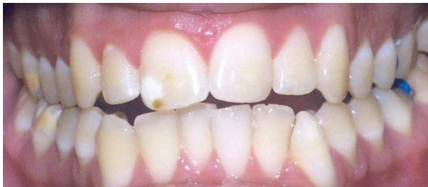
Slika 2. Intraoralni prikaz MIH-a umjerenog intenziteta. Preuzeto: (8)

Klinička slika MIH-a na kutnjacima može varirati od blagih bjeličastih zamućenja do težih žutosmeđih hipomineralizacija praćenih posterupcijskim lomom cakline. Zahvaćenost sjekutića očituje se promjenom boje labijalnih površina bez gubitka cakline, rijetko praćene prekidom njezinog kontinuiteta (Slika 2). Kod MIH-a, caklina je podložnija nastanku karijesa pa je izgled defekta asimetričan, dok kontralateralni zub ne mora ili može biti umjereno do jače oštećen (9).