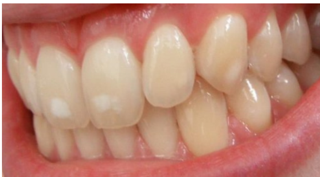
Slika 3. Intraoralni prikaz dentalne fluoroze blagog intenziteta.

Klinička manifestacija očituje se bijelim mutnim prugama različite širine koje se pojavljuju na homolognim zubima. Područja su histološki porozna (hipomineralizirana), a stupanj poroznosti ovisi o koncentraciji fluorida u organizmu tijekom mineralizacije zuba (Slika 3). Najteži oblik predstavljaju zubi bijeli poput krede, a kasnije, nakon nicanja, na tim se zubima mogu pojaviti udubljenja kao rezultat posteruptivnog pucanja površinske cakline.