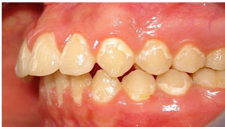
Slika 1. Intraoralni prikaz demineralizacije nakon ortodontske terapije.

Demineralizacija nakon ortodontske terapije česta je pojava, a posljedica je neadekvatne oralne higijene te predstavlja odgovor tvrdog zubnog tkiva na akumulaciju plaka (Slika 1). Nalazi se uz rub gingive i manifestira se kao početna karijesna lezija ili razvijeni karijes (6).