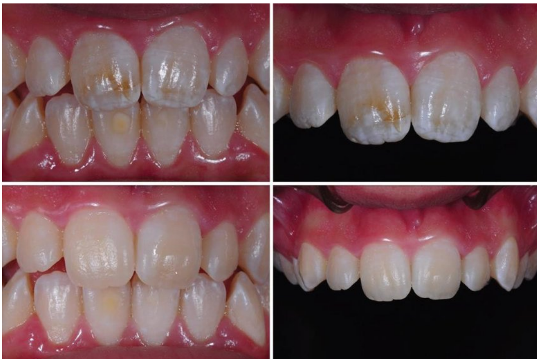
Slika 5. Intraoralni prikaz stanja prije i nakon tretmana infiltracijskom metodom. Preuzeto: (15)