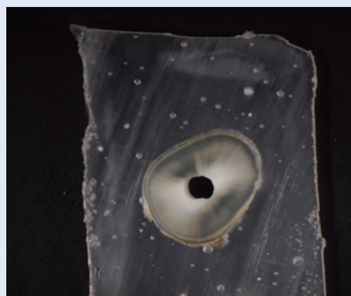
Slika 4. Presjek središnje trećine korijenskog kanala nakon 5-minutnog djelovanja EDTA-e Figure 4. Cross section of middle third of root canal after five minute irrigation with EDTA

Dobiveni rezultati ovog istraživanja stoga su u skladu s brojnim ispitivanjima drugih autora, te je potvrđena učinkovitost uklanjanja zaostatnog sloja uporabom 17 %-tne otopine EDTA-e tijekom određenog vremenskog perioda. Najbolji učinak glede uklanjanja zaostatnog sloja postignut je u cervikalnoj i središnjoj trećini korijenskog kanala, dok je u apikalnoj trećini, kao posljedica otežanog prodora irigansa, prisutno najviše zaostatnog sloja.