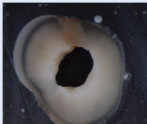
Slika 2. Presjek cervikalne trećine korijenskog kanala nakon 5-minutnog djelovanja EDTA-e Figure 2. Cross section of the cervical third of root canal after five minute irrigation with EDTA