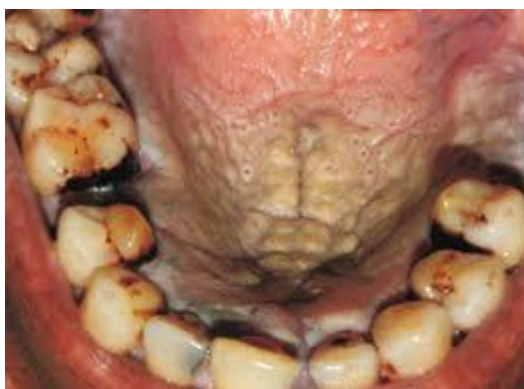
Slika 2. Palatitis (stomatitis) nicotinic . Preuzeto: (13)

Drugi naziv za leziju je leukokeratosis palatina nicotinic . Pojava palatitis nicotinic često se nađe u dogogodišnjih pušača lule i cigara, srednje i starije životne dobi, rijede u pušača cigareta. Lezije su hiperkeratotične, lokalizirane na nepcu, praćene oticanjem akcesornih nepčanih žlijezda slinovnica. Nepce je difuzno sivobijelo, akcesorne mukozne žlijezde su povećane, hiperkeratotičnih uzdignutih rubova, a izvodni kanali prikazuju se kao sitne crvene makule (Slika 2.). Nastaje zbog toplinske i kemijske iritacije oralne sluznice. Sama lezija je benigna i reverzibilna te prestankom pušenja dolazi do regresije lezije. Njezina lokalizacija objašnjava se činjenicom da je najjači mlaz duhanskog dima usmjeren upravo na nepčani dio sluznice. Lezija ne spada u prekanceroze (12).