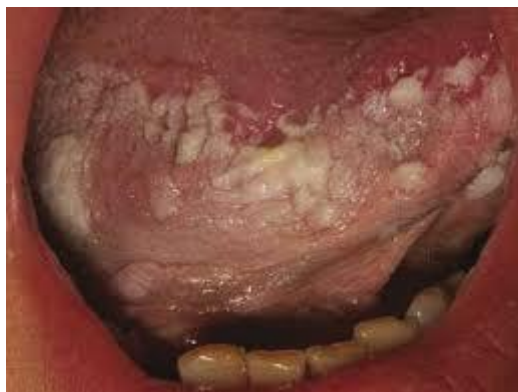
Slika 5. Leukoplakija. Preuzeto: (18)