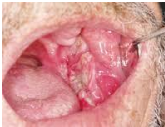
Slika 8. Karcinom usne šupljine. Preuzeto: (20)