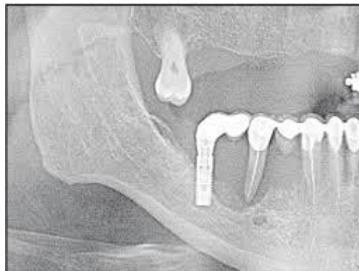
Slika 4. RTG slika istog pacijenta dvije godine nakon provedene implantološke terapije, vidljiva resorpcija kosti u području oko implantata. Preuzeto: (14)