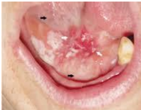
Slika 6. Eritroplakija. Preuzeto: (20)

noći. Rizik za eritroplakiju je veći među povremenim pušačima nego bivšim pušačima. Rizik je veći za one koji konzumiraju više cigareta dnevno (19).