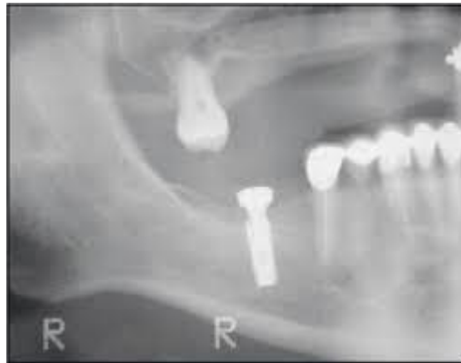
Slika 3. RTG slika pacijenta neposredno nakon ugradnje implantata. Preuzeto: (14)

dokazano je da bivši pušači imaju manji rizik za neuspjeh terapije od sadašnjih pušača (14).