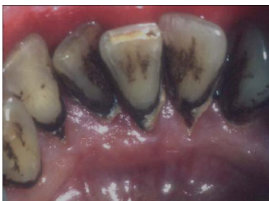
Slika 1. Diskoloracije zubi.

Pušenje je jedan od faktora koji može utjecati na estetiku zubi. Istraživanje provedeno u Velikoj Britaniji 2005. godine uspoređuje zadovoljstvo bojom zubi između pušača i nepušača, pri čemu je veće zadovoljstvo u nepušača. Zubi pušača imaju tendenciju nakupljanja mrlja žute, smeđe, pa čak i crne boje, pri čemu intenzitet obojenja ovisi o dužini pušačkog staža i broju dnevno popušanih cigareta (Slika 1.). Više od polovice nepušača smatrali su da imaju normalnu boju zubi, dok je manje od polovice pušača izvijestio isto. Umjerene i teške diskoloracije su češće u pušača (8).