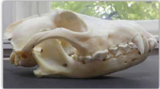
Slika 1. Zubalo čaglja.