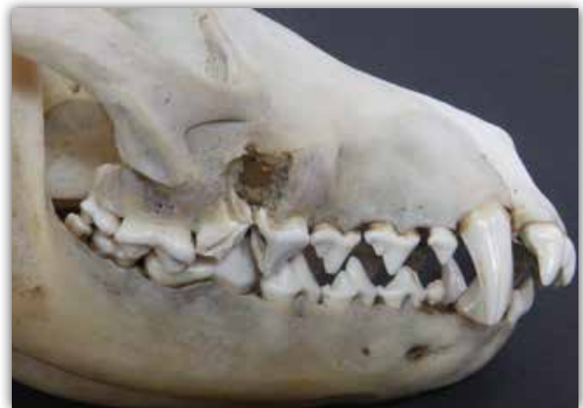
Slika 2. Dento-alveolarni apsces.