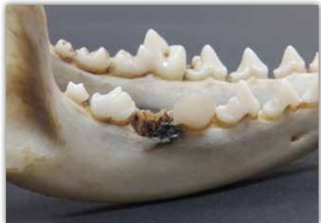
Slika 3. Komplikirani prijelom M1.

do prijeloma lako može doći prilikom borbe za teritorij te stoga ni ovaj uzrok ne treba u potpunosti odbaciti, posebice kada je riječ o većoj gustoći populacije.