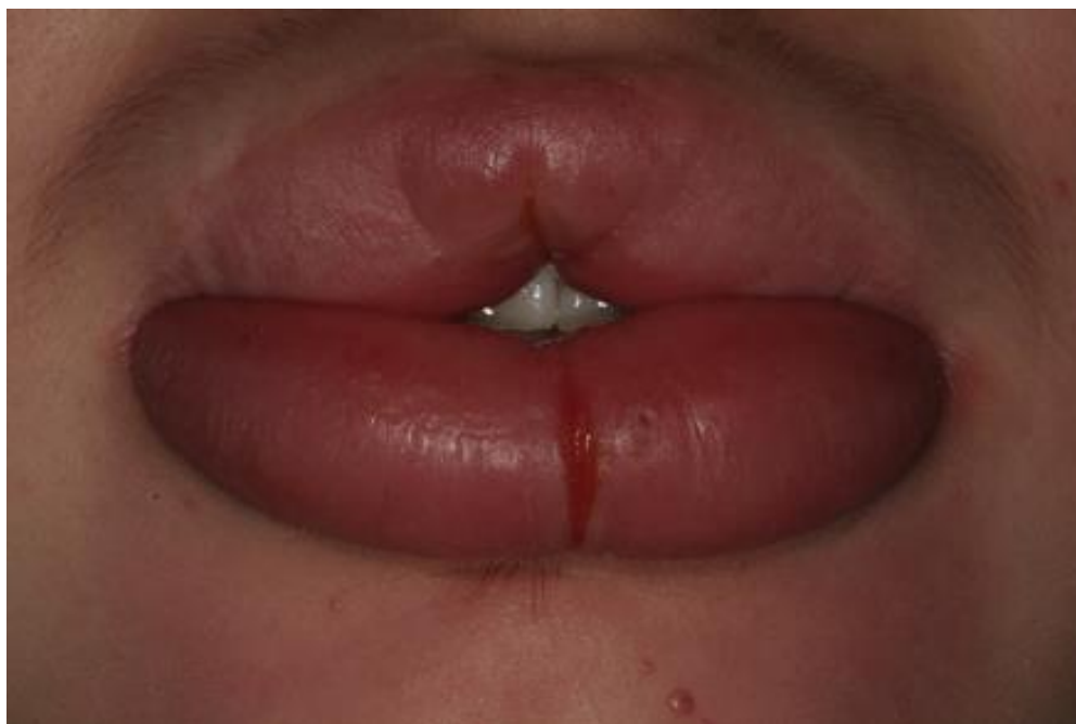
Slika 7. Klinički nalaz u bolesnika s orofacijalnom granulomatozom. Preuzeto: (16)

medijalnoj liniji. Uočeno je stvaranje 3 tipa ulceracija: duboke bukalne ulceracije s uzdignutom perifernom sluznicom, aftozni tip ulceracije i mikroapscesi lokalizirani na marginalnog gingivi ili mekom nepcu. Većinom su ulceracije površinske, a gingiva je eritematozna. Nalazom biopsije kod oralnih manifestacija Crohnove bolesti dominiraju Th1 i CD4+ limfociti, dok kod nalaza orofacijalne granulomatoze nalazimo Th2 i CD4+ limfocite. Granulomatozne promjene u patohistološkom nalazu prisutne su u oba slučaja. Jedini način na koji se ove bolesti mogu razlikovati je klinička slika, odnosno prisutnost intestinalnih simptoma. Oralne manifestacije Crohnove bolesti mogu se pojaviti prije gastrointestinalnih, stoga ovo stanje zapravo može samo prethoditi razvoju pune kliničke slike Crohnove bolesti, posebno u djece (18, 22).