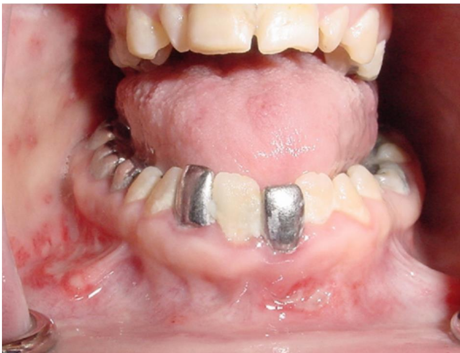
Slika 4. Multiple aftozne promjene na desnoj bukalnoj i vestibularnoj sluznici te linearna ulceracija u donjem labijalnom vestibulumu. Preuzeto: (20)

bolesti, no ustanovilo se da pacijenti s upalnim bolestima crijeva imaju češće rekurentne aftozne stomatitise. Najvjerojatnije se radi o posljedici manjka željeza, vitamina B12 i folne kiseline uzrokovanog malapsorpcijom. Liječe se topikalnom primjenom kortikosteroida i po potrebi lokalnim anestetikom. Poseban tip rekurentnih aftoznih ulceracija karakterističan za Crohnovu bolest su dugačke, linearne ulceracije smještene u gornjem ili donjem vestibulumu (18).