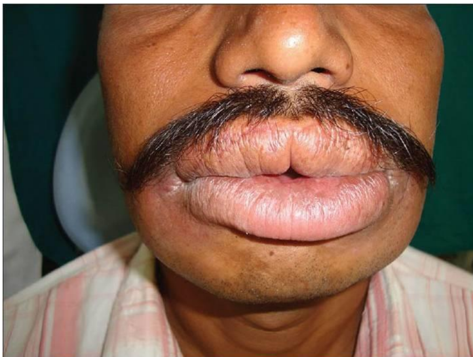
Slika 5. Oteklina lica i usana. Preuzeto: (19)

vetrikalnim fisurama i dubokim linearnim ulceracijama obično na bukalnom sulkusu s hiperplastičnim poljima. Liječi se topikalnom primjenom tacrolimusa i intralezijским kortikosteroidnim injekcijama (18).