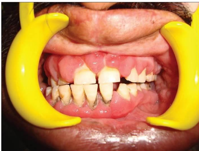
Slika 3. Hiperplastični gingivitis.

Hiperplastični gingivitis karakterizira edematozna, granulirana i hiperplastična gingiva do mukogingivalne granice (18). Oralna higijena je otežana, a plak koji se nalazi na zubima je tu najčešće sekundarno (7). Liječi se terapijom osnovne bolesti i topikalnim kortikosteroidima. Valja napomenuti da je hiperplastični gingivitis izrazito rezistentan na topikalnu terapiju (18).