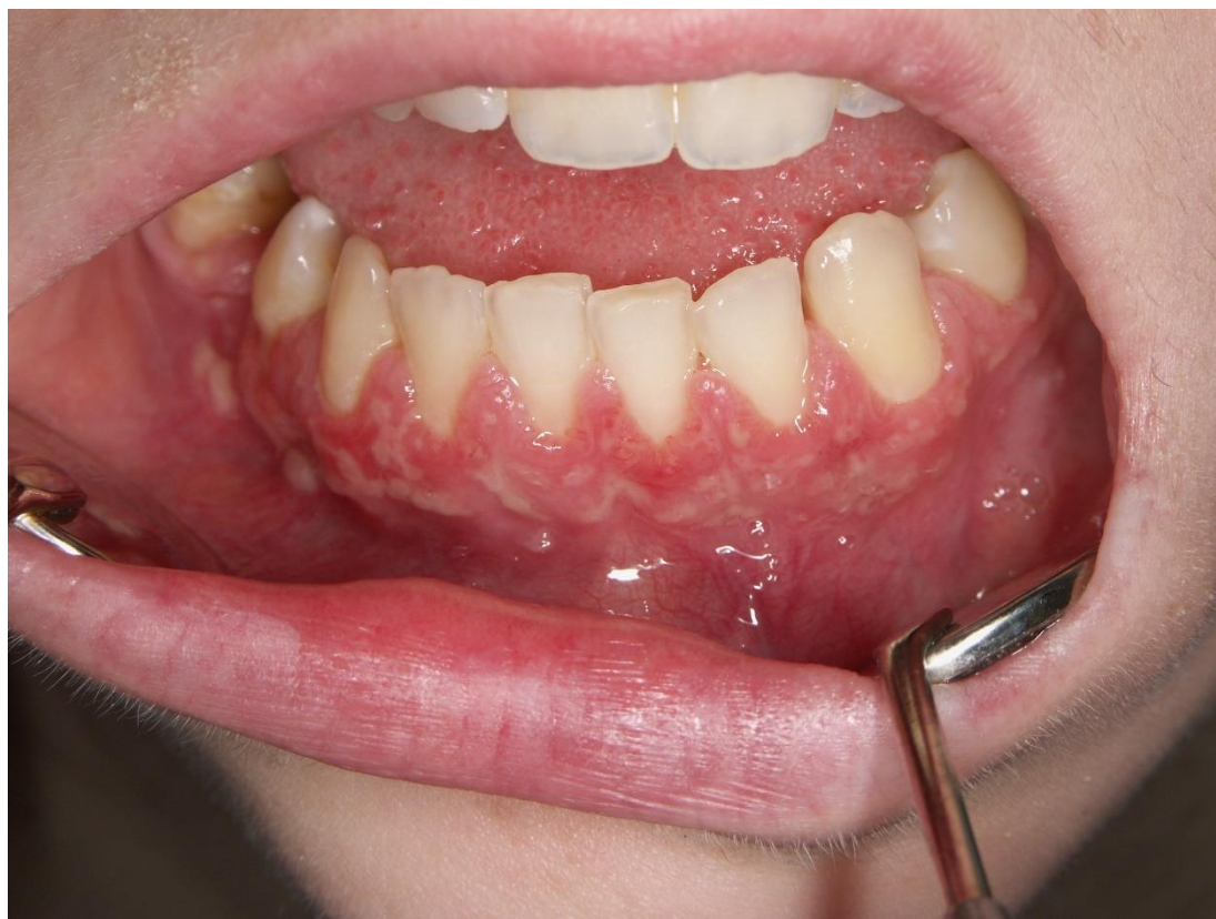
Slika 8. Pyostomatitis vegetans.

naspram žena, s omjerom 2:1 do 3:1 (3, 25). Pyostomatitis vegetans je vjerojatno posljedica učinka cirkulirajućih imunokompleksa, čije stvaranje potiču antigeni iz lumena crijeva ili oštećene sluznice kolona (3). Nalazi direktne i indirektne imunofluorescencije su negativni, što pomaže u razlikovanju od pemfigusa i ostalih buloznih bolesti (26). Biopsija nam pokazuje intraepitelni i subepitelni mikroapsces i kroničnu upalu s eozinofilima (25, 27). Pacijent može imati temperaturu, povećane i tvrde submandibularne limfne čvorove te može osjećati bol (18). Liječenje je fokusirano na kontrolu primarne bolesti. Ukoliko lezije i dalje perzistiraju mogu se koristiti i topikalni kortikosteroidi, ali nema puno podataka o njihovoj učinkovitosti. Pyostomatitis vegetans se potpuno povlači nakon totalne kolektomije, što govori u prilog teoriji o cirkulirajućim imunokompleksima kao uzroku stanja (23, 26).