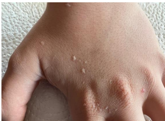
Slika 3. Mladenačke bradavice (verrucae planae)

Dijagnoza se postavlja temeljem karakteristične kliničke slike.