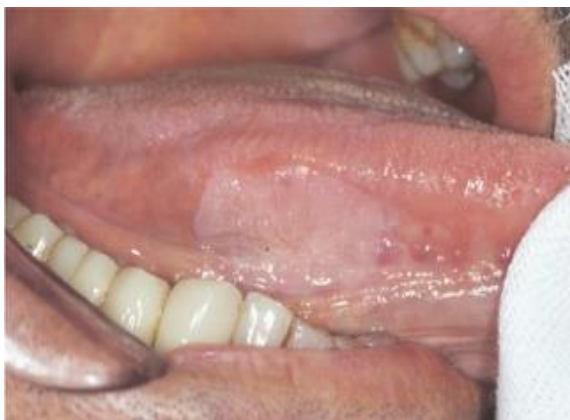
Slika 10. Verruca vulgaris. Preuzeto iz: Testi D, Nardone M, Melone P, Cardelli P, Ottria L, Arcuri C. HPV and oral lesions: preventive possibilities, vaccines and early diagnosis of malignant lesions. Oral Implantol (Rome) . 2016;8(2-3):45-51. This work is licensed under a Creative Commons Attribution-NonCommercial-NoDerivatives 4.0 International License.

Pojavljuje se kao sesilna i čvrsta egzofitična tvorba, široke baze, najčešće na gingivi, labijalnoj sluznici, komisuri, tvrdom nepcu te jeziku (slika 10), najčešće uzrokovana HPV-om tipa 2 i 57 (40-44). Liječi se ekscizijom.