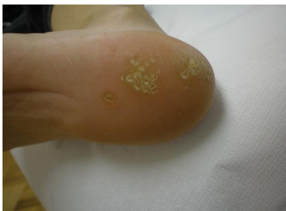
Slika 2. Plantarne bradavice (verrucae plantares)