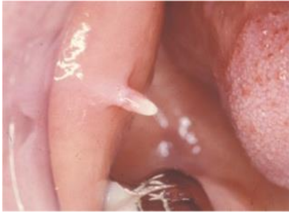
Slika 9. Condyloma acuminatum. Preuzeto iz: Testi D, Nardone M, Melone P, Cardelli P, Ottria L, Arcuri C. HPV and oral lesions: preventive possibilities, vaccines and early diagnosis of malignant lesions. Oral Implantol (Rome) . 2016;8(2-3):45-51. This work is licensed under a Creative Commons Attribution-NonCommercial-NoDerivatives 4.0 International License.