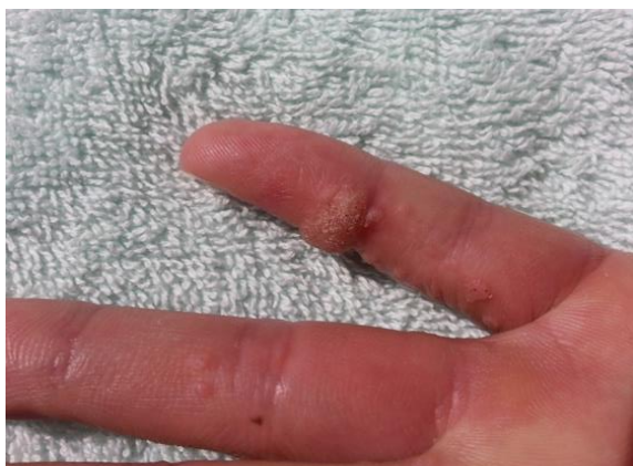
Slika 1. Obične bradavice (verrucae vulgares)

Klinička prezentacija običnih bradavica vidi se na slici 1, plantarnih bradavica na slici 2 te mladenačkih bradavica na slici 3. Obične bradavice su čvrste, okrugle ili nepravilne izrasline grube površine. Plantarne bradavice se javljaju na tabanima te su spljoštene i okružene grubom kožom. Mladenačke bradavice su poput mrlja koje se javljaju u skupinama (13).