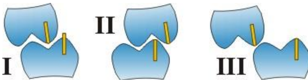
Slika 2. Klase po Angleu. Preuzeto iz: (19)

zuba maksile. Meziobukalna kvržica gornjeg prvog kutnjaka nalazi se iza fisure prvoga donjeg kutnjaka (3).