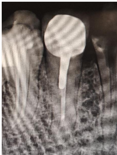
Slika 1: Rendgenska snimka individualne metalne nadogradnje