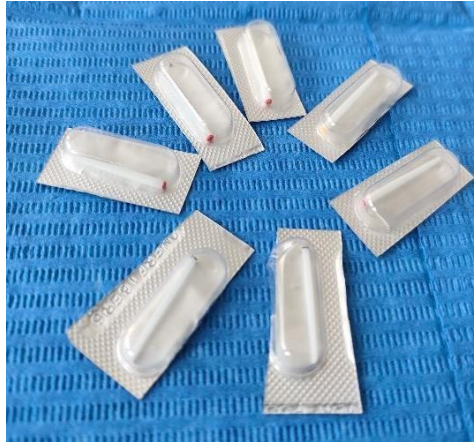
Slika 2: Konfekcijski bezmetalni kompozitni intrakanalni kolčići