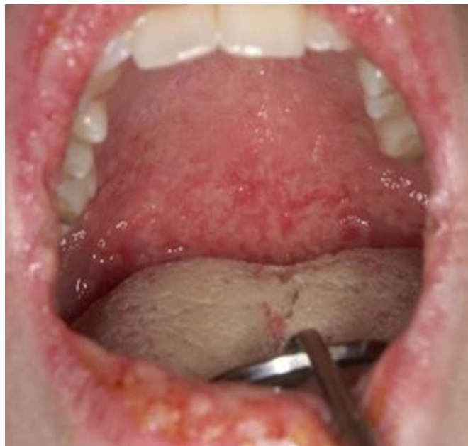
Slika 2. Pyostomatitis vegetans.

Također, ulcerozni kolitis može uzrokovati pyostomatitis vegetans, rijedak oralni simptom koji rezultira žutim, gnojnim lezijama koje često imaju karakterističan izgled „staze puža“.