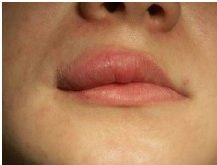
Slika 1. Orofacijalna granulomatoza.

detaljan pregled probavnog sustava otkriva tipične promjene karakteristične za CD. Taj oblik bolesti naziva se Crohnova bolest usne šupljine (6).