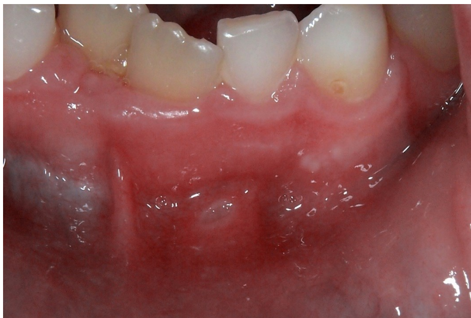
Slika 4. Minorna aftozna ulceracija.

Primijećeno je da se kao prvi znak celijakije, prije nego što se pojave simptomi koji upućuju na oštećenje crijeva, mogu javiti tvrdokorne i ponavljajuće afte u ustima ili oštećenja cakline trajnih zubi (6). Kod bolesnika s malapsorpcijom, celijakija se očituje aftoznim ulceracijama na oralnoj sluznici. U odrasloj dobi, prisutne su manje aftozne ulceracije poznate kao aphtae minores (5). Osim afti javlja se eritem, ulkusi, atrofični glositis te osjećaj boli, žarenja i suhoće. Pothranjenost, posebno nedostatak željeza, folne kiseline i vitamina B12, koji se često javlja kod bolesnika koji se ne pridržavaju bezglutenske prehrane, može pridonijeti tim promjenama (32). Čini se da je incidencija celijakije i recidivirajućih afti veća nego što se ranije mislilo, dok se kod djece može primijetiti hipoplazija zubne cakline (5).