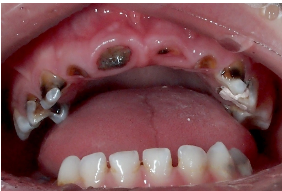
Slika 5. Rani dječji karijes.

Roditelje treba savjetovati o pravilnoj prehrani, pružiti upute o oralnoj higijeni, važnosti fluora i dodatnim izvorima fluora, uključujući pastu za zube i profesionalnu primjenu fluora. Ukoliko postoji indikacija, potrebno je napraviti rendgenski pregled kako bi se otkrio karijes u ranoj fazi, a stomatološke bolesti treba pravovremeno liječiti. Djeca s prirođenim srčanim greškama trebaju uvijek imati zdrave zube, ali to je posebno važno ukoliko se planira kardiokirurški zahvat. Detaljni stomatološki pregled, uključujući odgovarajuće rendgenske snimke, treba obaviti prije nego se dijete podvrgne operaciji srca. Na taj način se sprječava odgađanje operativnog zahvata i smanjuje rizik za IE (35,37).