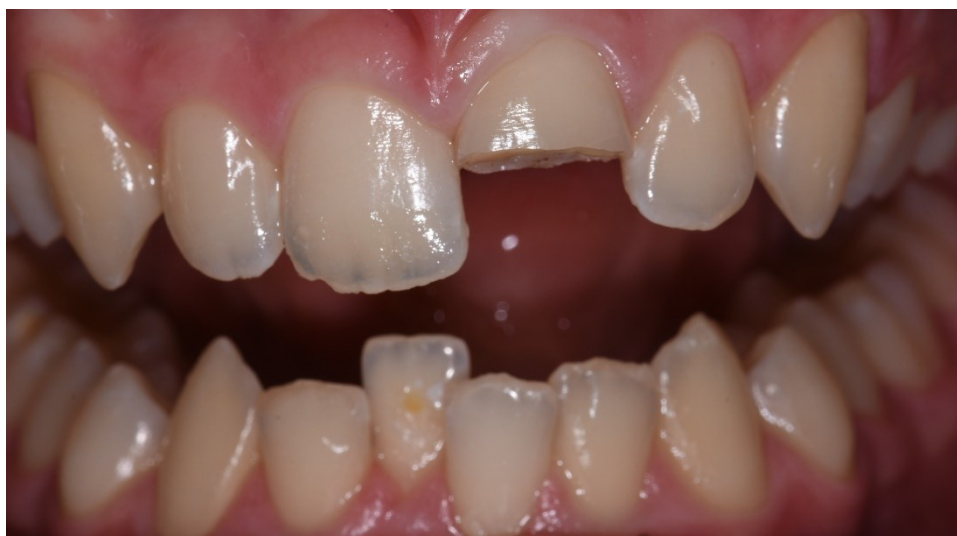
Slika 1. KomPLICIRANA fraktura krune privremeno sanirana kompozitnim zavojem.

Nakon šest tjedana pacijent dolazi na kontrolu i izradu trajne restauracije. Ispituje se senzibilitet zuba 21, koji opet ispada pozitivan. Pacijent nema subjektivnih smetnji te se kreće u izradu trajne restauracije. Skida se kompozitni zavoj kako bi se oslobodili rubovi cakline i osigurala mikromehanička veza kompozitnog materijala (Slika 7). Površina zuba se jetka 35-postotnom ortofosfornom kiselinom (Slika 8) u trajanju od 30 sekundi, nakon čega se ispere i posuši. Postavlja se celuloidna matrica oko zuba 21. Na površinu zuba nanosi se adheziv Futurabond U (Voco, Cuxhaven, Njemačka) putem aplikatora (Slika 9) te se adheziv posuši i polimerizira. Izrađuje se prvi caklinski sloj, pri čemu se izabire A2 boja GrandioSO (Voco, Cuxhaven, Njemačka). Tako postavljen sloj se polimerizira (Slika 10). Kao dentinska masa postavlja se tekući kompozit Final Touch (Voco, Cuxhaven, Njemačka) u narančastoj (Slika 11) i žutoj boji. Zatim se postavlja završni caklinski sloj do incizalne trećine krune zuba u boji A2 GrandioSO (Voco, Cuxhaven, Njemačka) te polimerizira. Na incizalnu trećinu i preko caklinskog sloja stavlja se translucetna boja GrandioSO (Voco, Cuxhaven, Njemačka) i polimerizira. Slijedi poliranje dijamantrnim polirerom, crvenim i žutim diskom i gumicom.