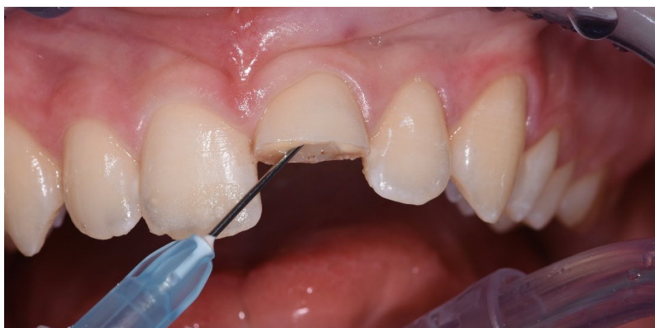
Slika 4. Postava kalcijeva hidroksida na područje eksponirane pulpe.