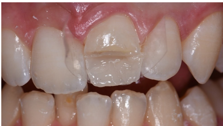
Slika 10. Prikaz prvog caklinskog sloja A2 boje nakon polimerizacije ( GrandioSO ).