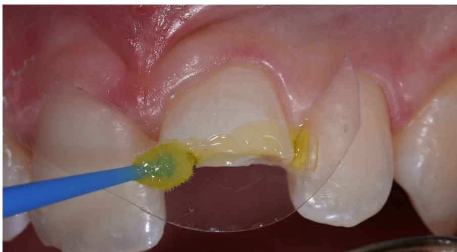
Slika 9. Premazivanje adhezivom putem aplikatora ( Futurabond U ).