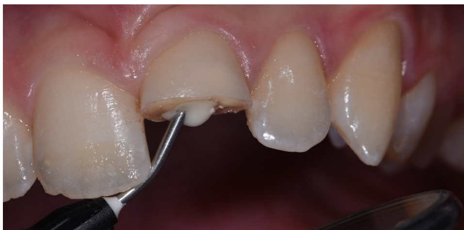
Slika 5. Postava staklenoionomernog cementa preko paste \text{Ca(OH)}_2 .