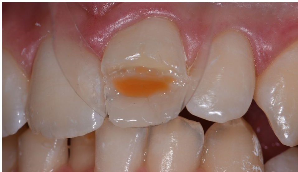
Slika 11. Postava dentinske mase od tekućeg kompozita ( Final touch ).