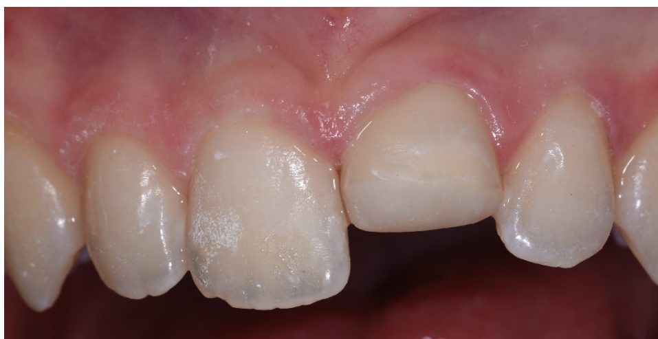
Slika 6. Izgled kompozitnog zavoja nakon polimerizacije.