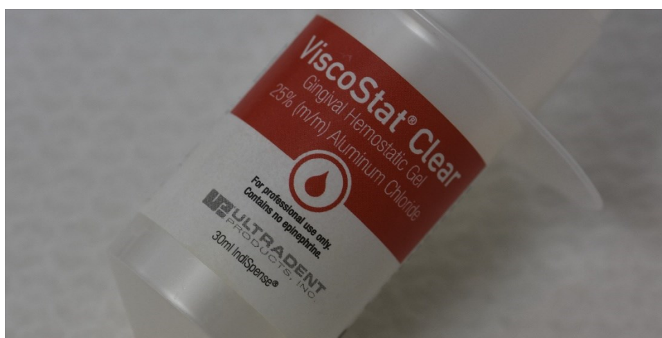
Slika 3. Hemostatik korišten za postizanje hemostaze na bazi aluminijeva klorida.