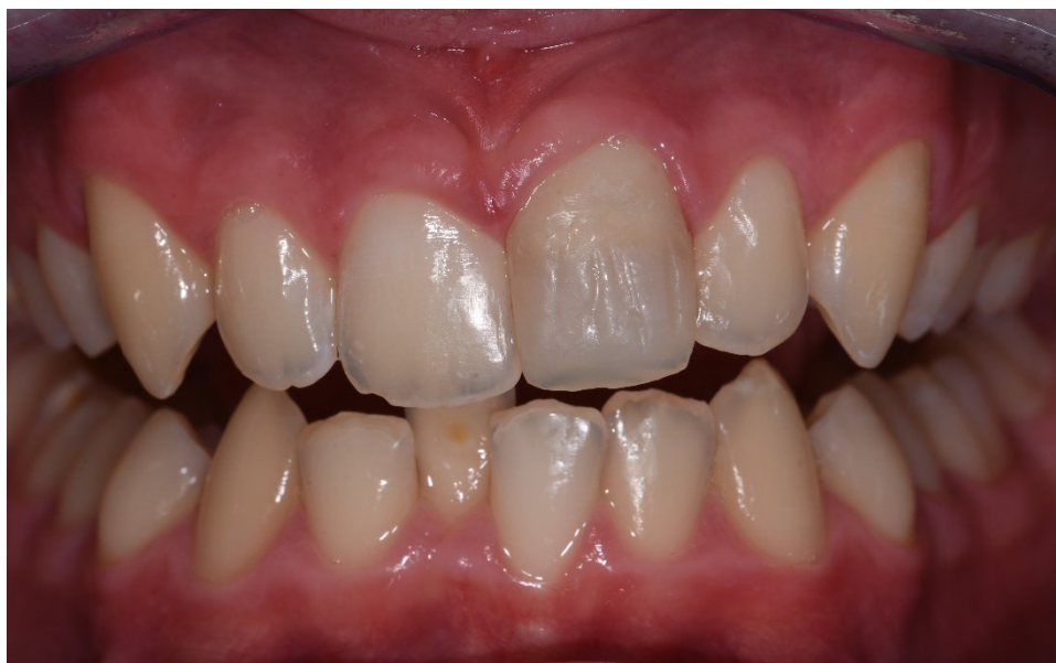
Slika 12. Izgled završne kompozitne restauracije.