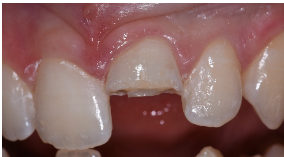
Slika 7. Izgled krune nakon skidanja kompozitnog zavoja.