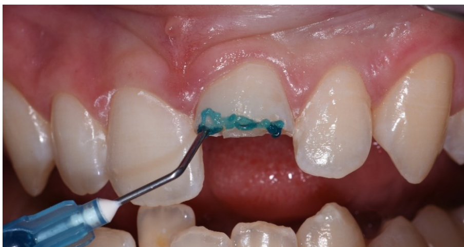
Slika 8. Jetkanje 35-postotnom ortofosfornom kiselinom.