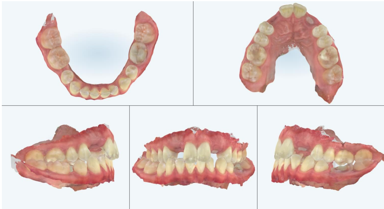
Slika 1. Klinički prikaz stanja pacijenta s hipodoncijom gornjih lateralnih sjekutića, donjih drugih pretkutnjaka i impakcijom gornjih očnjaka (digitalni otisak).