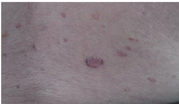
Slika 12. Površinski BCC