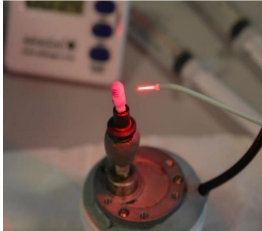
Slika 5. Cirkonij-oksadni implantat smješten u rotacijski motor i tretiran diodnim laserom Helbo® (Helbo, Grieskirchen, Austria).

Ultraljubičasto (UV, engl. Ultraviolet ) zračenje i hladna atmosferska plazma mogu inducirati ekscitaciju elektrona, povećavajući površinsku energiju cirkonijevog dioksida. Kontaktni kut vode pjeskarenih površina smanjio se sa 51^\circ na 9,4^\circ nakon tretmana ultraljubičastim svjetlom od 15 minuta čime cirkonijev dioksid postiže ultrahidrofilno stanje. Histomorfometrijska analiza pokazala je da su uzorci tretirani ultraljubičastim svjetlom imali bolju oseointegraciju i jači kontakt kosti i implantata te da su četiri tjedna nakon implantacije bili gotovo u potpunosti okruženi s kosti, naspram netretiranih uzoraka koji su i dalje sadržavali fibrozno vezivno tkivo (54). Također je zabilježena pojačana stanična aktivnost i gustoća ljudskih gingivalnih fibroblasta i ekspresija integrina na cirkonij-oksadnim površinama tretiranim hladnom atmosferskom plazmom u razdoblju od 30 i 60 sekundi, prilikom korištenja helija kao plina nosača. Nakon tretmana od 90 sekundi i duže, aktivnost ovih stanica krenula je opadati, što upućuje da hladna atmosferska plazma ima rano i kratko pozitivno djelovanje na cirkonij-oksadnoj površini (55). Plazmom obrađene cirkonijske površine pokazale su povećanje nanotvrdoće zbog povećanog sadržaja cirkonija u premazu te povećani osteogeni potencijal, bolja mehanička svojstva i otpornost na koroziju (56).