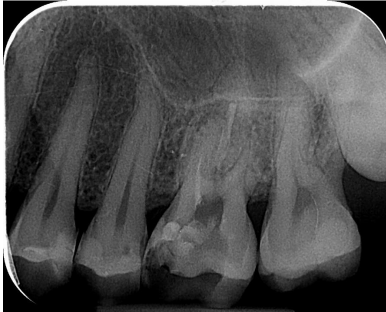
Slika 4. Na rtg snimci vidljiv je slomljeni instrument u meziobukalnom kanalu zuba 26.