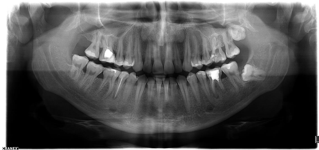
Slika 6. Na rtg snimci vidljivo je kratko punjenje svih korijenskih kanala zuba 36.