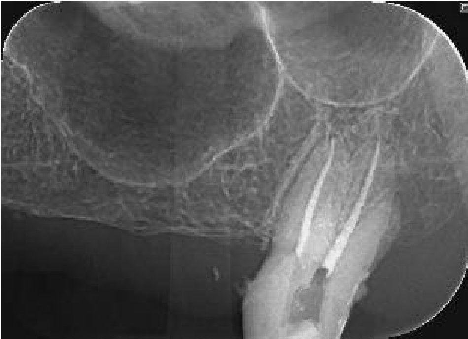
Slika 1. Na rtg snimci vidljiv je neinstrumentirani distobukalni korijenski kanal zuba 27.

Izradom prevelikog trepanacijskog kaviteta uklanja se previše tvrdog zubnog tkiva što oslabljuje zub. Ako se na vrijeme ne prepozna prolazak svrdla kroz pulpnu komoricu i nastavi se trepanirati, može doći do ijtrogene perforacije u parodontno tkivo (2). Uzroci koji dovode do takvih pogrešaka mogu biti nepravilna usmjerenost svrdla u odnosu na uzdužnu os zuba ili neodgovarajući izbor veličine svrdla, npr. preveliko svrdlo u odnosu na veličinu pulpne komorice (5). Nepažnja s obzirom na nagib uzdužne osi zuba, u odnosu prema susjednim zubima i alveolarnoj kosti, može dovesti do “izdubljivanja” ili perforacije krune ili korijena (1). Perforacije je potrebno sanirati, a materijali izbora su kalcijevi silikatni cementi poput MTA, Biodentina i biokeramike (3). Važno je da se pogreške rano prepoznaju kako ne bi došlo do daljnjih komplikacija. Trenutačno zatvaranje oštećenja smanjuje mogućnost pojave parodontne bolesti (1).