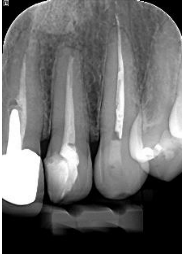
Slika 5. Na rtg snimci vidljiv je prepunjen korijenski kanal zuba 23.