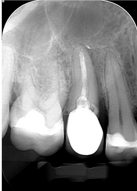
Slika 7. Na rtg snimci vidljiva je radiolucencija kosti u obliku slova J što upućuje na vertikalnu frakturu korijena zuba 15.