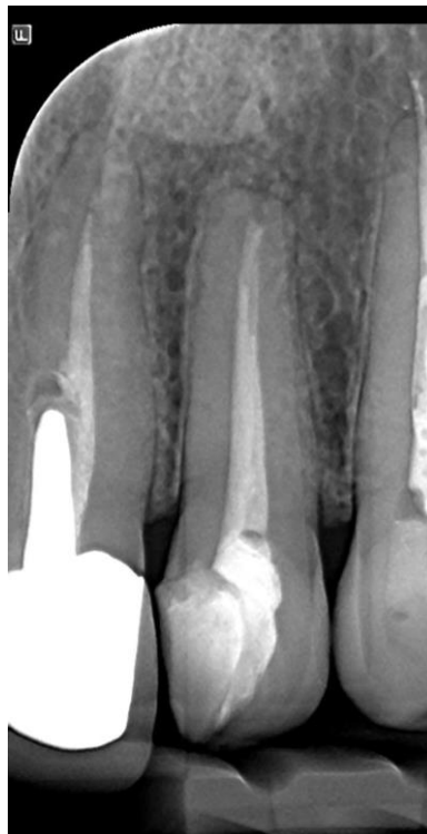
Slika 8. Na rtg snimci vidljiva je pogreška tijekom preparacije za postavljanje intrakanalnog kolčića, zub 21, tako da cementirani kolčić ne prati smjer kanala.

Za pravilnu preparaciju ležišta za intrakanalne kolčiće potrebno je poznavanje anatomije korijena kako bi se odredila dubina i veličina dosjeda. Nepravilna obrada i loša procjena mogu dovesti do proboja stijenke na bilo kojoj razini korijena ( Slika 8.). Da bi se to spriječilo, gutaperka se uklanja do potrebne razine zagrijanim vertikalnim potiskivačem ili električnim uređajima za zagrijavanje. Ako se gutaperka uklanja samo svrdlom, može doći do perforacije stijenke kanala (1). Duljina kolčića treba iznositi dvije trećine duljine korijenskog kanala te oko postavljenog kolčića mora biti najmanje 1 milimetar preostale zubne strukture (30). Pokazatelj nezgode naglo je krvarenje. Prilikom cementiranja kolčića, uslijed djelovanja sila, može doći do nastanka vertikalne frakture korijena. Terapija zuba s vertikalnom frakturom je ekstrakcija. Prognoza zuba s perforiranom stijenkom korijena ovisi o mjestu i veličini perforacije, mogućnosti njenog zatvaranja i veličini korijena. Nekirurški pokušaj liječenja bolji je ako se kolčić može ukloniti (1).