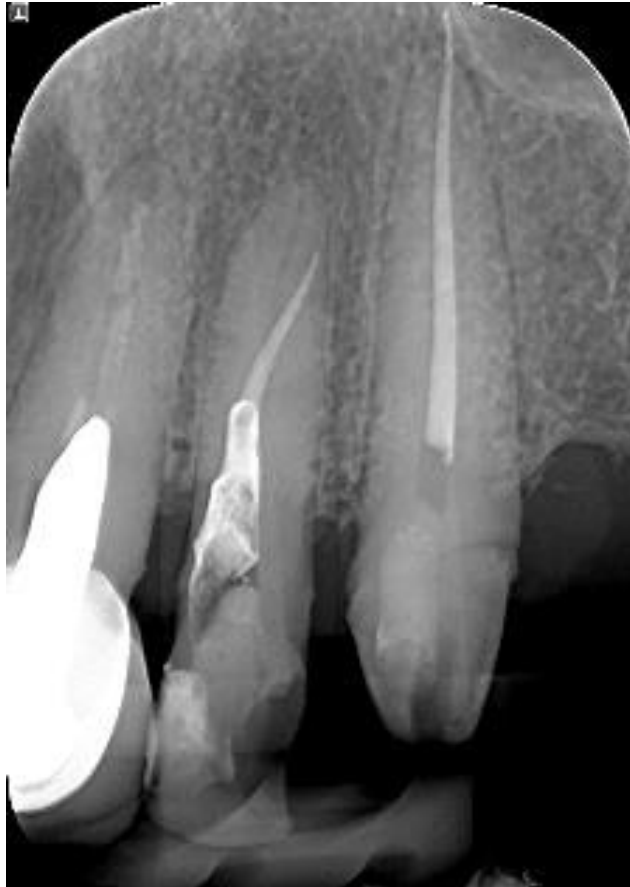
Slika 2. Na rtg snimci vidljiva je perforacija korijenskog kanala u apikalnoj trećini korijena kod zuba 22.

nekirurškim postupcima ne može sanirati nastala perforacija (1). Mogućnosti kirurškog liječenja su: bikuspidacija, hemisekcija, apikotomija, amputacija korijena i replantacija s namjerom (1, 8). Neliječena ili neprepoznata perforacija furkacije obično dovodi do bolesti parodonta i komunikacije s gingivalnim sulkusom, stoga ju je u što kraćem vremenu potrebno zatvoriti (1).