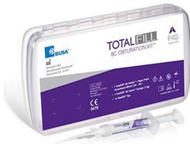
Slika 14. Totalfill. Preuzeto iz: (49).