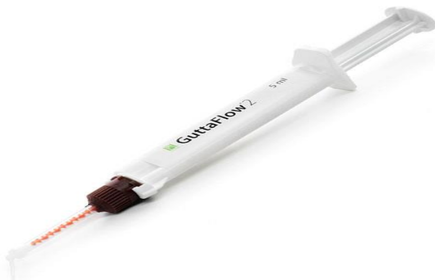
Slika 8. GuttaFlow. Preuzeto iz: (38).