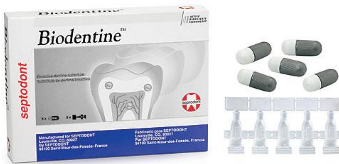
Slika 13. Biodentin. Preuzeto iz: (48).