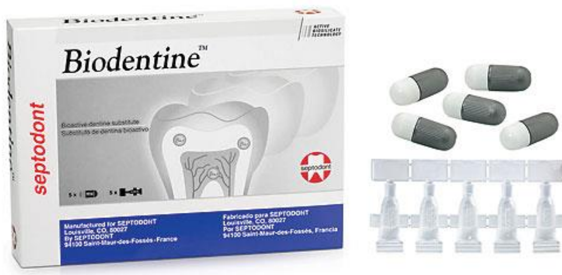
Slika 13. Biodentin.